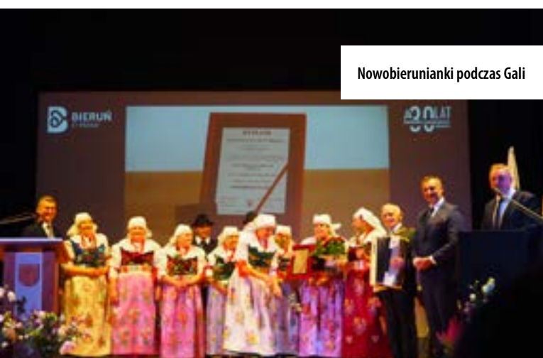
Nowobierunianki podczas Gali