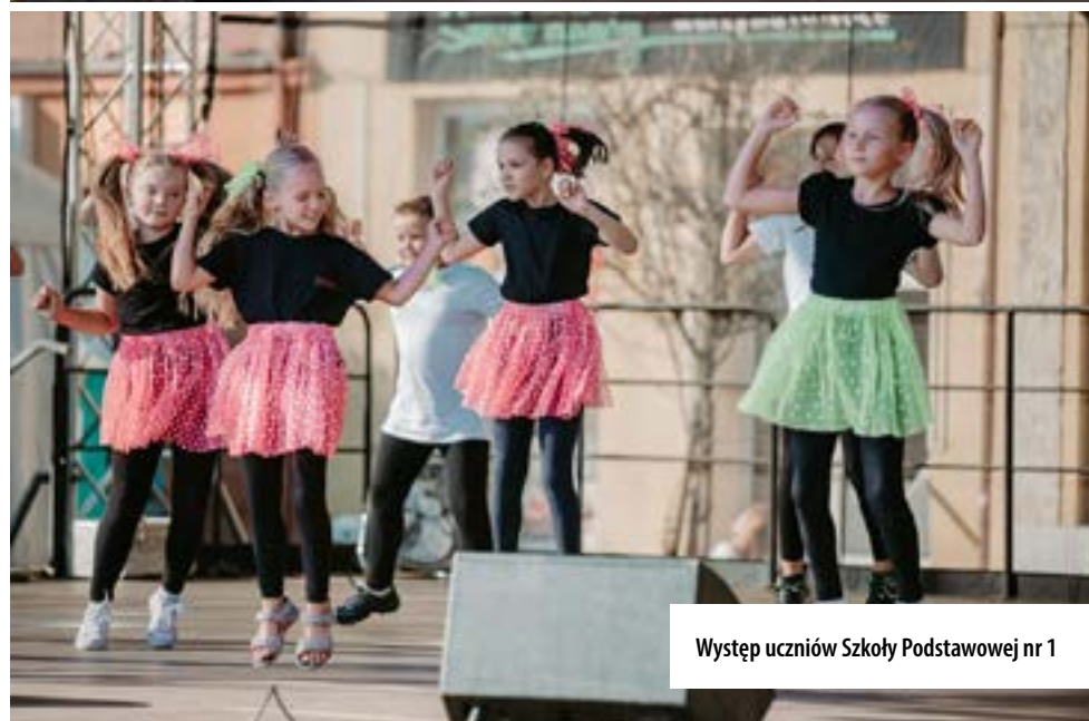
Występ uczniów Szkoły Podstawowej nr 1