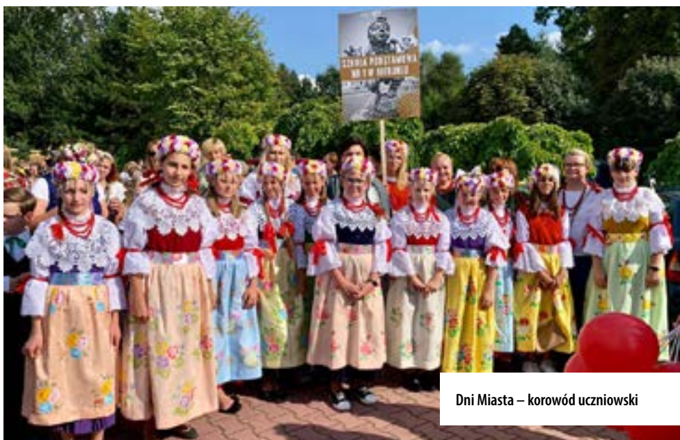
Dni Miasta – korwód uczniowski