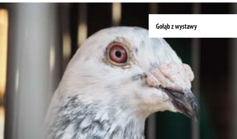
Gołąb z wystawy