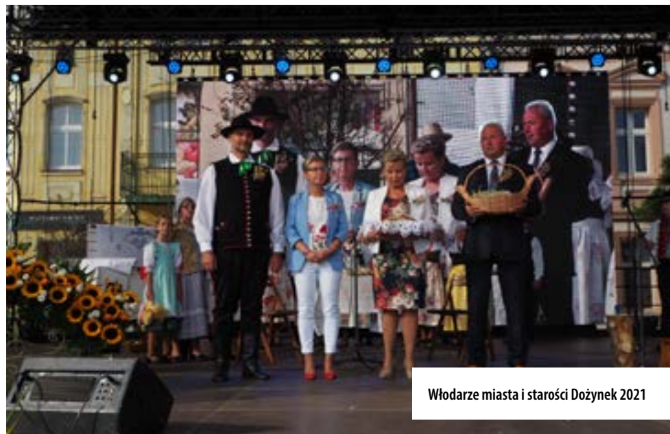
Włodarze miasta i starości Dożynek 2021