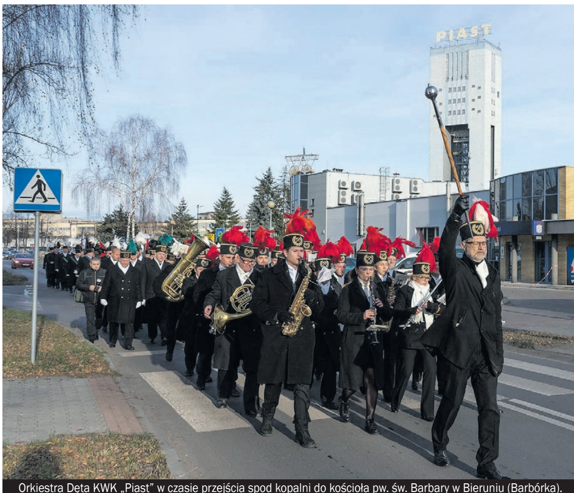
Orkiestra Dęta KWK „Piast” w czasie przejścia spod kopalni do kościoła pw. św. Barbary w Bieruniu (Barbórka).

24 listopada 2023 r. w Muzeum Górnictwa Węglowego w Zabrzu odbyła się uroczystość w