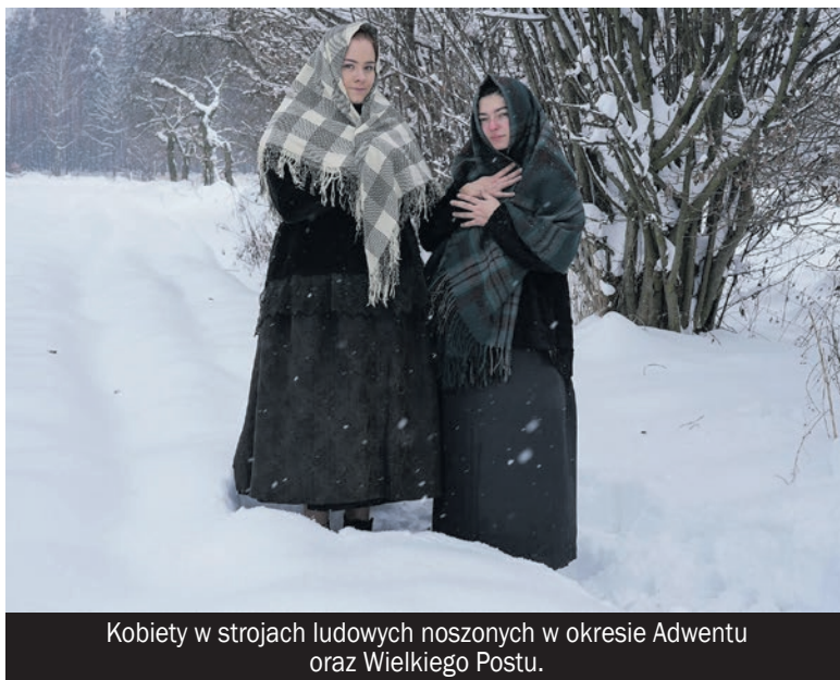
Kobiety w strojach ludowych noszonych w okresie Adwentu oraz Wielkiego Postu.