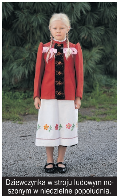
Dziewczynka w stroju ludowym noszonym w niedzielne popołudnia.

Pomysłodawczyni oraz koordynator projektów badawczych dofinansowanych ze środków Ministra Kultury i Dziedzictwa Narodowego: „Rok gospodarski na ziemi pszczyńskiej” (2015) oraz „Wisła - wodna granica. Tożsamość kulturowa mieszkańców pogranicza śląsko-małopolskiego” (2017-2018), realizowanych przez Muzeum Miejskie w Tychach oraz „W Bieruniu na grubie” (2022), „Kod kulturowy historycznej ziemi pszczyńskiej” (2021-2022) i „Route 44” (2023-2024), realizowanych przez Muzeum Miejskie w Bieruniu (w organizacji).