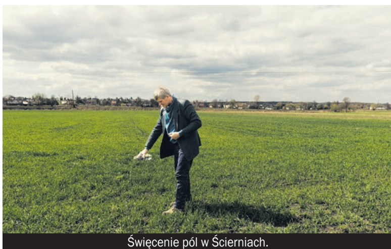
Święcenie pól w Ścierniach.

W kategorii „Dokonania z zakresu inicjatyw edukacyjnych oraz popularyzacji dziedzictwa kulturowego, w tym wydawnictwa multimedialne” Muzeum Miejskie w Bieruniu (w organizacji) zdobyło nagrodę główną (20 000 zł) za projekt „Kod kulturowy historycznej ziemi pszczyńskiej”.