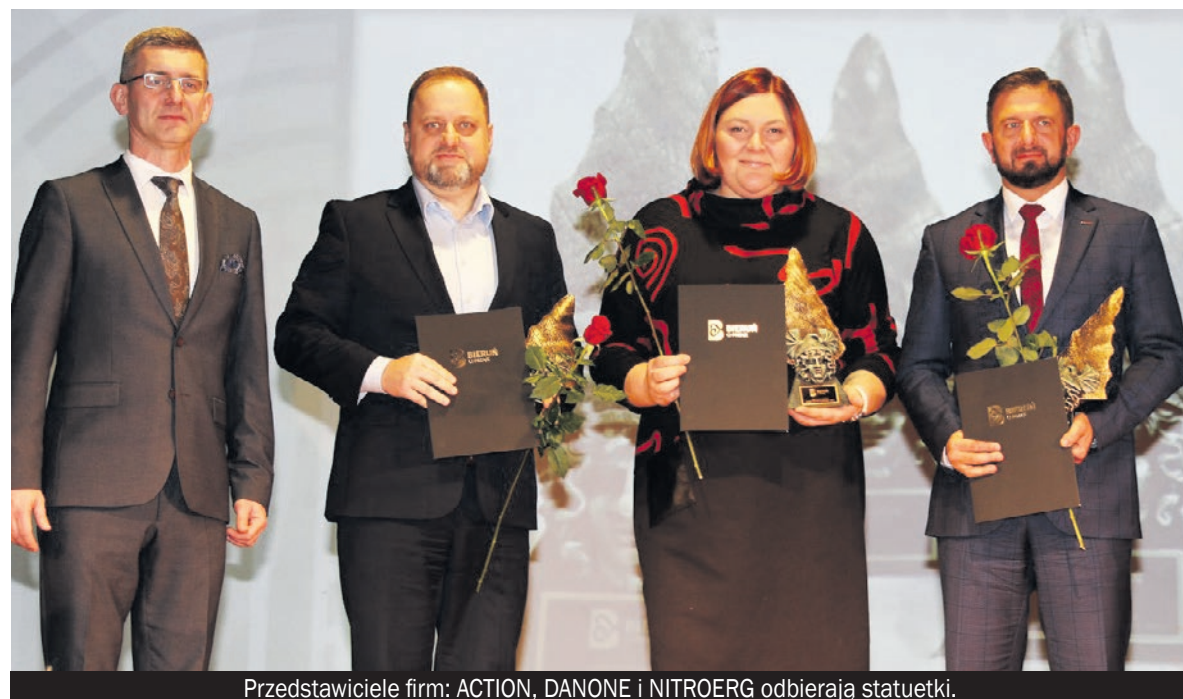
Przedstawiciele firm: ACTION, DANONE i NITROERG odbierają statuetki.