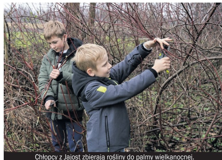
Chłopcy z Jajost zbierają rośliny do palmy wielkanocnej.

Wyróżnienia otrzymali: Muzeum Górnośląskie w Bytomiu za „Program edukacyjny do wystawy „Schulz wg The Krasnals. Ignorabimus. By nikt nie porywał się na odgadywanie za-