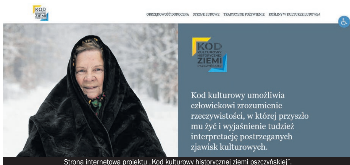
Strona internetowa projektu „Kod kulturowy historycznej ziemi pszczyńskiej”.