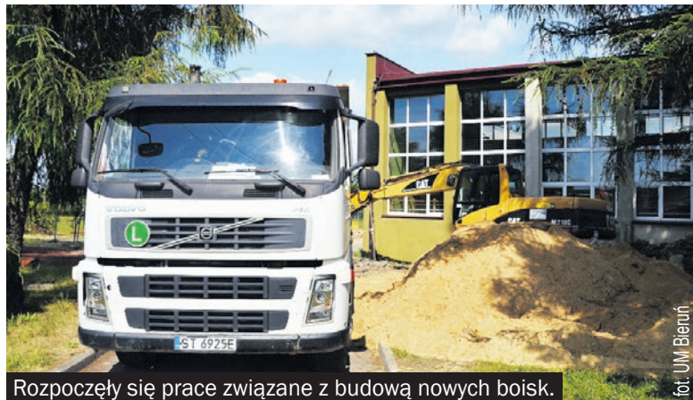
Rozpoczęły się prace związane z budową nowych boisk.

Ruszyła budowa nowych boisk przy Szkole Podstawowej nr 3, ale to nie wszystko. Powstanie jedna z najciekawszych tego typu inwestycji w Bieruniu.