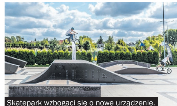
Skatepark wzbogaci się o nowe urządzenie.