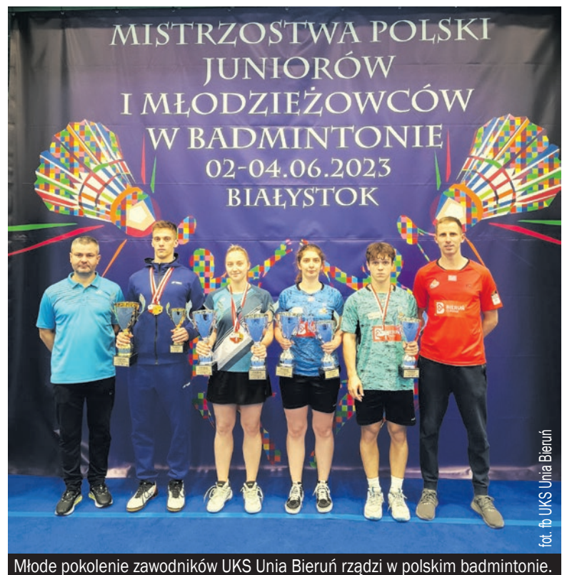
Młode pokolenie zawodników UKS Unia Bieruń rządzi w polskim badmintonie.