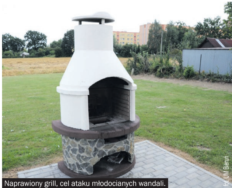
Naprawiony grill, cel ataku młodocianych wandalii.

Nie ma co narzekać na miejski monitoring, bo - jak się przekonałiśmy w Bieruniu - jest to skuteczne narzędzie do walki z wandalami.