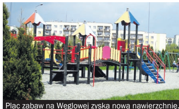
Plac zabaw na Węglowej zyska nową nawierzchnię.

stycji jest doposażenie skateparku przy ul. Królowej Jadwigi. To ulubione przez bieruńską młodzież miejsce wzbogaci się o nowe urządzenie Quarter Pipe. Z kolei na sąsiadującym ze skateparkiem placu zabaw wykonana zostanie nowa, bezpieczna, amortyzująca upadki nawierzchnia poliuretanowa.