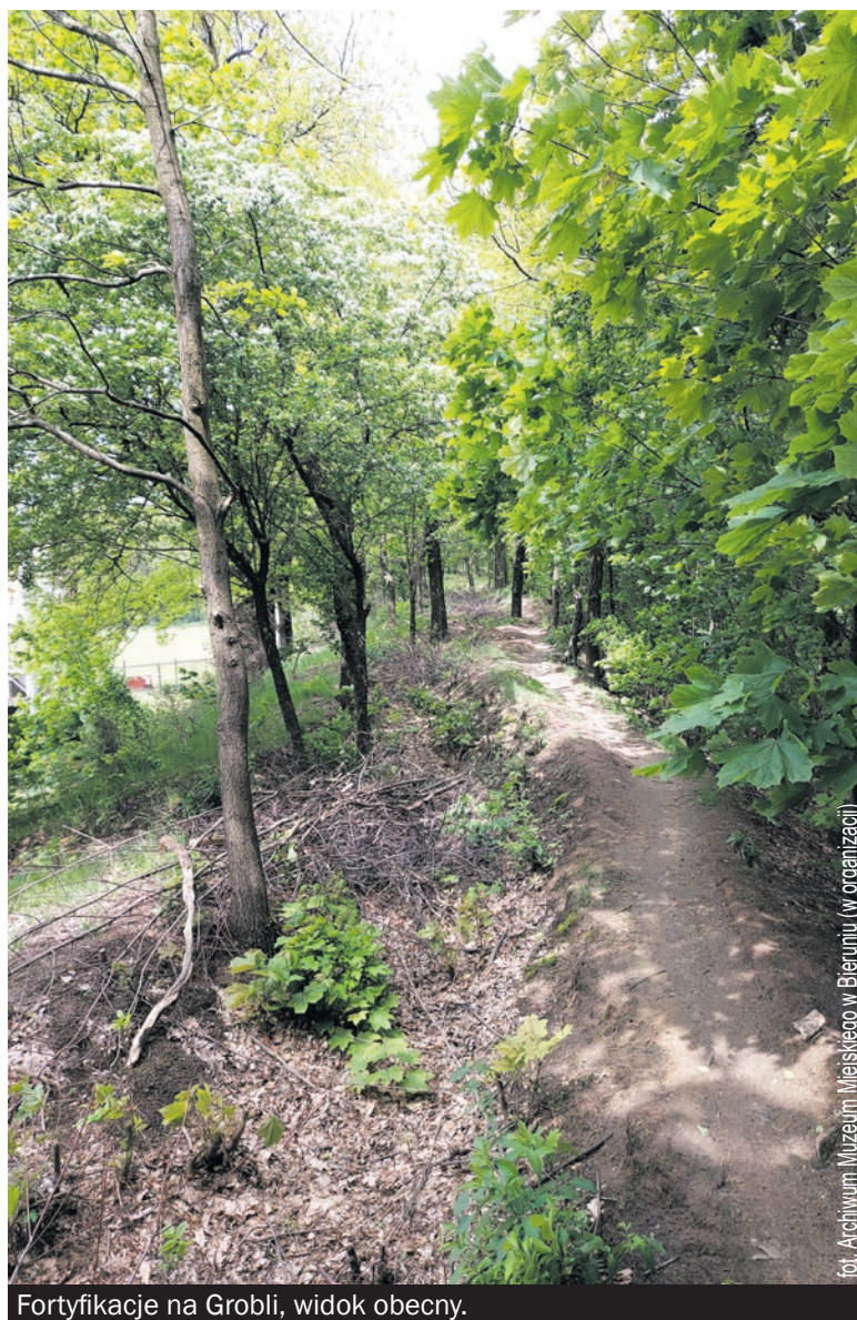
Fortyfikacje na Grobli, widok obecny.

Zostali rozlokowani od Wygorzela, wzdłuż rzeki Mlecznej, poprzez Groblę, aż do Jajost. Sztab dywizji zorganizowano w Ratuszu, natomiast dowódca dywizji generał Friedrich - Carl Rabe von Pappenheim kwaterował w jednej z miejskich willi. 25 stycznia w obliczu nacierającej Armii Czerwonej władze miejskie rozpoczęły ewakuację na zachód. Rosyjskie lotnictwo bombardowało miasto. Dwie bomby spadły na południe od Sanktuarium św. Walentego zabijając dwie osoby cywilne i ciężko raniąc kolejną. Na Groblę spadło sześć bomb jednak nie wyrządziły poważnych szkód. Niemieckiej artylerii przeciwlotniczej udało się