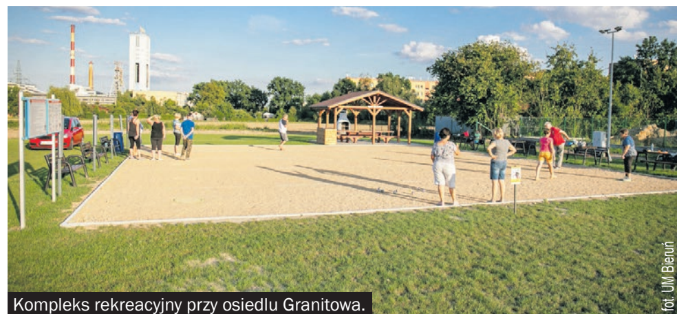
Kompleks rekreacyjny przy osiedlu Granitowa.

Teren jest oświetlony i monitorowany. Niebawem wzbogaci się też o nowe nasadzenia.