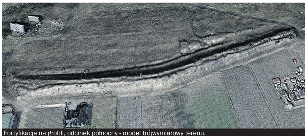
Fortyfikacje na grobli, odcinek północny - model trójwymiarowy terenu.

nach nie było służb, które mogłyby się tym zająć, a walające się w wielu miejscach pociski, miny i granaty stwarzały poważne zagrożenie, zwłaszcza dla dzieci niezających sobie sprawy z niebezpieczeństwa. Wiele z umocnień została zlikwidowana, a już w 1946 roku w planie zagospodarowania przestrzennego władze miasta planowały urządzić na Grobli planty.