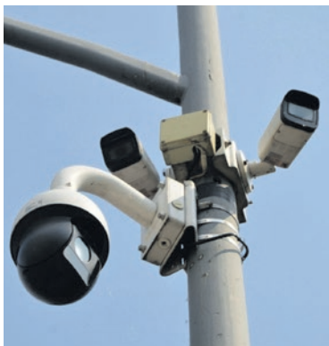
Dzięki zapisom z monitoringu, sprawcy zostali skutecznie ukarani.

nie miejskiego boiska przy ul. Granicznej w Bieruniu. Wpadli na pomysł, by włamać się do pomieszczenia gospodarczego, a następnie zniszczyć