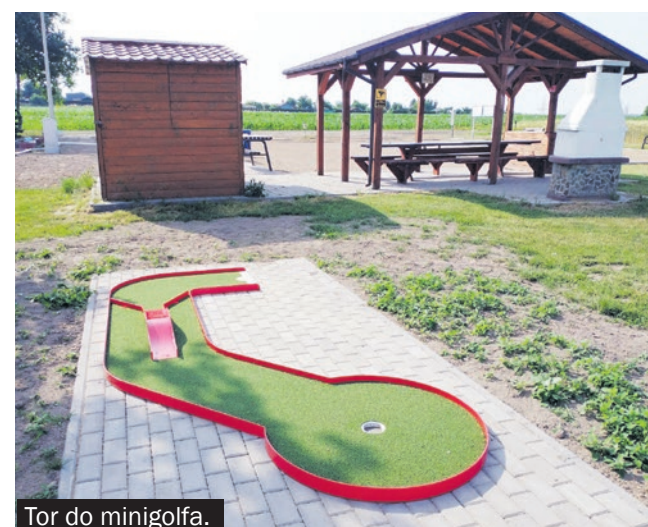
Tor do minigolfa.

Tory znajdują się w pobliżu kompleksu boisk do gry w petanque, w sąsiedztwie Powiatowego Zespołu Szkół. W tej części miasta zrealizowano wiele zadań w ramach poszczególnych edycji Budżetu Obywatelskiego.