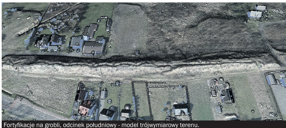
Fortyfikacje na grobli, odcinek południowy - model trójwymiarowy terenu.

Dla rosyjskich żołdatów po tej stronie Wisły znajdowała się już III Rzesza i znienawidzeni Niemcy - nie rozumieli trudnej sytuacji miejscowej ludności. Do ochrony powołano naprędce milicję obywatelską, która ofiarnie starała się bronić mieszkańców. Szczęśliwie żaden z pocisków nie trafił składow pocisków zlokalizowanego przy kościele pw. św. Bartłomieja. Do naprawy dachów uszkodzonych budynków wykorzystywano deski z szalunków okopów z Grobli. Rowy przeciwzołgowe i część okopów zostały zasypane na przełomie zimy i wiosny 1945 roku przez grupę około 40 - 50 osób, zatrzymanych i skierowanych do tego zadania za przynależność do I i II grupy Deutsche Volksliste. Po walkach o miasto w okolicach tego zabytku miejscowa ludność wyrzucała wojenne pozostałości w postaci amunicji i pocisków (były wrzucane do wody). Obecnie działania takie wydawać by się mogły skrajnie nieodpowiedzialne, ale należy pamiętać, przed stworzeniem działającej administracji na tych tere-