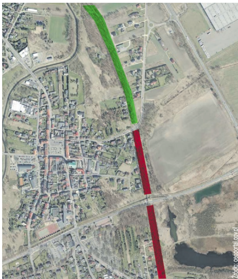
Bieruńska Grobla. Na zielono zaznaczony obszar z zachowanymi umocnieniami. Na czerwono zaznaczone pozostałe części Grobli.

Piotr Knapczyk Muzeum Miejskie w Bieruniu (w organizacji)