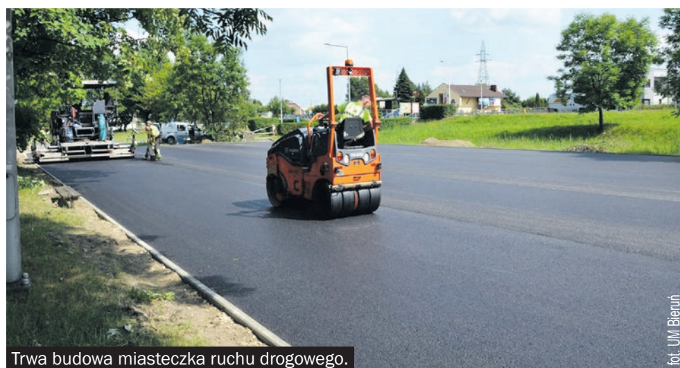
Trwa budowa miasteczka ruchu drogowego.