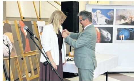
Święto ludzi z pasją. str. 12-13