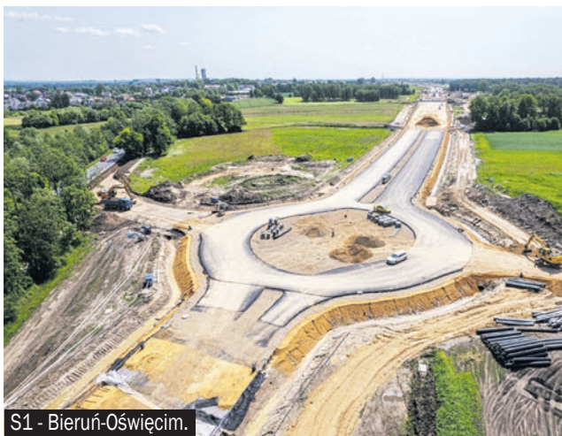
S1 - Bieruń-Oświęcim.