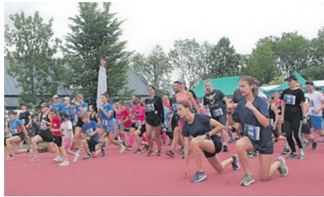
Fajrowali i biegali. str. 8-9