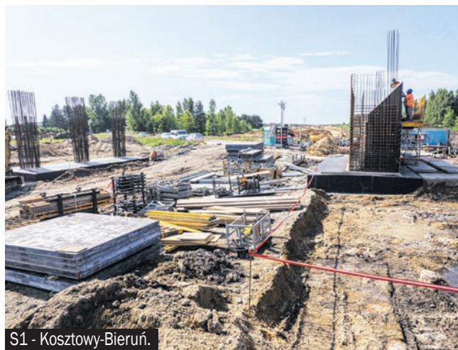
S1 - Kosztowy-Bieruń.