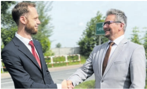
Frekwencyjny zakład. str. 2