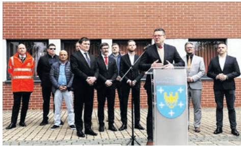
Wiceministrowie w Bieruniu. str. 4