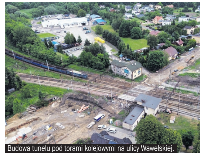
Budowa tunelu pod torami kolejowymi na ulicy Wawelskiej.