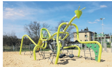
Modliszka w Bieruniu Starym.