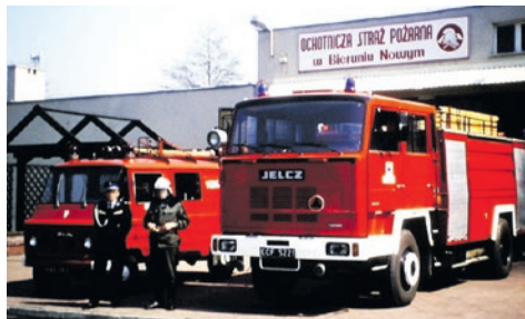
Pierwsi na ratunek.