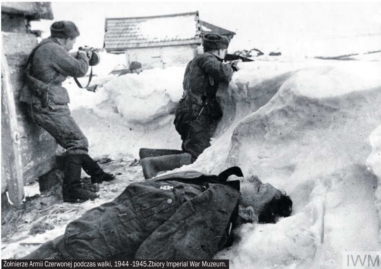
Żołnierze Armii Czerwonej podczas walki, 1944 - 1945.

Po 12 lutego rozpoczęła się więc zakrojona na szeroką skalę akcja. W poszczególnych miejscowościach pojawiły się afisze wzywające mężczyzn do stawienia się do pracy wraz z niewielkim bagażem. Górnoślązacy nie spodziewali się dalekich wywozków. Większość z nich myślała, że będą kierowani do pracy przy naprawie zniszczeń frontowych w nieodległych miejscowościach. Dlatego spora część zgłosiła się dobrowolnie, głównie z obawy przed konsekwencjami. Ci którzy stawić się nie chcieli, byli wyłapywani przez radzieckich funkcjonariuszy, którzy nie wahałi się nawet wkraczać do zakładów pracy i zabierać wszystkich pracowników. Wkraczano także do wszystkich miejsc, gdzie można było się ukryć. Kryterium wyboru było jedno - warunki fizyczne do pracy. Aresztowano więc zarówno polskich działaczy oraz członków antyniemieckiego podziemia, jak i członków NSDAP czy współpracowników Gestapo. Ludzie ci mogli zabrać ze sobą,