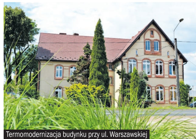
Termomodernizacja budynku przy ul. Warszawskiej