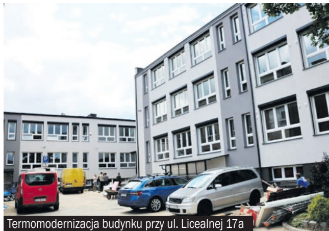
Termomodernizacja budynku przy ul. Licealnej 17a

Poza inwestycjami infrastrukturalnymi, w latach 2005-2024 w Bieruniu zrealizowano z funduszy UE całą masę projektów społecznych, których celem było wsparcie kapitału ludzkiego (m.in.: eliminacja wykluczenia cyfrowego, a także projekty w placówkach oświatowych).