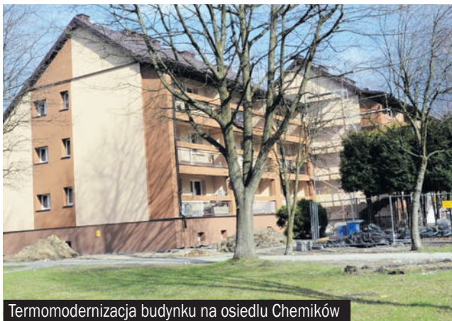
Termomodernizacja budynku na osiedlu Chemików