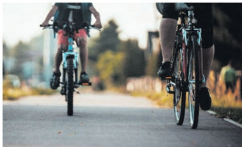
Na rowerze do Tychów.