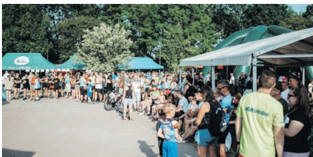
Tak bawiliśmy się w ubiegłym roku.