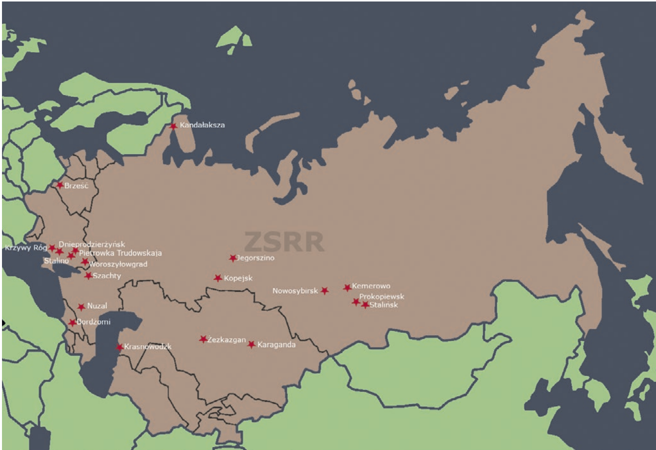
Główne miejsca deportacji mieszkańców miejscowości tworzących dziś powiat bieruńsko-lędzki. Oprac. Piotr Knapczyk.