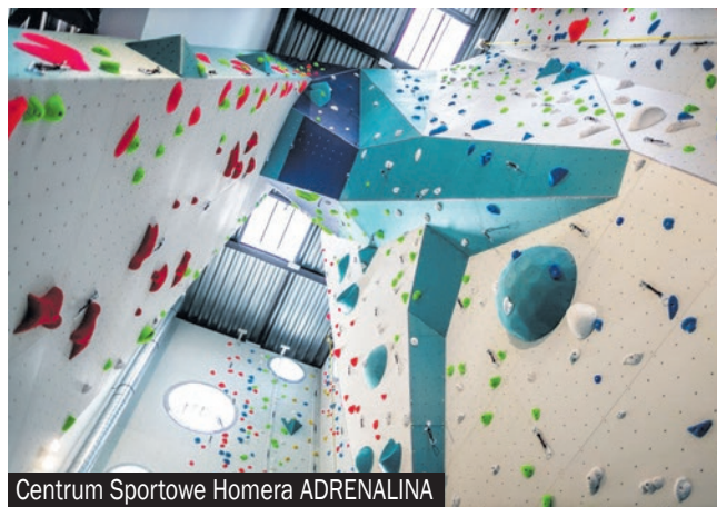
Centrum Sportowe Homera ADRENALINA