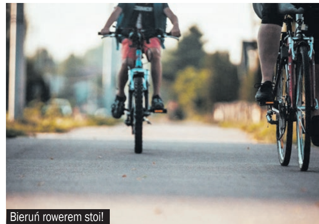
Bieruń rowerem stoil!