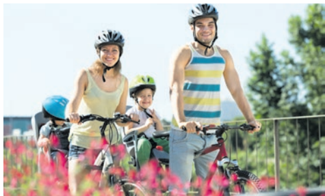
Na rowerze z Bierunia do Tychów. str. 4