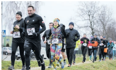
Dekada z Biegiem Utopca... str. 8-9