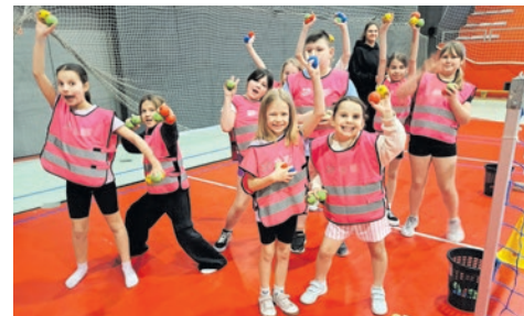
I po feriach... str. 14-15