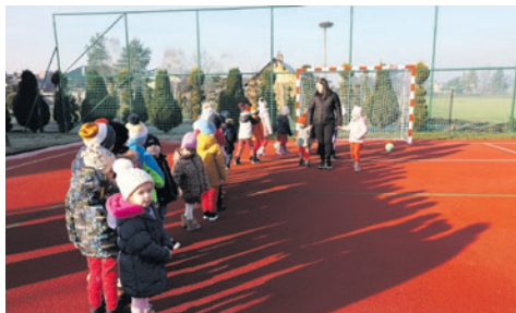
Boisko w Czarnuchowicach otwarte! str. 5