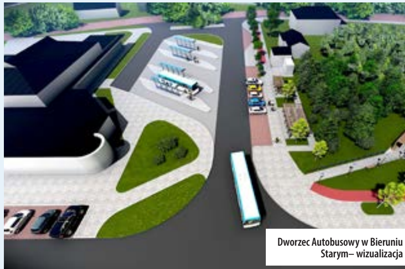
Dworzec Autobusowy w Bieruniu Starym – wizualizacja

Przypomnijmy, że Miasto Bieruń otrzymało dofinansowanie w wysokości 2 629 171,63 zł na realizację projektu pn. „Kompleksowa strategia niskoemisyjna przeciwdziałająca zmianom klimatu na terenie gminy Bieruń obejmująca budowę dwóch zintegrowanych centrów przesiadkowych w dzielnicy Bieruń Nowy i Bieruń Stary - etap II” w ramach Regionalnego Programu Operacyjnego Województwa Śląskiego na lata 2014-2020. To właśnie za sprawą pozyskanych środków dworzec autobusowy w Bieruniu Starym zyska miano nowoczesnego Centrum Przesiadkowego, doskonale przystosowanego do potrzeb rowerzystów, a to wszystko dzięki nowym inwestycjom dotyczącym infrastruktury rowerowej. Łączna wartość zamówienia wyniesie 3 093 143,09 zł.