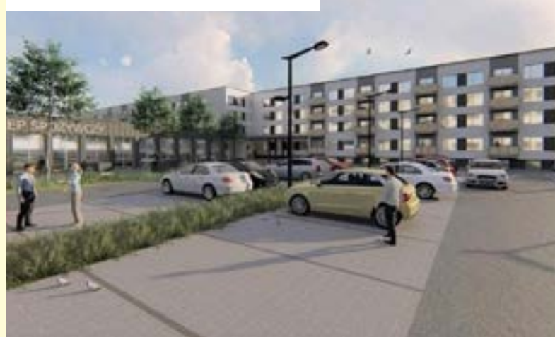
Wizualizacja bloku mieszkalnego na osiedlu Homera

TENGLONG POLSKA S.A. postawi tam nowoczesną halę produkcyjno-magazynową z branży automotive. Prace budowlano-montażowe mają potrwać pół roku. Inwestycja jest warta 100 milionów złotych. Nowopowstała firma zapewni ponad 600 miejsc pracy.