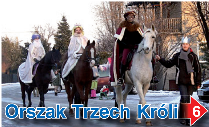
Orszak Trzech Króli 6

Konieczność przeprowadzenia wyborów wynika z prawa wyborczego a decyzje o terminach zapadały poza Bieruniem na szczeblu władz centralnych i wojewódzkich.