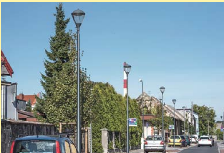
Nowe lampy pojawiły się już m.in. przy ul. Kudery.

Nowoczesne oświetlenie zapewni oszczędności w wydatkach gminy na energię elektryczną.