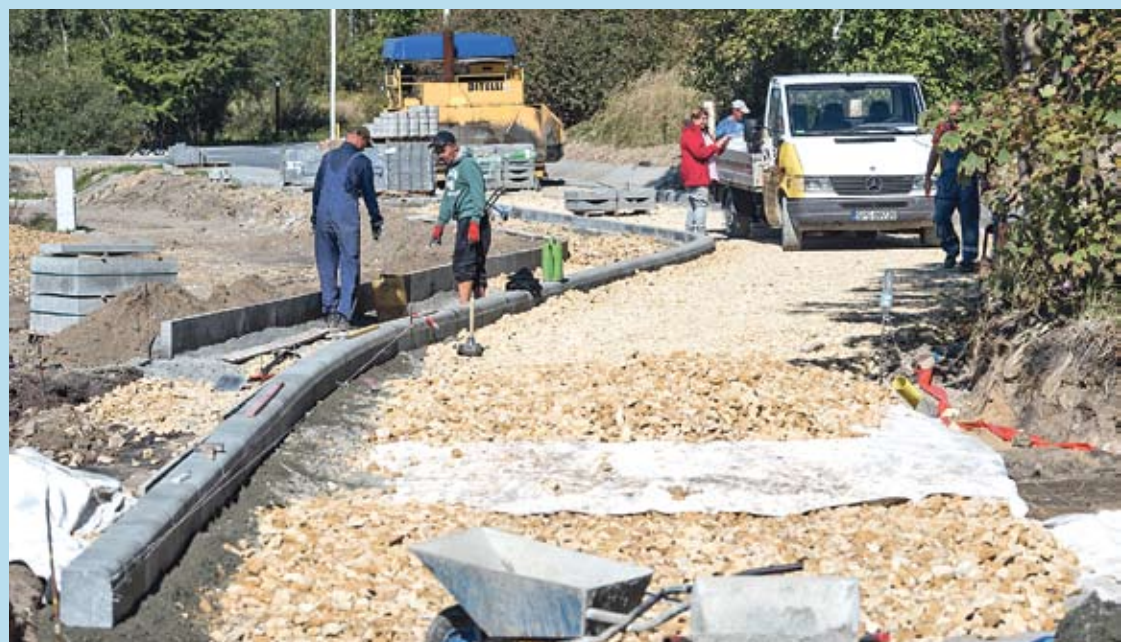
Na kolejnym odcinku dawnej ul. Wylotowej układana jest nawierzchnia.

Ścieżka przebiegnie pod wiaduktem z DK 44 i połączy się ze ścieżką rowerową biegnącą wzdłuż ulicy Lędzińskiej. Wartość zadania to 518 374,15 zł. Miasto Bieruń na jego realizację pozyskało dofinansowania z Funduszu Solidarności Górnośląsko-Zagłębiowskiej Metropolii i Europejskiego Funduszu Rolnego na Rzecz Rozwoju Obszarów Wiejskich.