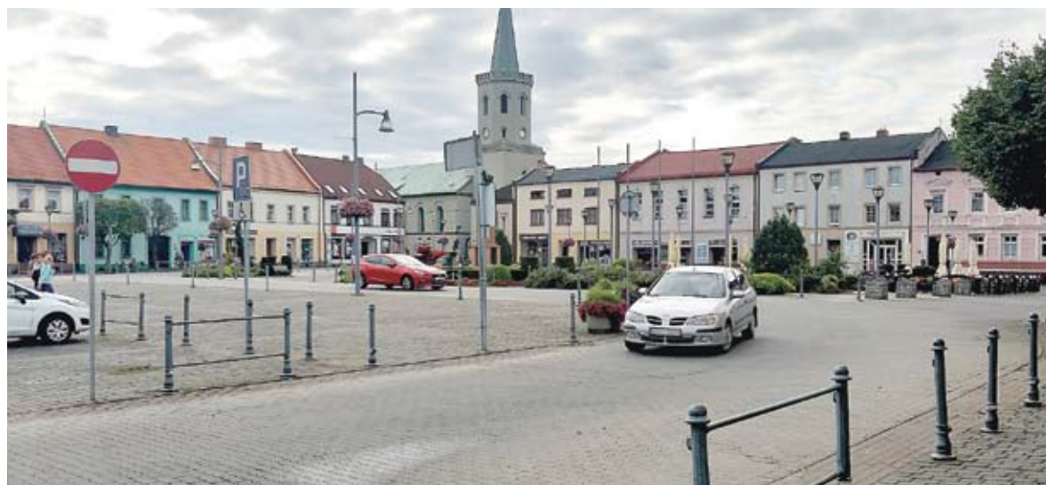
Wzmożony ruch samochodów na starówce to dyskomfort dla mieszkańców i degradacja 100-letnich budynków.

W Bieruniu nie ma dróg, które mogłyby przejąć ruch kumulujący się w centrum miasta. W projekcie Miejscowego Planu Zagospodarowania Przestrzennego uwzględniona jest rozbudowa układu komunikacyjnego terenu położonego w rejonie obszaru staromiejskiego i grobli tj. połączenie ulicy Oświęcimskiej z ulicą Wylotową oraz połączenie ul. Wylotowej z ul. Chemików, jednak realizacja tych inwestycji to sprawa przyszłości.