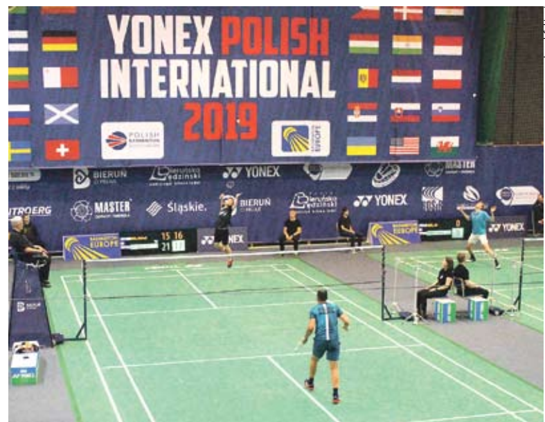
W zawodach YONEX Polish International 2019 wystartowało 200 zawodniczek i zawodników z 29 krajów.