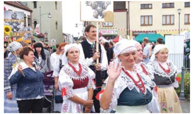
Relacja z Dni Bierunia / str. 10-11