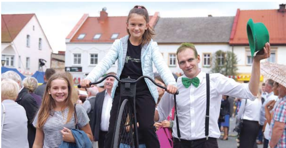
3. Najmłodzi chętnie korzystali z okazji, by przejechać się na bicyklu.

Wszyscy, którzy przyszli tego dnia na Rynek, mogli też podziwiać wspaniałe korony dożynkowe, wykonane przez mieszkańców z dzielnic Bijasowice, Czarnuchowice, Ściernie i z części starobieruńskiej. Sylwia Witman