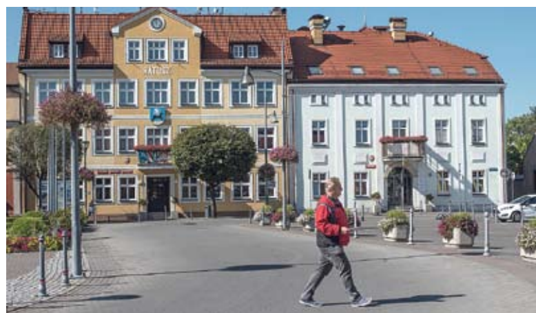
Rynek tylko dla pieszych? Takie rozwiązanie być może zostanie wprowadzone podczas imprez plenerynych.