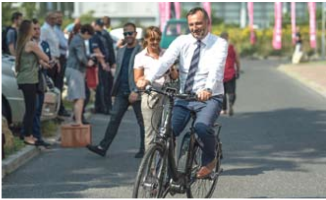
Na elektrycznych rowerach / str. 5