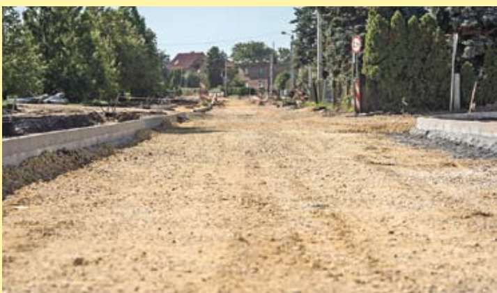
Na ul. Marcina są już ułożone elementy nowej drogi, obrzeża i krawężniki.

Przypomnijmy; to duże zadanie inwestycyjne za kwotę ponad 6 mln zł (na połowę tej kwoty miasto pozyskało dofinansowanie z Funduszu Dróg Samorządowych) obejmuje przebudowę ulic Łysinowej i Marcina, budowę chodnika i ścieżki rowerowej, a także budowę miejsc postojowych i zatok dla busów oraz przebudowę kanalizacji deszczowej, budowę sieci oświetleniowej i teletechnicznej.