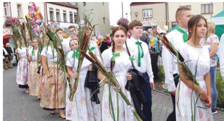
Młodzież bardzo pięknie połączyła motywy ludowe i „utopcowe”. Na zdjęciu reprezentacja bieruńskiego liceum.

Zaraz za młodzieżą maszerowały grupy teatralne, kluby sportowe oraz działające w Bieruniu związki, organizacje i stowarzyszenia, których bogactwo było tego dnia szczególnie widoczne. Niewielkie miasto jakim jest Bieruń z pewnością może być dumne z aktywności swoich mieszkańców.