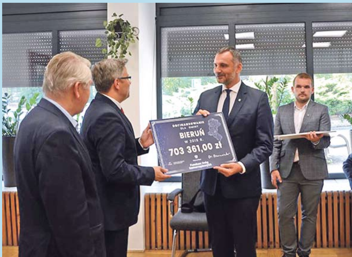
Dofinansowanie w ramach Funduszu Dróg Samorządowych przekazał burmistrzowi Bierunia Wojewoda Śląski.

Ustawą z 23 października 2018 r. o Funduszu Dróg Samorządowych (Dz. U. poz. 2161, z późn. zm.) powołany został nowy mechanizm wsparcia dla jednostek samorządu terytorialnego, realizujących inwestycje na drogach samorządowych. Gmina Bieruń regularnie aplikuje o środki pochodzące z tego źródła. Obecnie w naszym mieście, przy udziale dofinansowania z FDS realizowane jest zadanie pn.: „Przebudowa ul. Łysinowej i ul. Marcina”.