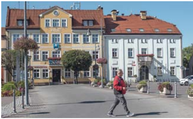
Starówka pod nadzorem / str. 7