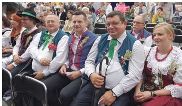
Bieruńscy radni prezentowali się podczas dożynek odświętnie, w tradycyjnych strojach.