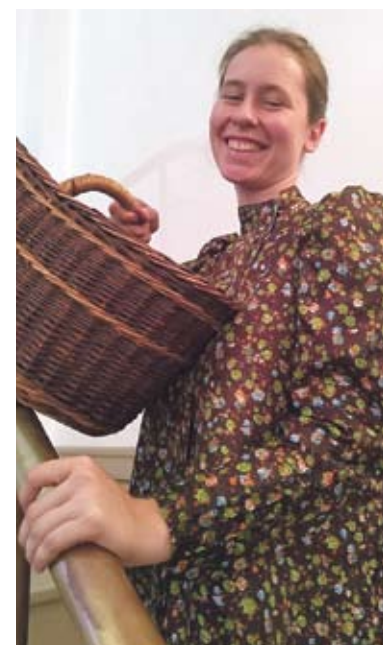
mat. prasowe Muzeum Miejskiego w Bieruniu

Jeżeli posiadacie Państwo w swoich domach zdjęcia prezentujące kobiety „w kieckach” bądź zilowe czy płócienne jakle, pisiate lub adamaszkowe fartuchy, chusty sztafki czy plyjty , bardzo prosimy o kontakt: Muzeum Miejskie w Bieruniu (w organizacji) ul. Rynek 14, pokój 22 (budynek Urzędu Miejskiego w Bieruniu) Tel. 32 708 09 89, e-mail: muzeum@muzeum.bierun.pl