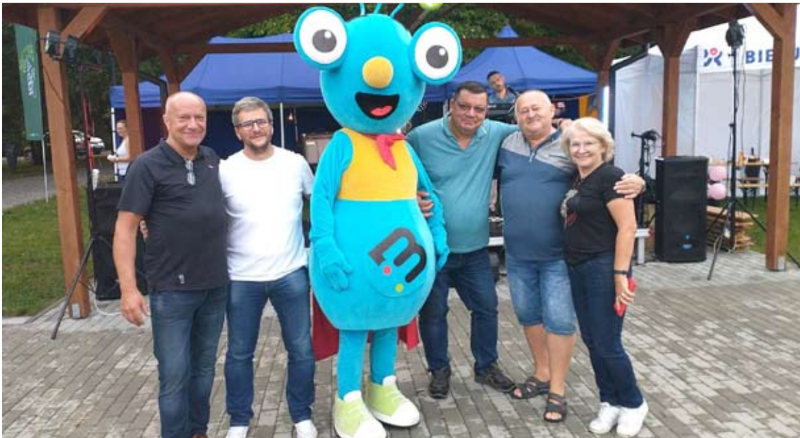
Mimo kapryśnej pogody, nastroje organizatorom, gościom i uczestnikom festynu w Mini Arboretum dopisywały.

W sierpniu odbyły się dwa wakacyjne festyny dla mieszkańców, organizowane przez bieruńskich radnych we współpracy z miejskimi instytucjami sportowymi i kulturalnymi. Obie imprezy zakłóciła niesprzyjająca pogoda, która jednak nie popsowała dobrej zabawy.