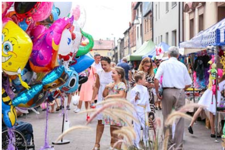
Tradycyjnie uroczystościom odpustowym towarzyszyły stragany ze... wszystkim.