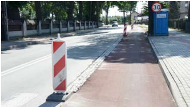
Z burmistrzem nie tylko o Krakowskiej / str. 3