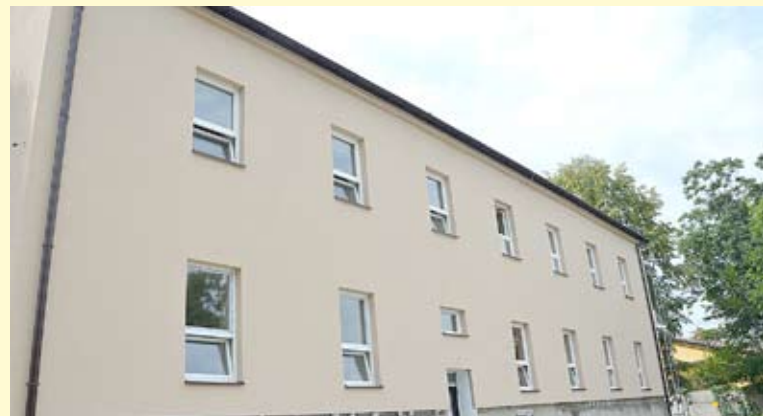
Z jednej strony budynek przy Wawelskiej 31 zyskał już nową elewację...

Zadanie pn.: „Modernizacja energetyczna budynków użyteczności publicznej w Gminie Bieruń” dofinansowane jest ze środków Unii Europejskiej w ramach Regionalnego Programu Operacyjnego Województwa Śląskiego na lata 2014-2020. UMB