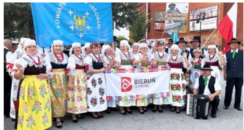
Na każdym kroku „Ściernianeczki” promowały Bieruń, powiat bieruńsko-łędziński i Śląsk.