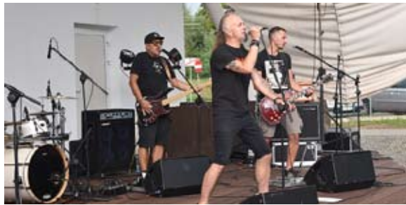
Podczas „Pożegnania lata” w Remizie dzieci korzystały z dmuchańców, a starsi bawili się przy muzyce zespołu Stare Dziady.