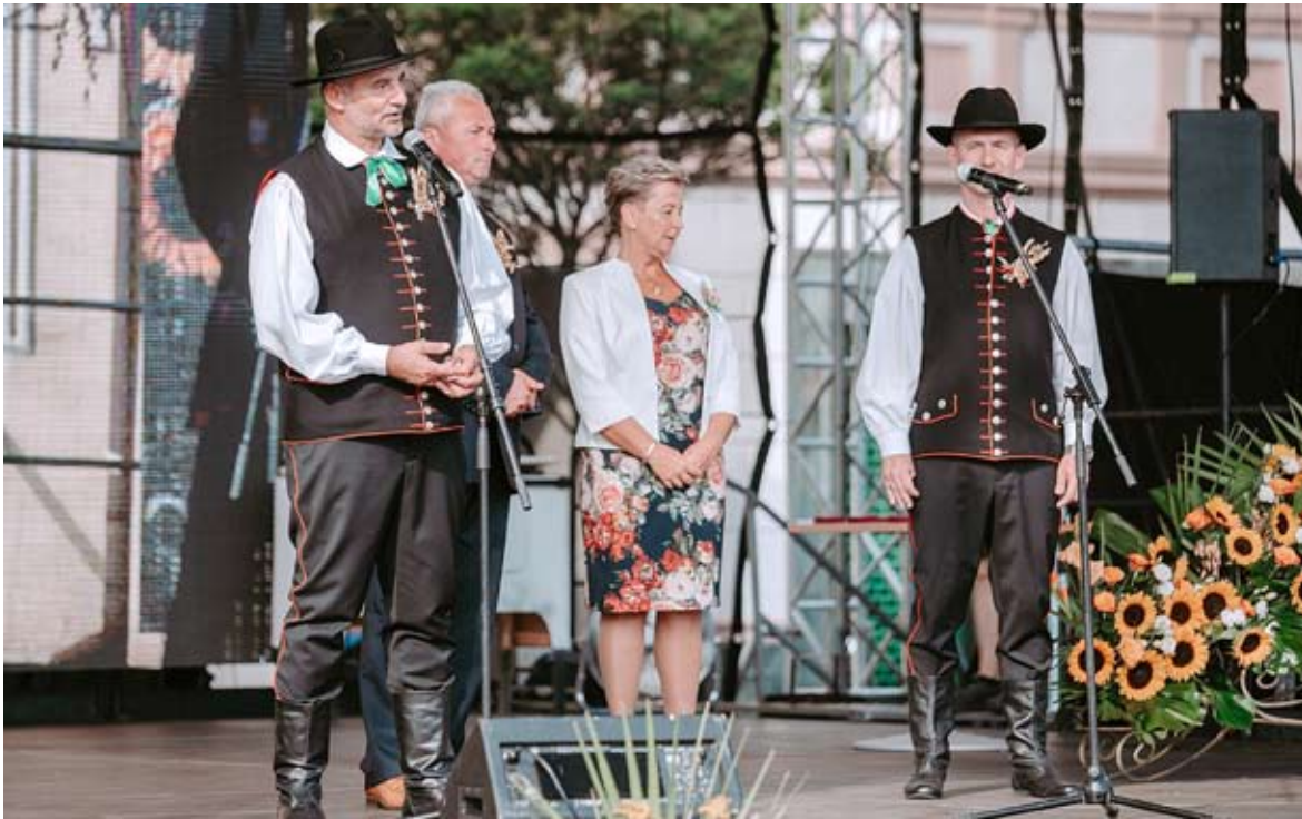
Ubiegłoroczne Dożynki odbyły się na Rynku, w tym roku festyn zorganizowany zostanie w Jajostach.

PODZIĘKUJEMY ROLNIKOM ZA ICH PRACĘ I WSPÓLNIE BĘDIEMY SIĘ BAWIĆ.