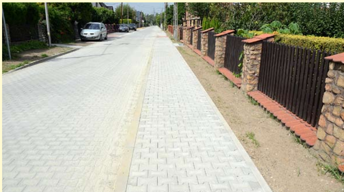
Ulica Mieszka I zyskała nowe, miłe dla oka oblicze.

Całkowita wartość zadania to 1.050.817,52 zł . Tak więc dofinansowanie obejmuje 50% kosztów tej inwestycji. Termin wykonania to 31 października 2022 r. Wykonawcą robót jest firma Usługi Transportowe Opitek Henryk z Chelmu Śląskiego UMB