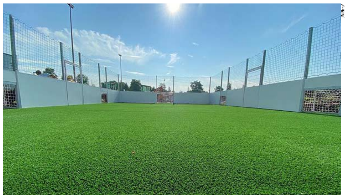
Jeszcze tylko prace wykończeniowe wokół i na Mini Orliku będzie można grać i trenować.

To już kolejna inwestycja w ramach BO, zrealizowana na obiekcie sportowym KS Unia Bieruń Stary przy ul. Chemików. Poprzednimi były m.in. budowa „Orlika” – oświetlonego boiska o nawierzchni z trawy syntetycznej, wykonanie systemu nawadniania murawy boiska głównego i budowa bocznego boiska treningowego. MN