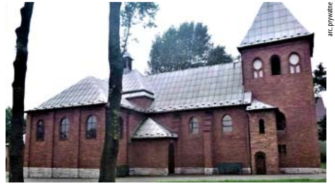
Spleciony z polską historią / str. 8-9