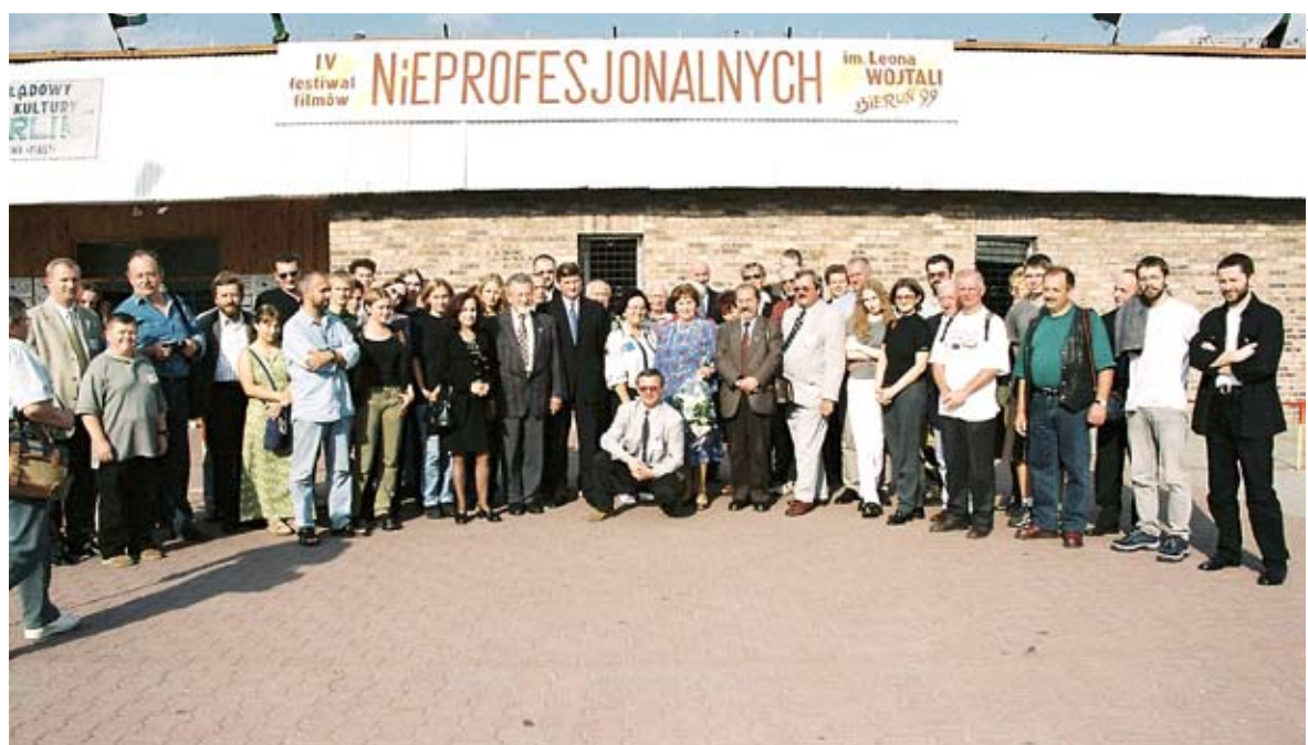
Początki bieruńskiej imprezy sięgają ostatniej dekady ubiegłego wieku.