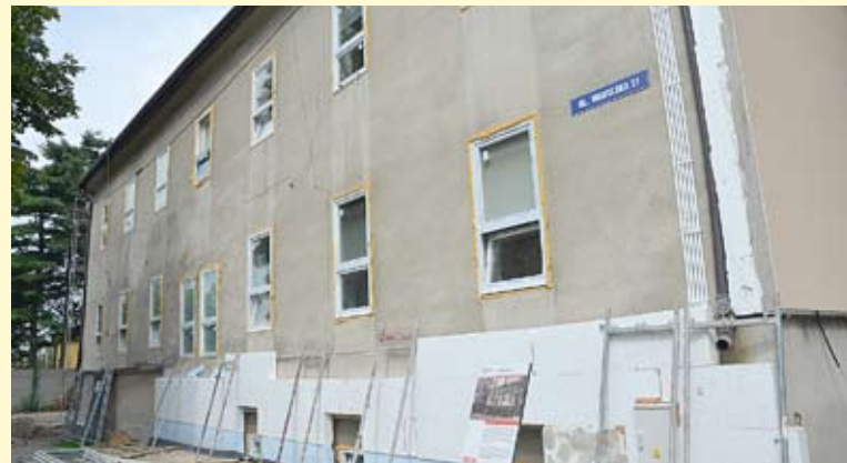
... z drugiej strony prace jeszcze trwają.