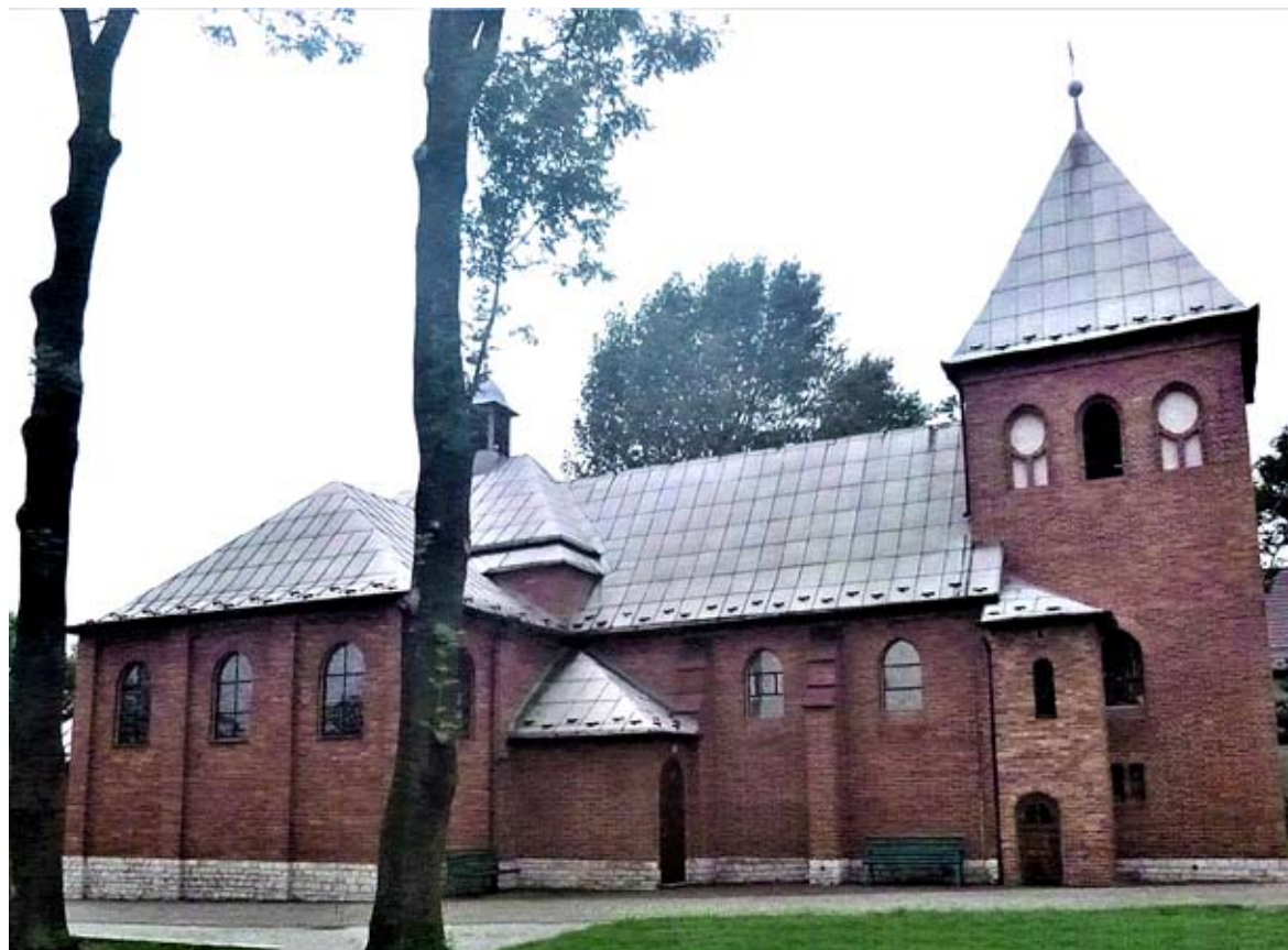
Obecny widok kościoła NSPJ.

Lata 1971–1976 to okres, kiedy w wystrój kościoła NSPJ w Bieruniu Nowym przeprowadzono daleko idące zmiany. Przystąpiono do realizacji zaleceń Soboru Watykańskiego II dotyczących zmian w liturgii i w związku z tym wyposażenia prezbiterium i samego ołtarza. Nowa aranżacja