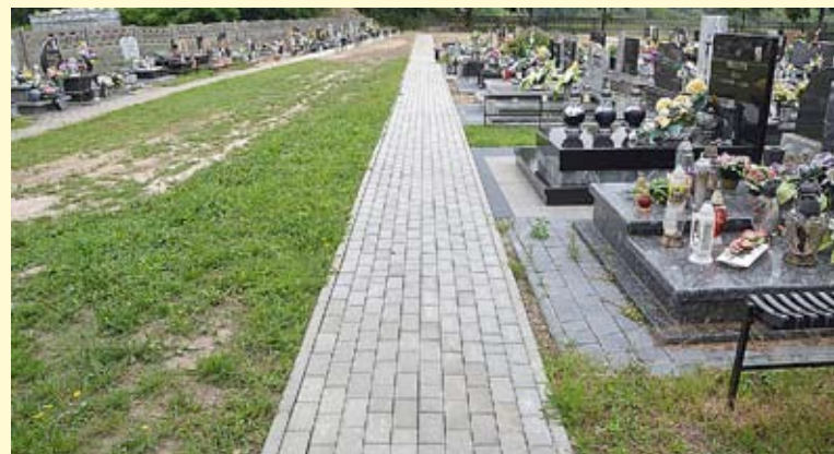
Na cmentarzu przy ul. Soleckiej oddano do użytku sto metrów nowych, estetycznych ścieżek z kostki betonowej.

Wartość zrealizowanych prac to 40 tys. złotych . Wykonawcą zadania była firma KOP-MAT Mateusz Momot z siedzibą w Bieruniu. UMB