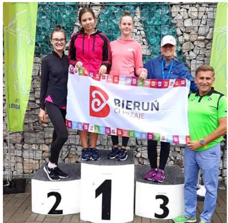
Bieruńskie chodziarki z 4-krotnym złotym medalistą igrzysk olimpijskich Robertem Korzeniowskim.