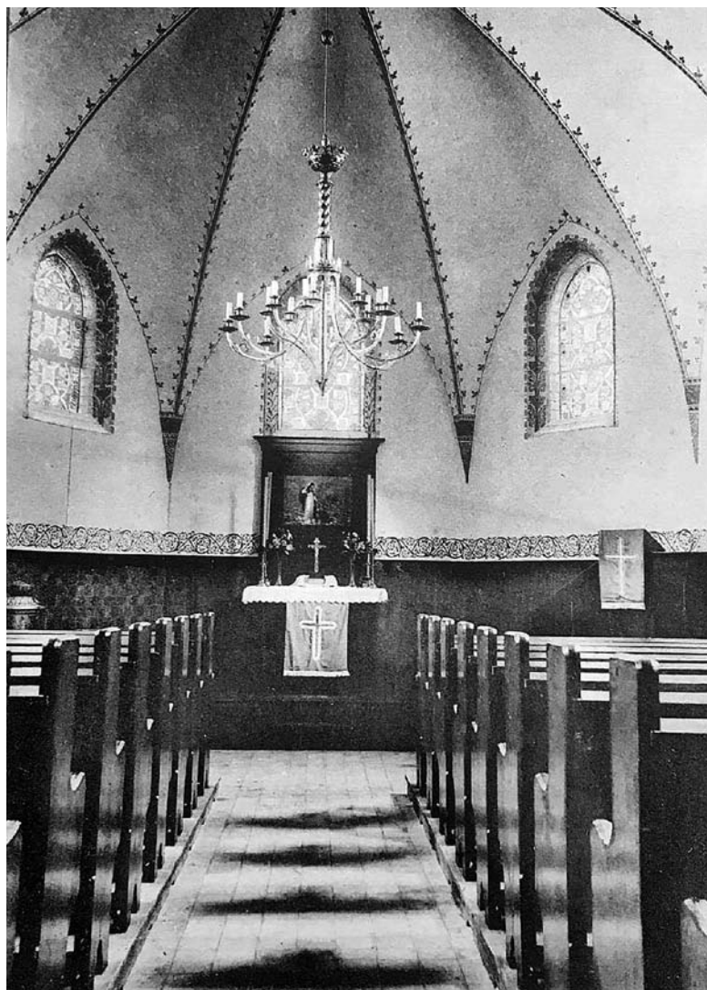
Wnętrze kaplicy ewangelickiej w 1910 roku.

Wraz z budynkiem kaplicy na własność kupujących przeszedł skromny inwentarz, dwa stalowe dzwony, sygnaturka i organy. Świątynia jednak nie posiadała ołtarza, a wszystkie sprzęty i naczynia liturgiczne, jakie znajdują się w kościołach katolickich, trzeba było sprowadzić do nowo nabytego kościoła, nim został poświęcony.