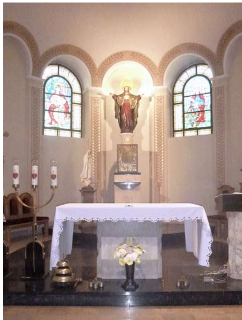
Współczesne wnętrze nowobieruńskiej świątyni.