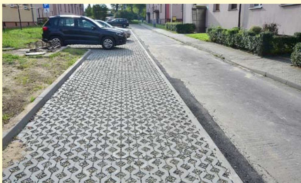
Mieszkańcy korzystają już z 15 wyremontowanych i 7 nowych miejsc postojowych.