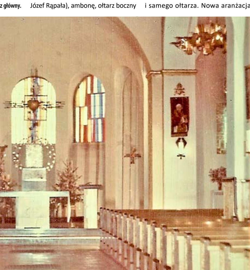
Wystrój z elementami metaloplastyki – okres powojenny.