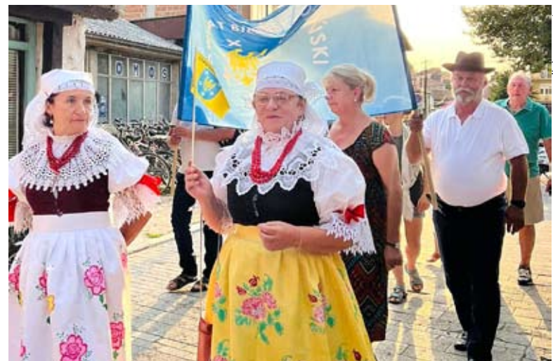
Na rozpoczęcie festiwalu zespoły wzięły udział w wielobarwnej paradzie ulicami miasta Ohryda.

W drodze powrotnej zespół zwiedził stolicę Macedonii – Skopje. Niezapomniane wrażenia na uczestnikach wyjazdu zrobiła przyroda Bałkanów jak również żyjący tu, przyjaźnie nastawieni do Polaków ludzie. MN