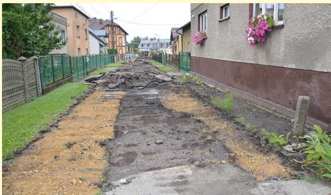
Dzięki uzyskanym dotacjom przebudowany zostanie 160-metrowy odcinek ul. Piastowskiej.