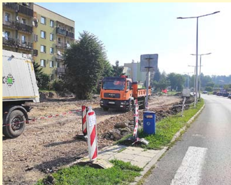
Do końca października parking przy ul. Węglowej będzie jak nowy.