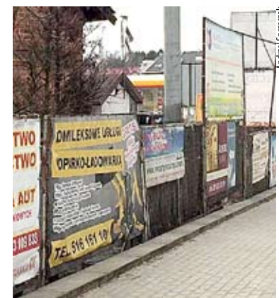
Uchwała ma uregulować m.in. zasady umieszczania reklam na terenie miasta (zdjęcie poglądowe).

43-150 Bieruń, w formie papierowej lub elektronicznej, w tym za pomocą środków komunikacji elektronicznej, w szczególności poczty elektronicznej, na adres urząd@um.bierun.pl , z podaniem imienia i nazwiska albo nazwy, adresu zamieszkania albo siedziby oraz oznaczenia nieruchomości, której uwaga dotyczy. Nieprzekraczalny termin składania uwag upływa 26 września 2022 r. UM