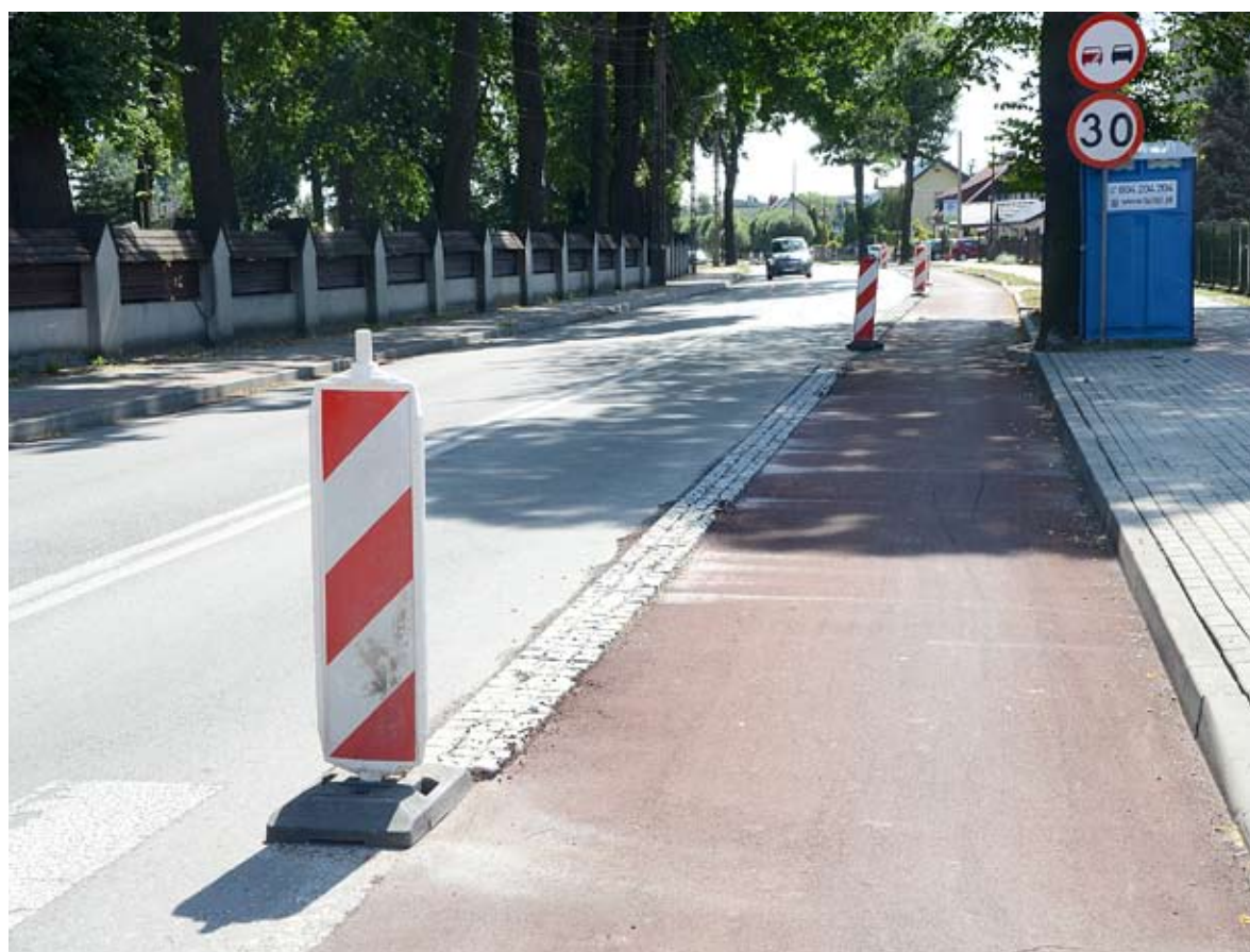
Projektowane przy ul. Krakowskiej rozwiązania zostaną zmienione po głosach płynących od mieszkańców.