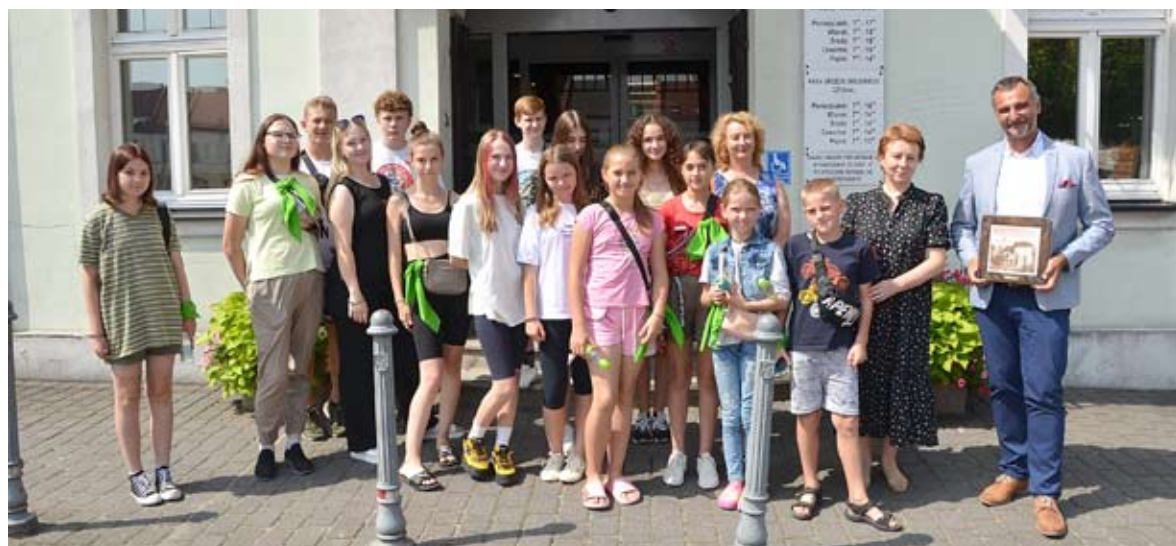
... oraz podczas wzruszającego pożegnania z burmistrzem przed Urzędem Miejskim.