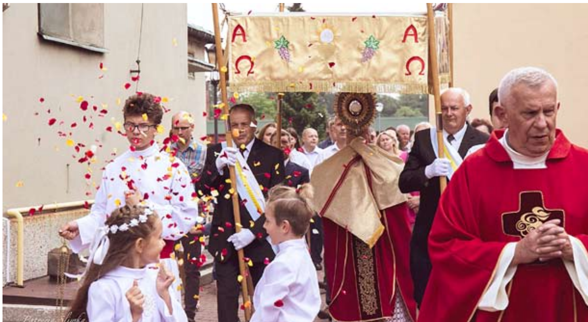
Procesja eucharystyczna wokół kościoła pw. Św. Bartłomieja Apostoła.

W NIEDZIELĘ, 28 SIERPNIĄ ODBYŁ SIĘ ODPUST PARAFIALNY W PARAFII ŚW. BARTŁOMIEJA APOSTOŁA.