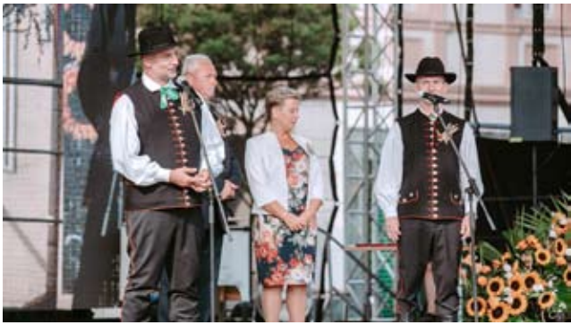
Święto Plonów w Jajostach / str. 2