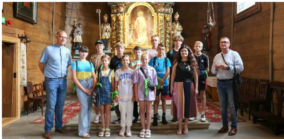
Goście z Ukrainy w czasie zwiedzania „Walencinka”...

Na koniec każdego turnusu była oczywiście wymiana upominków – każde dziecko otrzymało maskotkę w koszulce z logo Bierunia. One z kolei podarowały burmistrzowi wykonane przez siebie prace plastyczne, w tym kolekcję portretów bierońskich utopców. SW