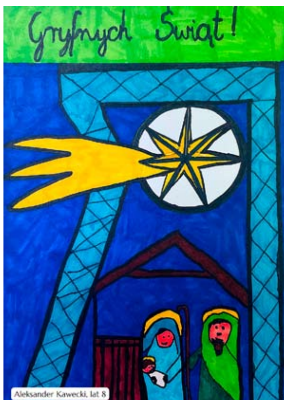
Aleksander Kawecki, lat 8