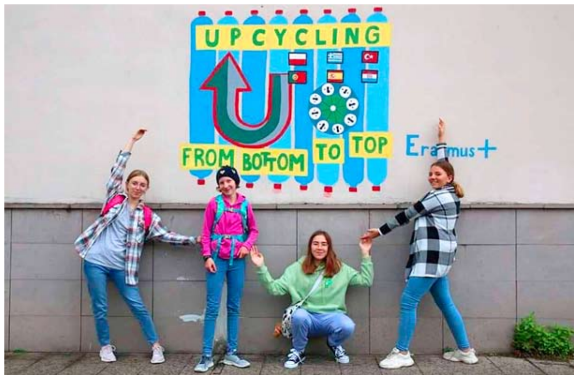
Bieruńska młodzież poznawała w Turcji zasady recyklingu.