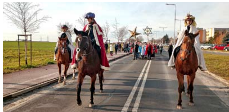
Orszak Trzech Króli prowadziły amazonki z Klubu Jeździeckiego Solec, a uczestniczyli w nim m.in. radni, duchowni oraz młodzi i starsi mieszkańcy Bierunia.

Od kościoła św. Barbary do kościoła Najświętszego Serca Pana Jezusa – taką trasę pokonali mieszkańcy, którzy 6 stycznia dołączyli do Orszaku Trzech Króli organizowanego przez obydwie nowobieruńskie parafie przy współpracy z Bieruńskim Ośrodkiem Kultury.