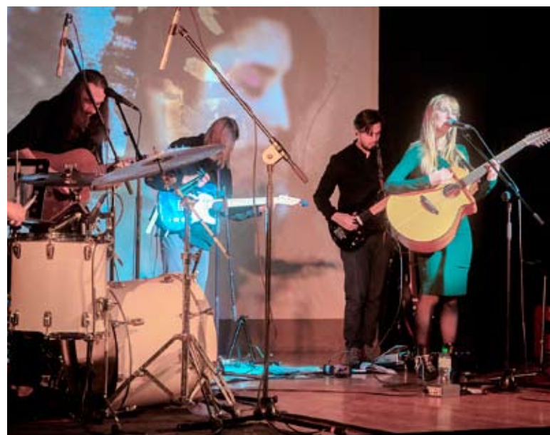
To był piękny wieczór z muzyką oświęcimskiej grupy Weroena.

Była to niezwykła, muzyczna uczta na najwyższym poziomie! MG