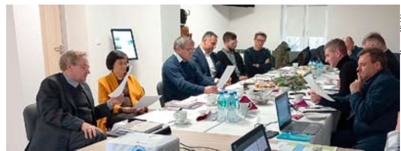
Rada bieruńskiego Muzeum Miejskiego pozytywnie oceniła działalność placówki w minionym roku.