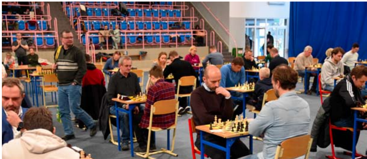
Parkiet Hali Sportowej BOSiR był podczas Memoriału wypełniony po brzegi.