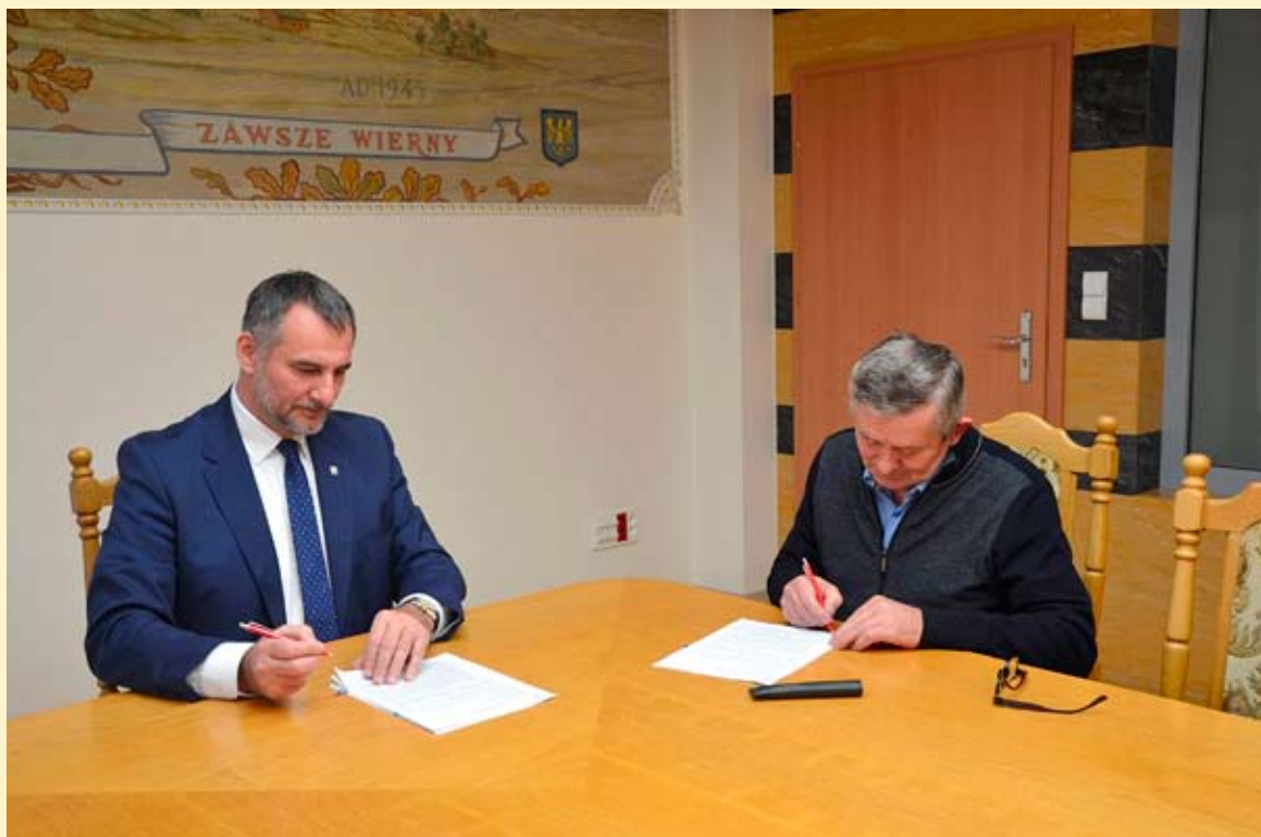
Moment podpisania umowy na realizację inwestycji wartej niemal 3 miliony złotych.