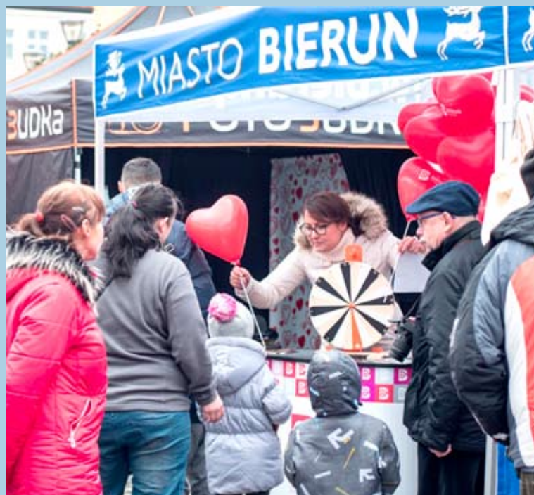
Na stoisku Miasta Bierunia podczas tegorocznego odpustu czekać będą na mieszkańców liczne niespodzianki.

Ponadto w konkursach będzie można zdobyć walentynkowe zestawy gadżetów z logo „Bieruń Ci przaje”. Aby nie przegapić konkursów warto obserwować miejskie profile w mediach społecznościowych (facebook, Instagram): Miasto Bieruń i Zakochaj się w Bieruniu. Do wygrania będą także słynne bieruńskie całuski – przysmak dostępny tylko przy specjalnych okazjach!