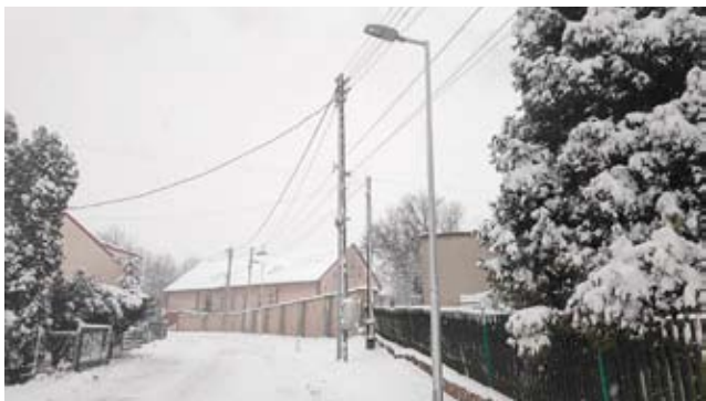
Rewolucja oświetleniowa trwa / str. 4