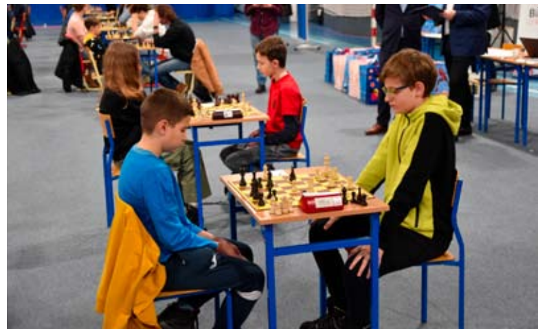
Wśród młodych szachistów rywalizacja była niezwykle zacięta.

Wzięło w niej udział aż 128 szachistów – od kilkuletnich dzieci po osoby w wieku już mocno zaawansowanym. Wszystkich połączyła miłość do 64-polowej planszy i pamięć o patronie Memoriału. Po uroczystym otwarciu turnieju, którego dokonali burmistrz Bierunia Krzysztof Grzesica , starosta bieruńsko-lędziński Bernard Bednorz