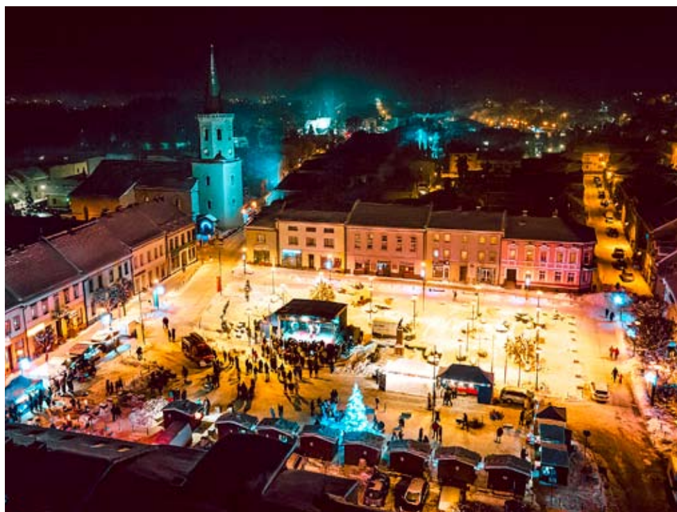
Bieruński Rynek podczas Jarmarku prezentował się imponująco, zwłaszcza wieczorem.