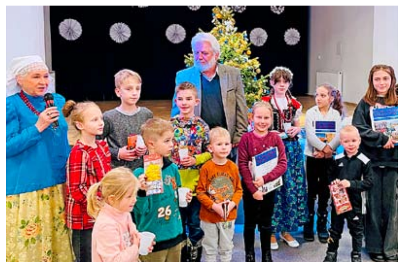
Szczególnie dla najmłodszych „Spotkanie z tradycją” było niezwykle pouczającą przygodą.