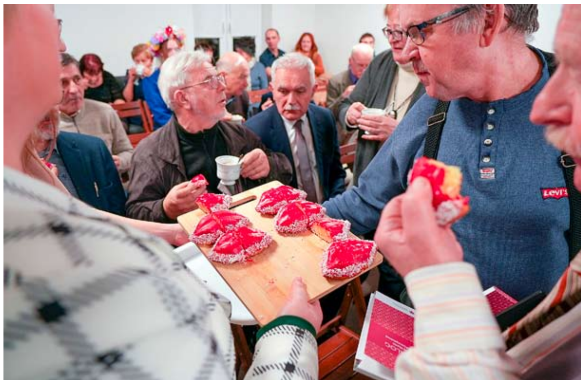
Poczęstunek bieruńskimi całuskami, które co roku w dniu św. Walentego wypieka bieruńska spółdzielnia.