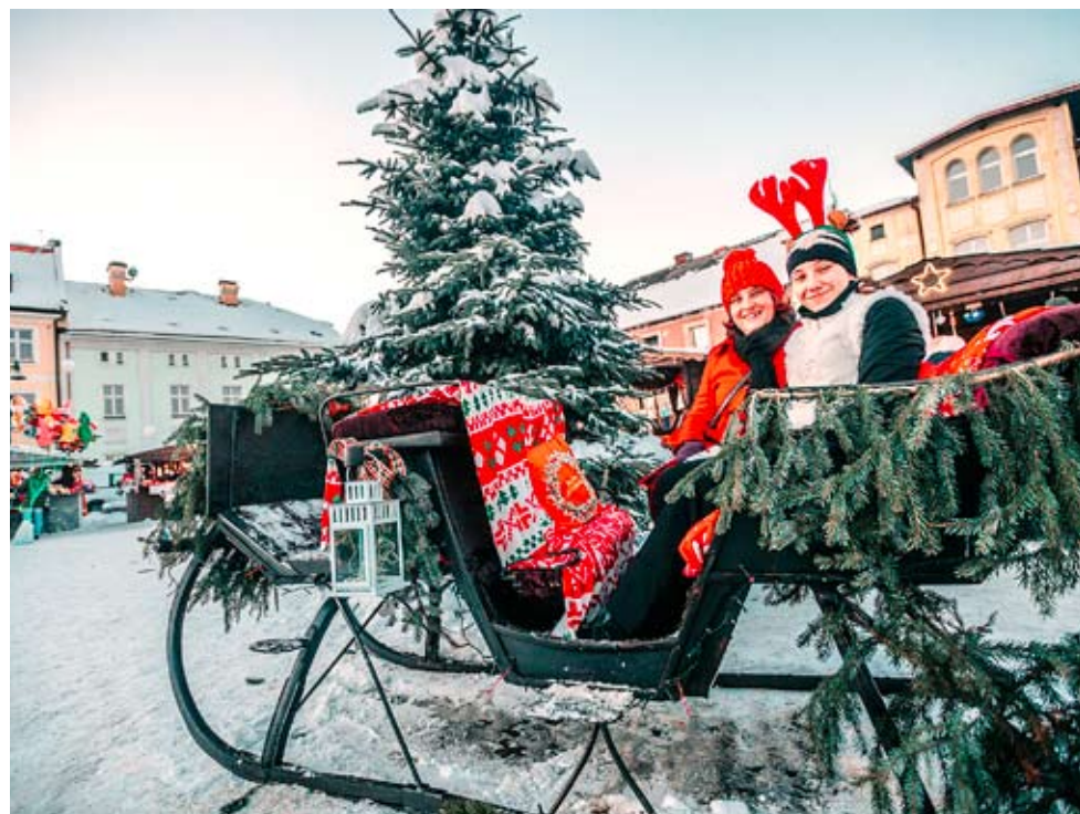
Jedną z atrakcji było pamiątkowe zdjęcie w saniach św. Mikołaja.