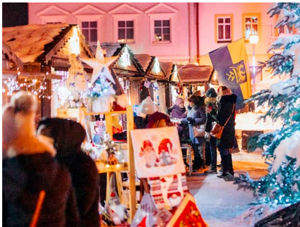
Liczne stragany zachęcały mieszkańców do przedświątecznych zakupów.