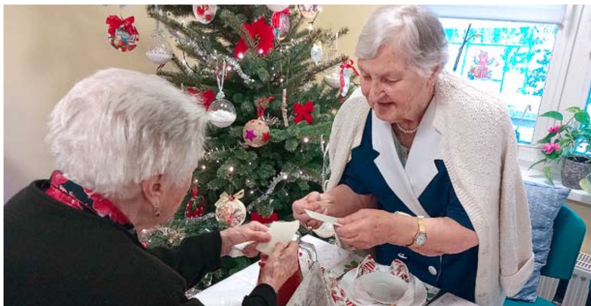
Tradycyjnym elementem każdej Wigilii jest łamanie się opłatkiem.