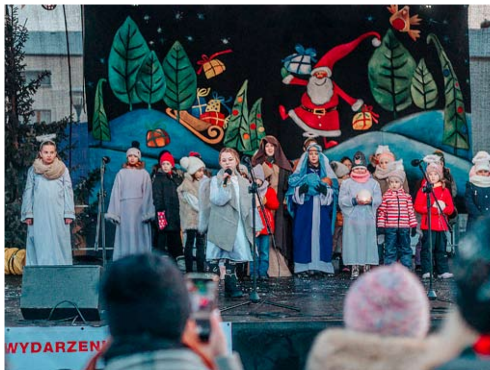
Niedzielne występy przyciągnęły pod scenę wielką widownię.