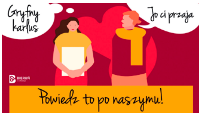
Bieruńska Walentynka / str. 3