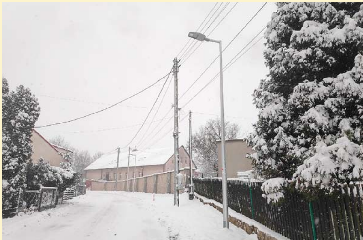
Nowe lampy sprawdzają się zwłaszcza zimą, gdy szybciej robi się ciemno.

Jak już wielokrotnie pisaliśmy, Bieruń konsekwentnie od kilku lat realizuje inwestycje związane z budową własnego, efektywnego energetycznie oświetlenia ulicznego LED, czy to jako oddzielne zadania, czy w ramach budowy lub przebudowy dróg. Nowe oświetlenie jest energooszczędne i ekologiczne, a widoczność, którą zapewnia technologia LED jest 20% lepsza niż w przypadku starych lamp sodowych. Ważna jest także długa żywotność nowych lamp oraz ich funkcjonalność z możliwością sterowania oświetleniem. RN