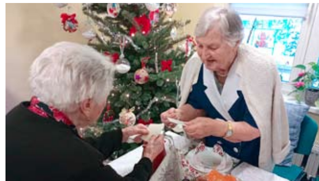
Wigilia w Domu Seniora / str. 10