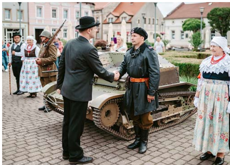
Inscenizacja przekazania czołgu TKS Wojsku Polskiemu przez pracowników „Lignozy”.