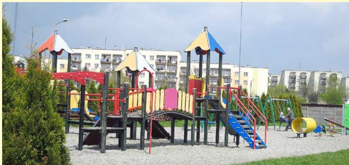
Plac zabaw przy skateparku będzie miał nową, bezpieczną dla dzieci nawierzchnię z poliuretanu.