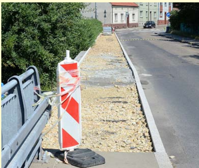
Prace na ul. Kopcowej posuwają się naprzód.

niezadowolaniem mieszkańców pobliskich domów – nawierzchnia z kostki generuje znacznie większy hałas. W tej sprawie odbyło się spotkanie w terenie z pracownikami urzędu miejskiego, a także spotkanie z burmistrzem Bierunia. Zostały już podjęte działania uwzględniające argumenty mieszkańców i zmierzające do zminimalizowania niedogodności.