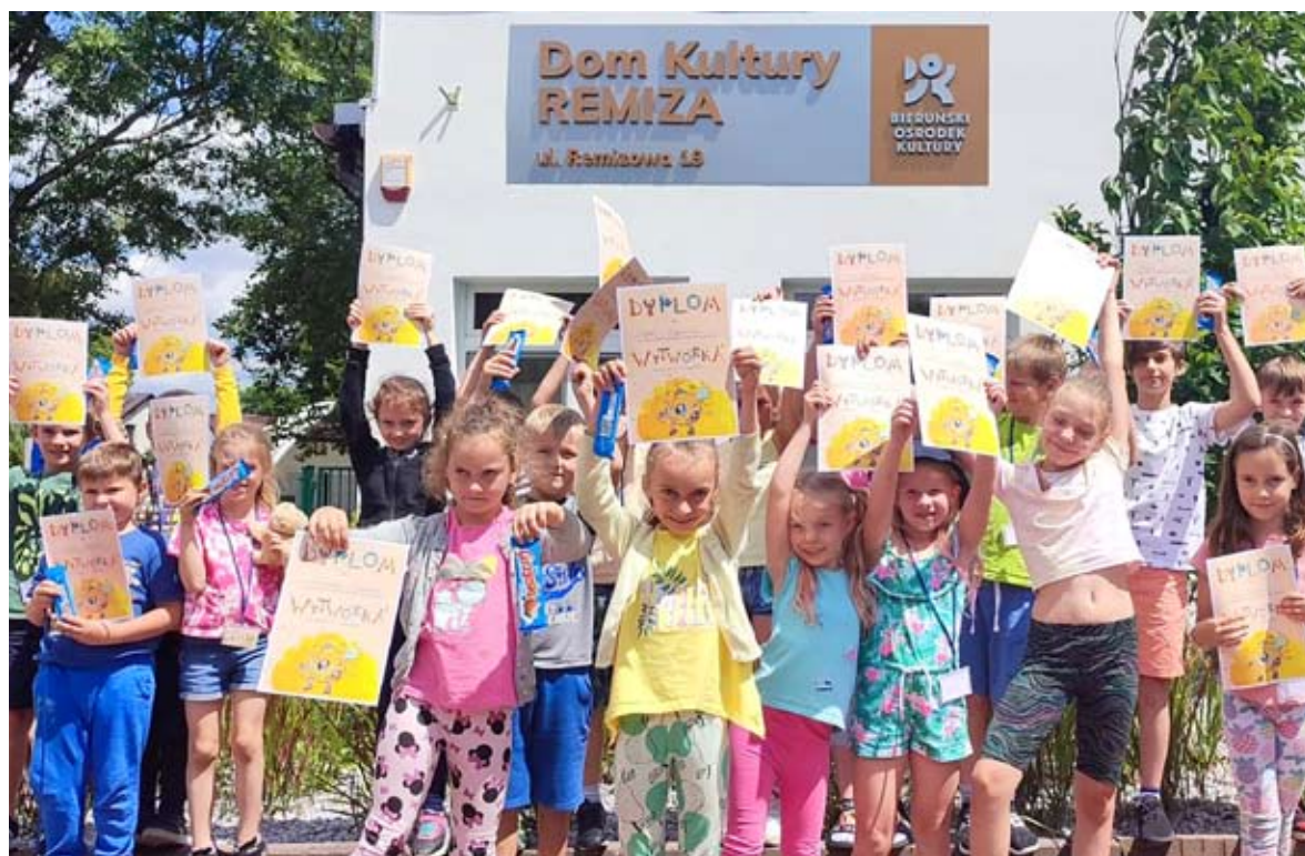
Jeden z turnusów „Wytwórki” odbył się w DK Remiza...

Nikt tak nie lubi przygód i ciekawych historii jak dzieci, na szczęście instruktorzy od zadań specjalnych przenieśli uczestników w świat piratów i korsarzy. Podczas tych zajęć wszyscy stali się jedną załogą statku i razem podbijali morza i oceany. Wielki finał wytwórkowej przygody to już klasycznie bajka na wielkim ekranie z popcornem w ręku. BOK