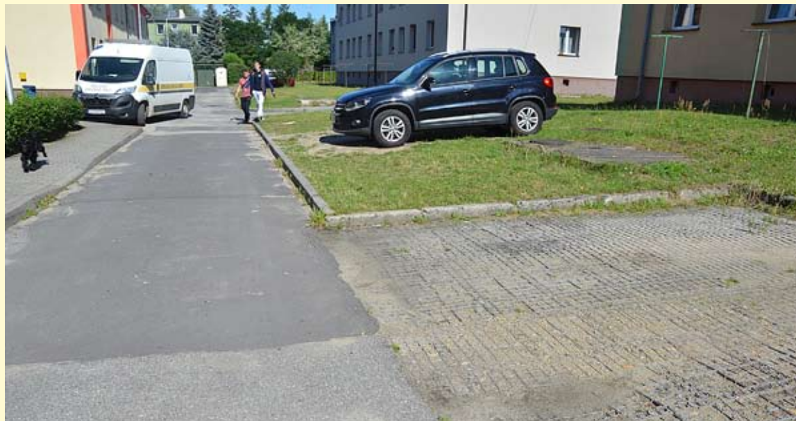
Taki widok parkingu jeszcze w sierpniu będzie tylko wspomnieniem.