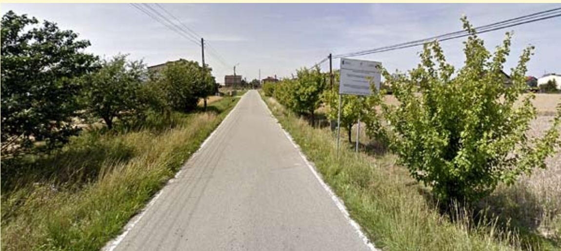
Ulica Mieleckiego w Czarnuchowicach przejdzie gruntowną przebudowę za ponad 6,5 mln złotych.