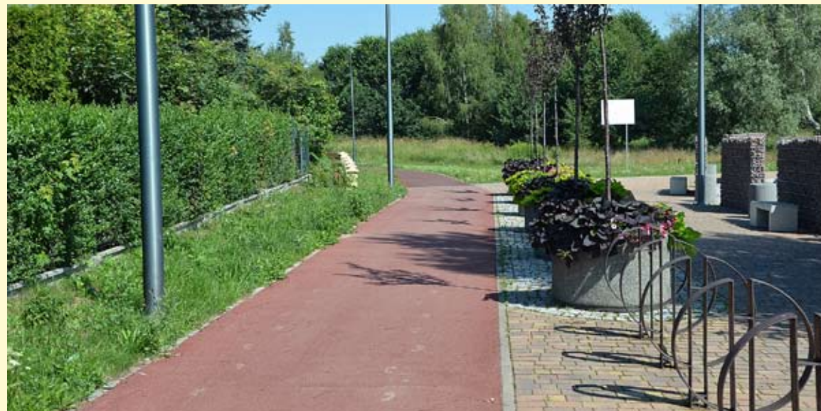
Ze ścieżki na ul. Marcina rowerzyści już chętnie korzystają – na razie testowo.

Przypomnijmy, że w latach 2019-2021 w Bieruniu Nowym został