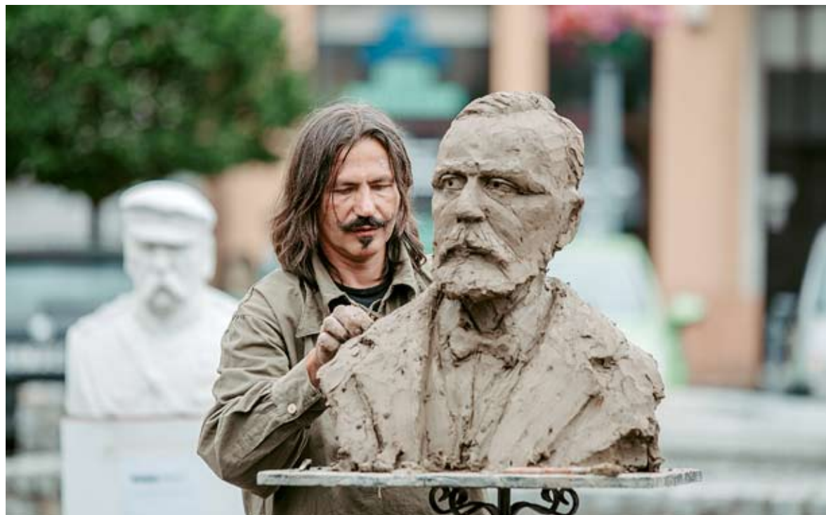
Happening artystyczny Jarosława Jasińskiego.

Jedną z największych atrakcji wydarzenia była inscenizacja oparta na historycznym wydarzeniu. Otóż na bieruńskim rynku można było cofnąć się w czasie do roku 1936, kiedy to pracownicy zakładu „Lignoz” przekazali Wojsku Polskiemu ufundowany przez siebie czołg TKS. Punktualnie o godzinie 16 samochodem Citroën C4 B przybył na miejsce Minister Spraw Wojskowych gen. Tadeusz Kasprzycki, który stanął na czele reprezentacji Wojska Polskiego. Minister powitał delegację „Lignozy”, której przewodził dyrektor generalny Leopold Szefer. Następnie obaj panowie złożyli podpisy pod uroczystym aktem przekazania.