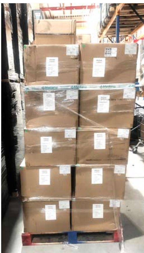
35 takich palet z darami wyjechało z Bierunia do partnerskiego Ostroga.

JEST KOLEJNA SZANSA NA DOFINANSOWANIE WYMIANY ŹRÓDEŁ CIEPŁA.