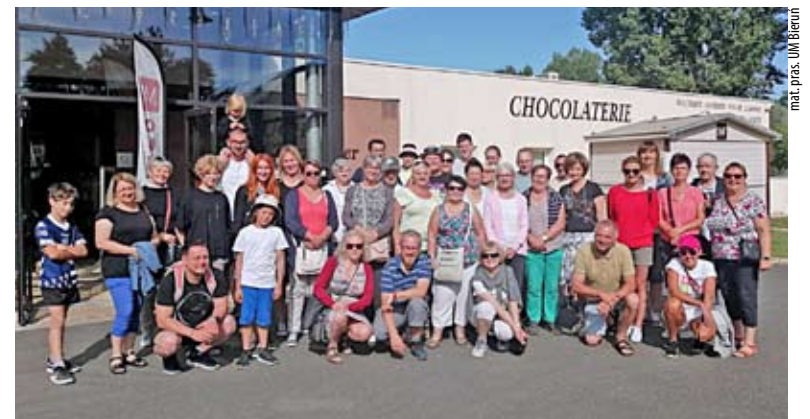
Bieruńska delegacja gościła w partnerskim Meung Sur Loire.

w Bieruniu (goście podpisali Akt Solidarności i wzięli udział w Nocy Świętojańskiej) to pierwsze, po dwuletniej przerwie spowodowanej pandemią, spotkania w ramach współpracy zagranicznej. RED