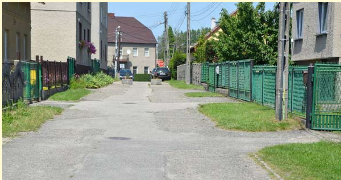
Ulica Piastowska zyska nową nawierzchnię i oświetlenie ledowe.

Przebudowie poddane będzie 158 metrów ulicy Piastowskiej. W jej ra-