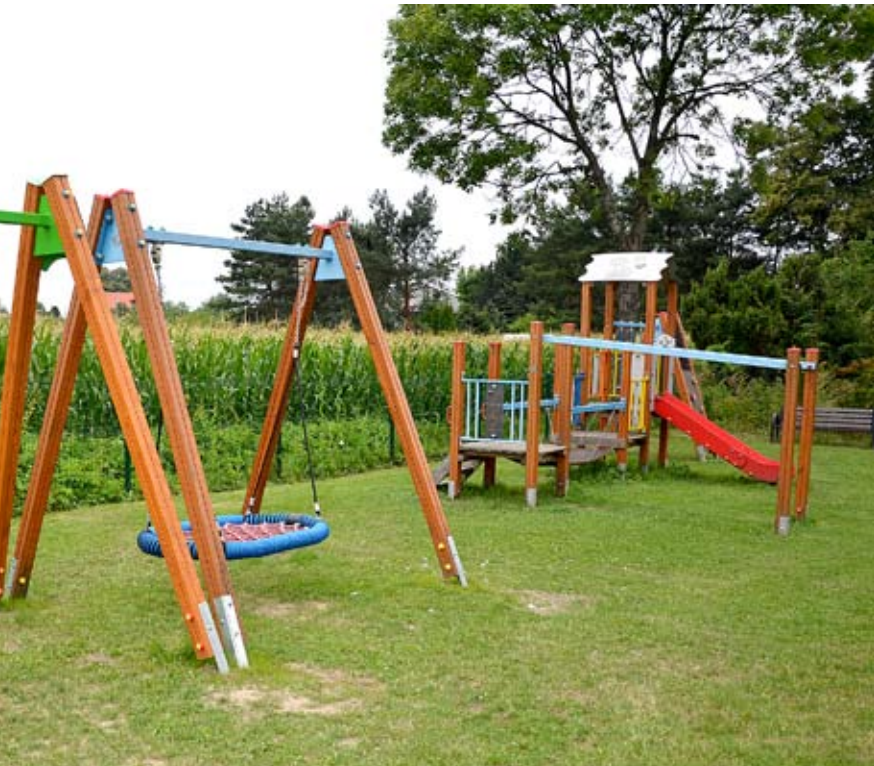
Plac zabaw przy „Degolówce” zyskał nowe oblicze.