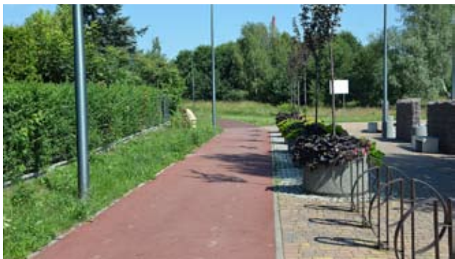
Centrum Przesiadkowe – jak idą prace? / str. 4-5