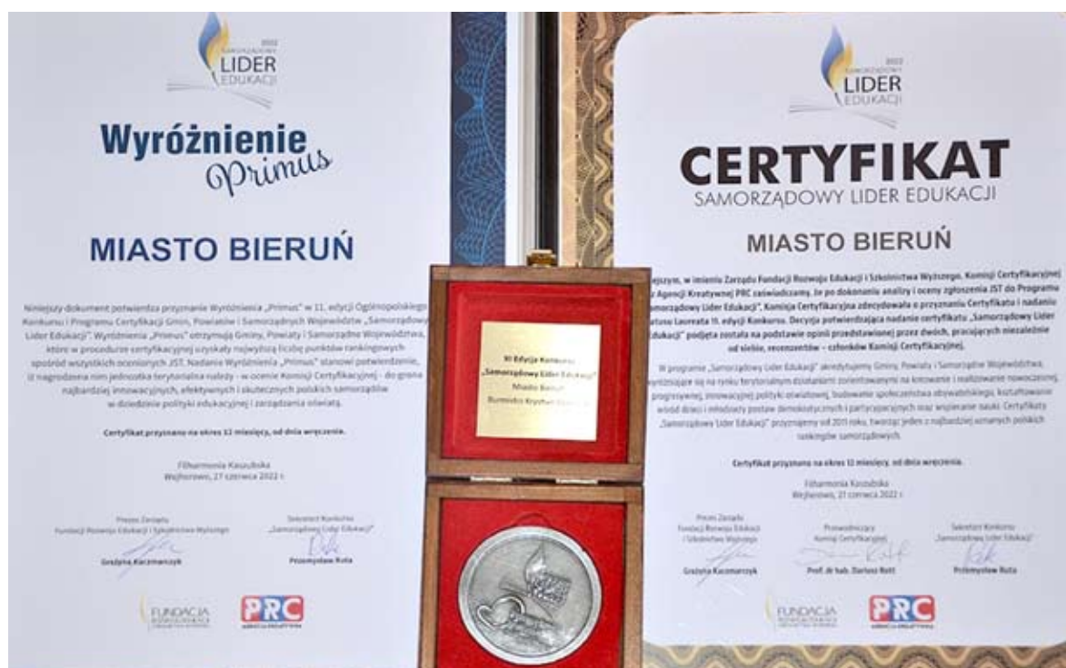
otrzymane przez Bieruń wyróżnienia dowodzą wysokiej jakości edukacji i polityki oświatowej w mieście.

Wzór wniosku wraz z regulaminem są dostępne do pobrania w Biuletynie Informacji Publicznej w zakładce Bieruński Bon Żłobkowy. UMB