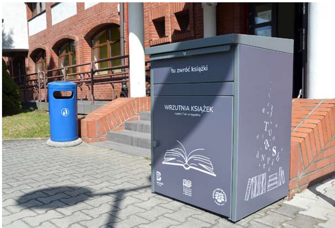
Dzięki Budżetowi Obywatelskiemu przy obu siedzibach Miejskiej Biblioteki Publicznej stanęły wrzutnie do książek

Zrealizowany został też projekt „Modernizacja boisk do buki przy zbiorniku wodnym Łysina”, który zakładał ułożenie betonowych krawężników oraz zakup i montaż tablicy na wyniki i kosztował 4,5 tys. zł. RED