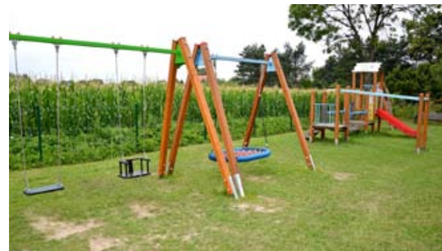
Mieszkańcy mają głos! / str. 8-9