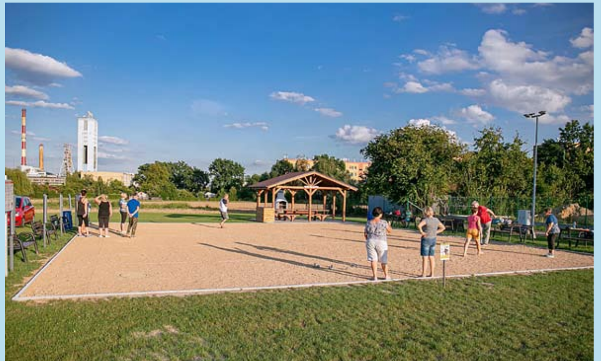
Bulodrom na osiedlu Granitowa prawie zawsze jest pełen grających.