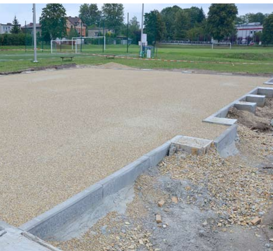
Prace przy budowie Orlika przy ul. Chemików są już coraz bliżej finału.