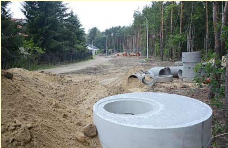
Za dwanaście miesięcy po takich utrudnieniach na ul. Domy Polne i Szynowej nie powinno być śladu.

Prace budowlane na ulicach Domy Polne i Szynowej weszły w kolejny etap. Obecnie trwają roboty związane z wykonaniem instalacji kanalizacyjnej. Przypomnijmy: w ramach tego zadania wykonane zostanie ok. 862 mb kanalizacji tłocznej i ok. 486 mb kanalizacji sanitarnej grawitacyjnej. Wybudowana zostanie również pompownia ścieków.