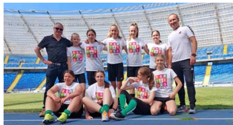
Brązowe dziewczęta z SP 3 na flagowym śląskim stadionie.