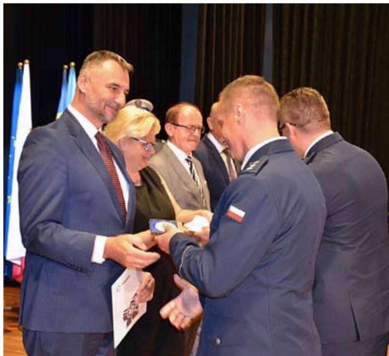
Burmistrz Bierunia odbiera pamiątkowy medal za wieloletnią współpracę samorządu z policją.

Podczas uroczystości w „Gamie” funkcjonariuszom Powiatowej Komendy Policji w Bieruniu wręczono mianowania na wyższy stopień i uhonorowano najlepszych. Wyróżniono też byłych komendantów oraz przedstawicieli sa-