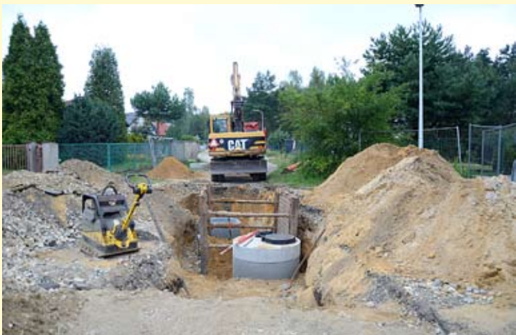
Prace przy ul. Domy Polne i Szynowej pochłoną ok. 7mln. zł.