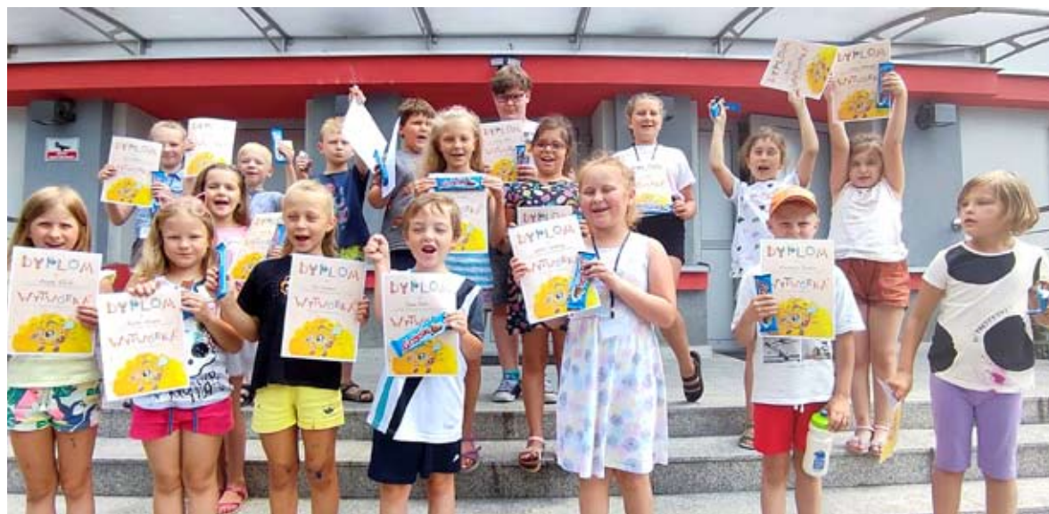
...kolejny BOK zorganizował w DK Gama.