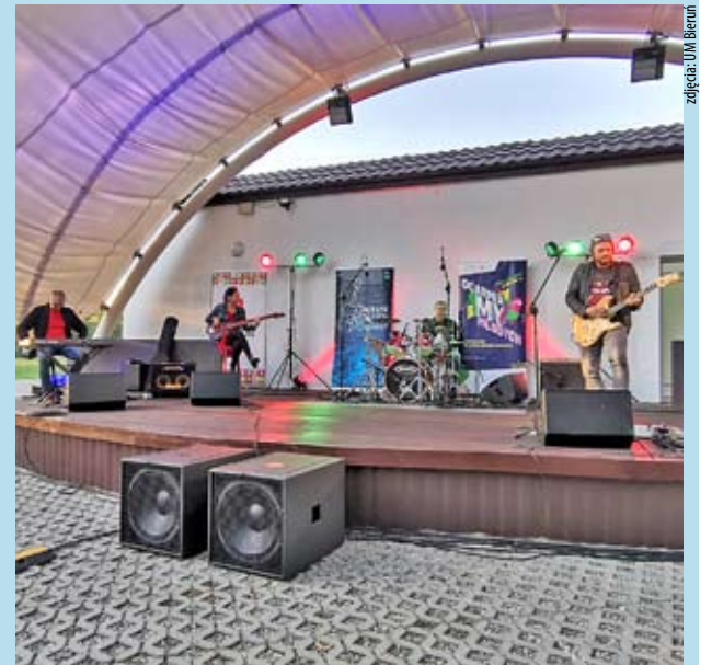
Amfiteatr w RCKG „Remiza” przy ul. Remizowej.