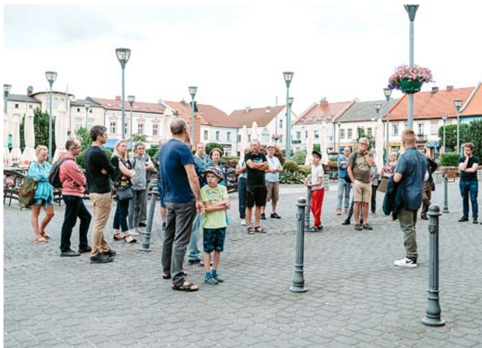
Spacer „Śladem bieruńskich warsztatów i zakładów pracy”.