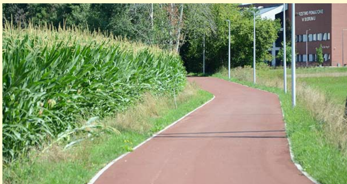
Na łączniku ul. Św. Kingi – Zarzyny pozostało już tylko wymalowanie znaków poziomych.

Wygodne i bezpieczne połączenie rowerowe z dworcem autobusowym powstanie także z kierunku południowego. Pas rowerowy, który zostanie wyznaczony na ul. Zdrowia, połączy dworzec z ulicą Krakowską, gdzie trwa budowa ponad 800-metrowego odcinka drogi dla rowerów. Zostały już wykonane separatory z kostki granitowej, oddzielające ruch samochodowy od rowerowego, rozpoczęto też asfaltowanie. Przy realizacji tego zadania pojawiły się jednak pewne problemy: projekt zakładał zmianę nawierzchni na odcinku ulicy Krakowskiej w rejonie, gdzie rozpoczyna się wjazd na Groblę, z asfaltowej na kostkę granitową. Ten element został już wykonany, spotkał się jednak z dużym