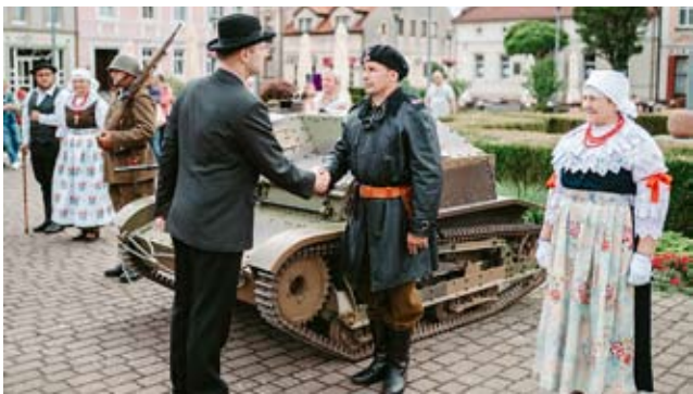
Święto Metropolii w Bieruniu / str. 2