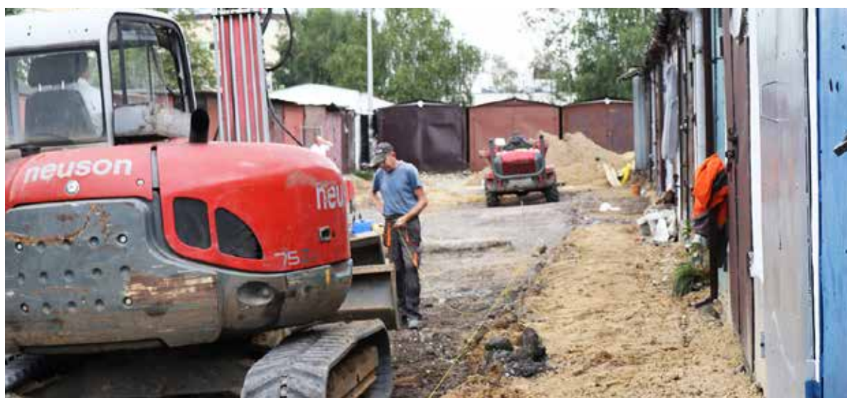
■ Rozpoczął się IV etap modernizacji drogi

na została podbudowa z tłuczni kamiennego. Najnowsza inwestycja objęła remont dalszej części drogi – o szerokości jezdni 5,93 m wraz z dojazdami do garaży i infrastrukturą techniczną, m.in.: kanalizacją deszczową.