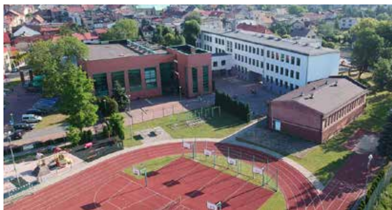
■ Stara sala gimnastyczna pamięta jeszcze lata 60.

Gmina stara się o dofinansowanie ze środków Ministerstwa Sportu i Turystyki. Niezależnie od tego czy środki uda się pozyskać inwestycja zostanie zrealizowana.