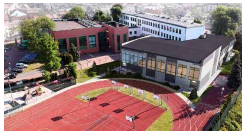
■ Wizualizacja nowej sali sportowej