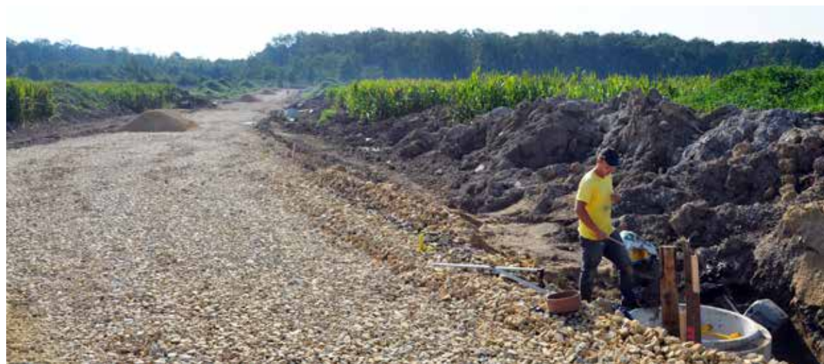
■ Nowa inwestycja na ul. Strefowej