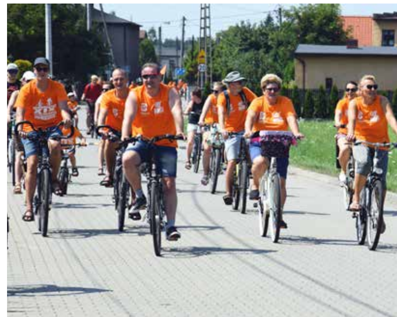
■ Dotarcie na metę dostarczyło wszystkim nie lada satysfakcji

– Pierwszy raz jadę do Bierunia na rowerze. Zazwyczaj korzystam z samochodu, jednak teraz zastanawiam się, czy częściej nie skorzystać