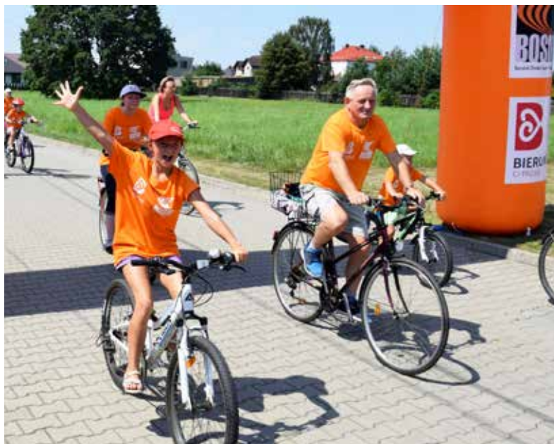
■ Z uśmiechem na mecie Rodzinnego Rajdu Rowerowego