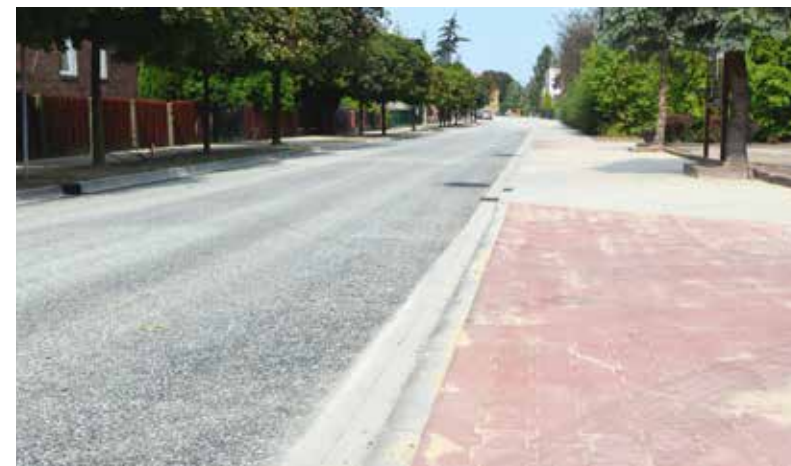
■ Gmina Bieruń wkrótce wymieni oświetlenie na Remizowej