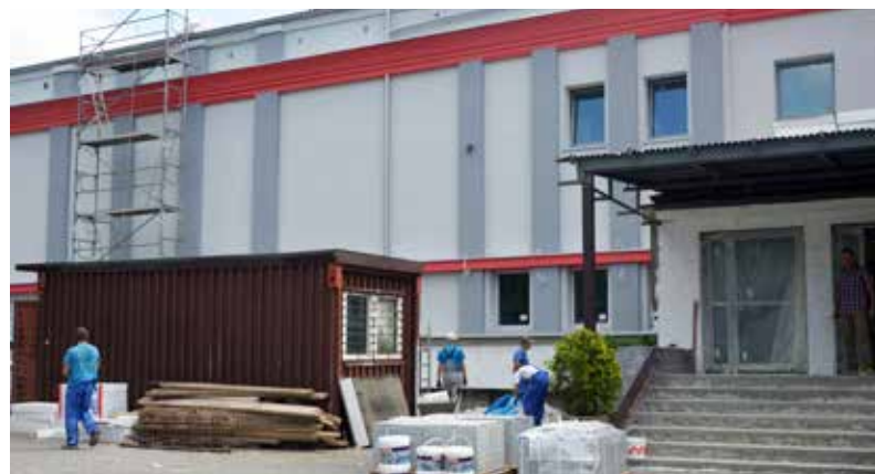
■ „Gama” zyskała nowe oblicze

Termin oddania do użytku wyremontowanego budynku planowany jest na koniec października.