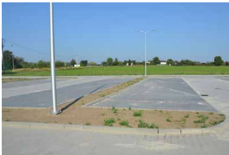
■ Nowe miejsca parkingowe już do użytku

W piątek, 17 sierpnia dokonano odbioru robót budowlanych związanych z budową parkingu przy ulicy Granitowej w Bieruniu Nowym. Jest to zwieńczenie inwestycji trwającej od maja. W konsekwencji powstały tu 44. nowe miejsca parkingowe – w tym dwa dla osób niepełnosprawnych. Zainstalowane zostało również nowoczesne oświetlenie (w technologii LED). Ponadto znajdują się tam elementy małej architektury, m.in.: ławki, stojaki na rowery, kosze na śmieci. Trawa została zasiana, a rośliny posadzone. W najbliższym czasie dosadzone zostaną jeszcze drzewa. Inwestycja zrealizowana została przez firmę Usługi Transportowe Henryk Opitek. Jej koszt to 419 441,37 zł.