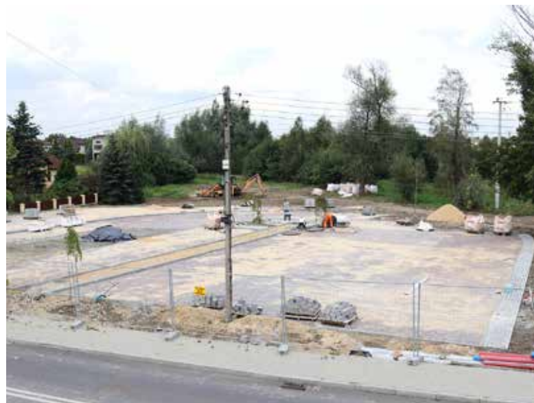
■ Zadbano o nowe miejsca parkingowe i tzw. małą architekturę

Inwestycja realizowana jest przez firmę Iwański Mateusz MARMATOR. Jej koszt to 873 300,00 zł.