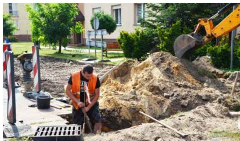
■ Powstają nowe parkingi

Nowe miejsca parkingowe oddane do użytku będą pod koniec października tego roku.