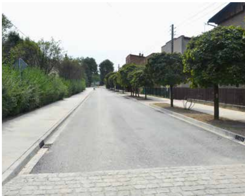
■ Nowa nawierzchnia jezdni na Remizowej

Przypomnijmy, że ulica Remizowa była niegdyś drogą gminną. W 2016 roku przekazana została powiatowi. Starostwo Powiatowe rozpoczęło działania zmierzające do rozpoczęcia gruntownego remontu drogi. W kwietniu tego roku podpisana została umowa z wykonawcą – Firmą Usługowo-Budowlaną FIL-BUD z Katowic na realizację tego zadania.