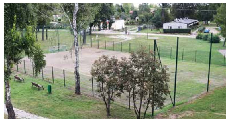
■ Jeszcze kilka tygodni i boisko się zazieleni

mieszkańców. Przeprowadzone na obiekcie prace wpłyną korzystnie na poprawę bezpieczeństwa oraz komfortu gry w piłkę nożną. Inwestycja ta to efekt projektu zgłoszonego przez mieszkańców w ramach Budżetu Obywatelskiego. Jej koszt wyniósł ponad 22 tys. zł.