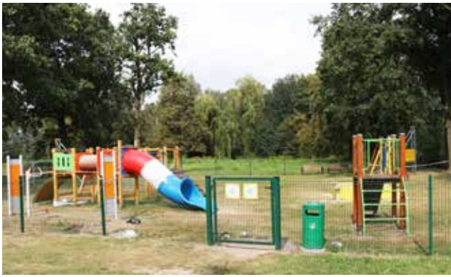
W zdrowym ciele, zdrowy duch / str. 7