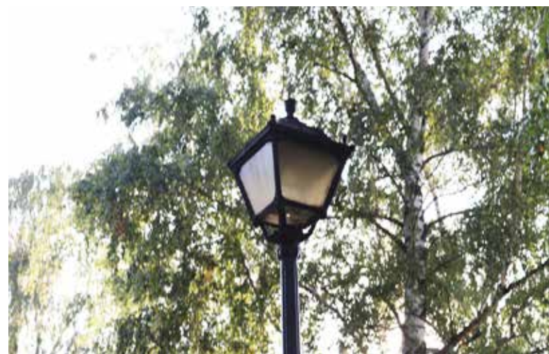
■ Dotychczasowe lampy zostaną zastąpione nowoczesnymi ledowymi

znacznego obniżenia kosztów utrzymania oświetlenia ulicznego, zwiększając jednocześnie jego niezawodność. Niewątpliwymi zaletami lamp ledowych są efektywność – zapewniają bowiem bardzo dobrą widoczność, a także trwałość – ich żywotność jest znacznie dłuższa niż w przypadku oświetlenia kablowego. Ponadto, oświetlenie uliczne typu LED jest bardzo ekologiczne – gwarantuje niską emisję spalin. Wartość tej inwestycji to blisko 700 tys. zł. Zadanie realizuje firma Tomala Marek Przedsiębiorstwo Handlowo-Usługowe „TOM-ELECTRO I”. Obecnie przeprowadzane są prace ziemne związane z okablowaniem. Inwestycja zakończy się w drugiej połowie października.