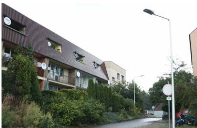
■ Nowe oświetlenie na osiedlu