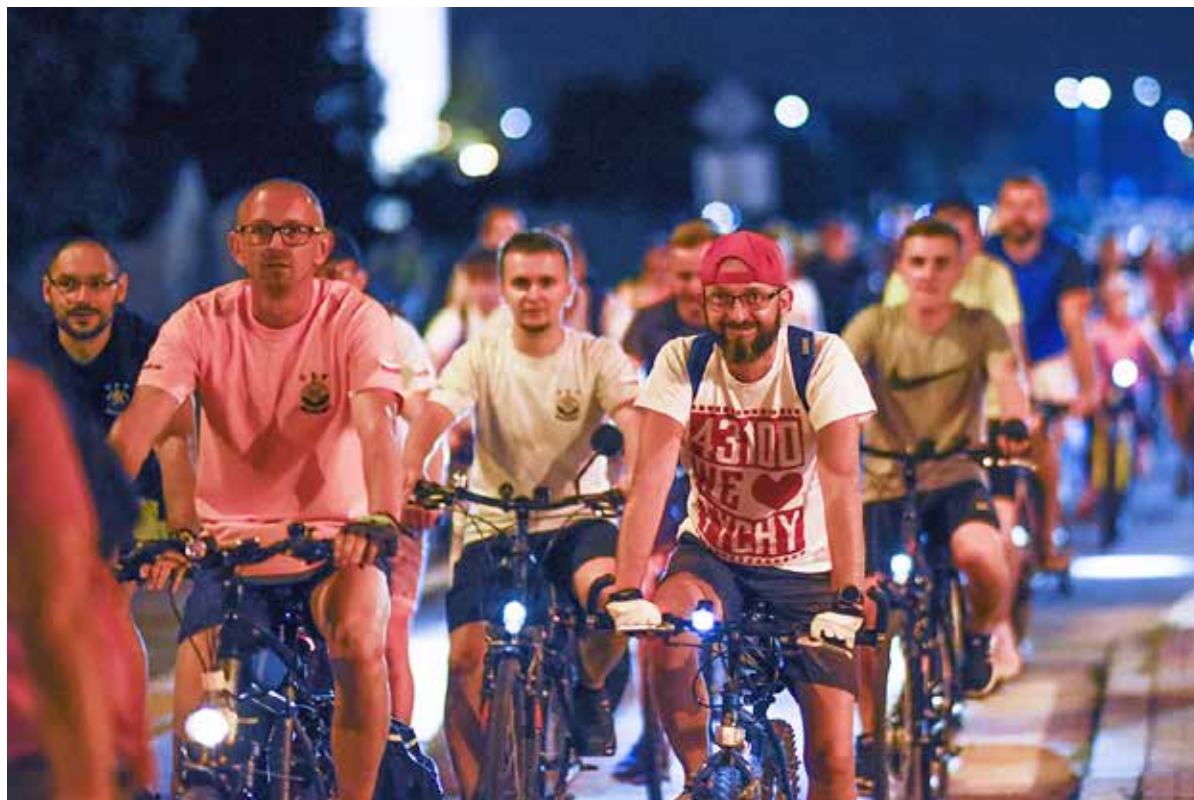
■ Nocą na rowerze nad Łysiną