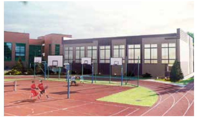
Sala Gimnastyczna przy SP1 / str. 4