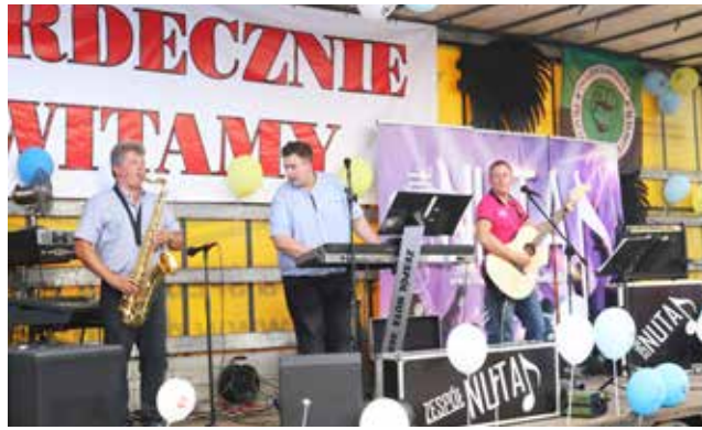
Letnich wspomnień czar / str. 10,11