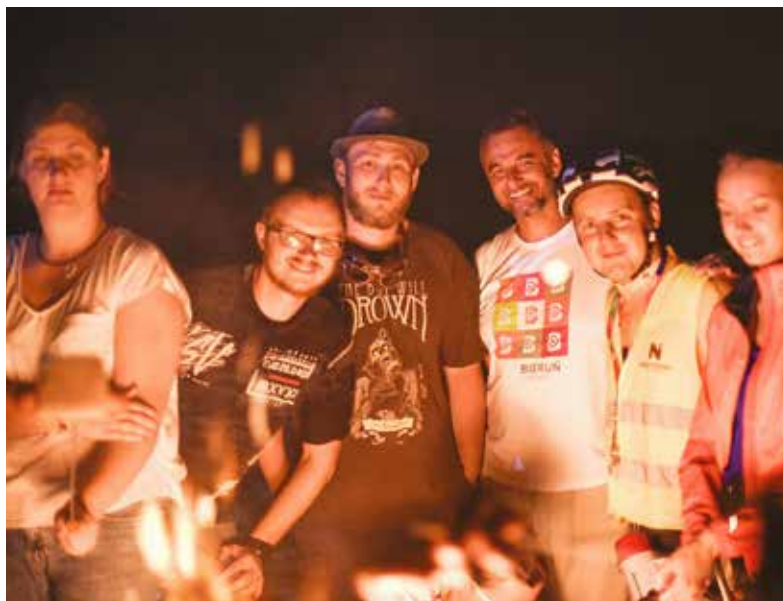
■ Burmistrz Bierunia na tysinie powitał uczestników nocnego rajdu