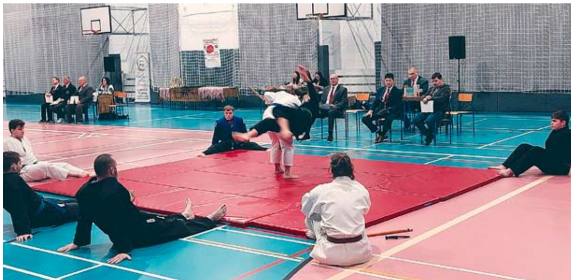
W kolejnym Grand Prix Bierunia wystartowała setka adeptów dalekowschodnich sztuk walki.