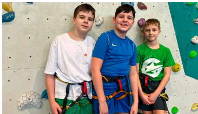
Zajęcia w Centrum Wspinaczkowym Adrenalina pokazały, że młodzie bierunianie są silni i odważni.

Większość uczestników aktywnych ferii na sportowo żałowała, że na następne czekać trzeba będzie aż... do letnich wakacji. RN