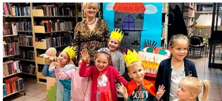
Księżniczki i rycerze spotkali się w obu bieruńskich bibliotekach.

BIERUŃSKIE BIBLIOTEKI PRZYGOTOWAŁY W CZASIE WOLNYM OD SZKOŁY SZEREG ATRAKCJI DLA DZIECI.