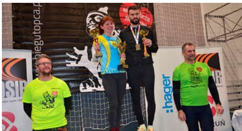
Na podium najlepsza bierunianka i najlepszy bierunianin tegorocznego biegu.