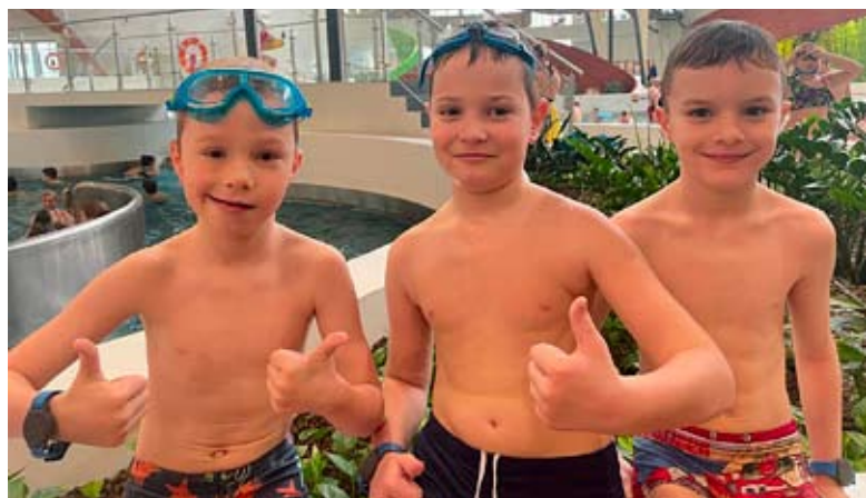
Nie było chyba nikogo, kto nie byłby zadowolony z wizyty w Wodnym Parku Tychy.