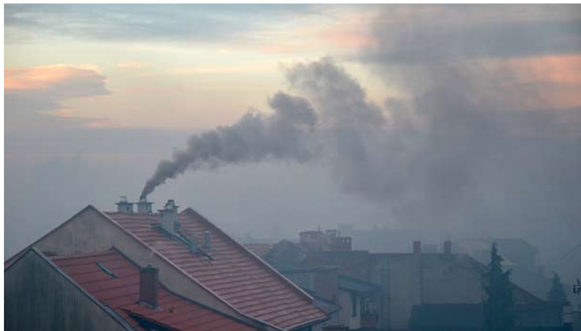
Wszyscy musimy dbać o to, by powietrze, którym oddychamy, było jak najmniej zanieczyszczone.

Są przypadki, w których kontrolujący wyjątkowo odstępują od nałożenia mandatu. Należą do nich sytuacje, w których np. są problemy z podłączeniem do sieci gazowej czy ciepłowniczey (gdy kontrolowana osoba potrafi udokumentować, że poczyniła starania w kierunku przyłączenia, a opóźnienie nastąpiło z przyczyn od niej niezależnych). Innym „łagodzącym” czynnikiem może być sytuacja na rynku i kłopoty z dostępnością samych