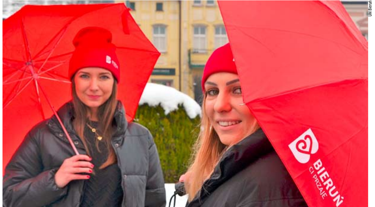
Walentynkowym upominkiem, jak najbardziej na czasie, może być śliczna czerwona czapka zimowa z logo „Bieruń Ci przaje”.

W Bieruniu wielowiekowa tradycja jest wciąż żywa, jednak akcenty