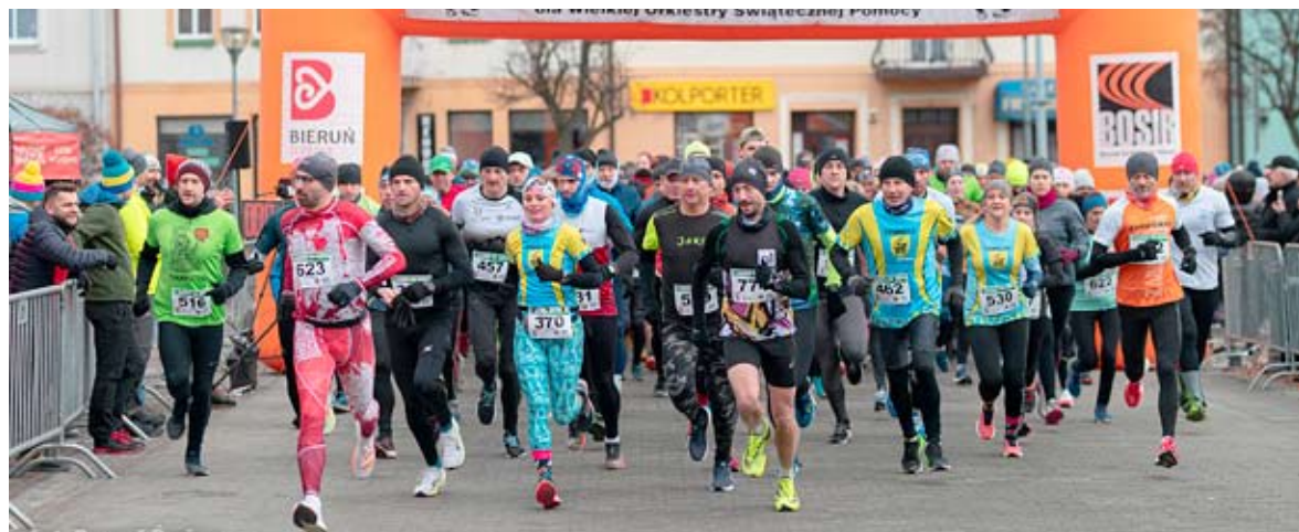
Wliczając dzieci, w 9. edycji Bieruńskiego Biegu Utopca wzięło udział ponad 900 osób.