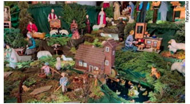
Bieruńscy stajenkorze / str. 10-11