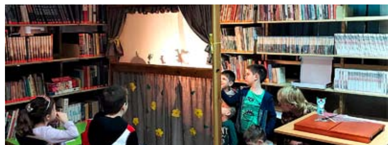
Biblioteczna zabawa w teatrzyk cieni.

Biblioferie pokazały, że biblioteka to nie tylko miejsce, które może dawać przepustkę do świata książki, ale także magiczny świat nauki i zabawy. MG