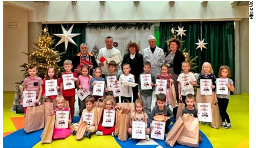
Nagrodzeni i wyróżnieni uczestnicy konkursu z Przedszkola nr 1...