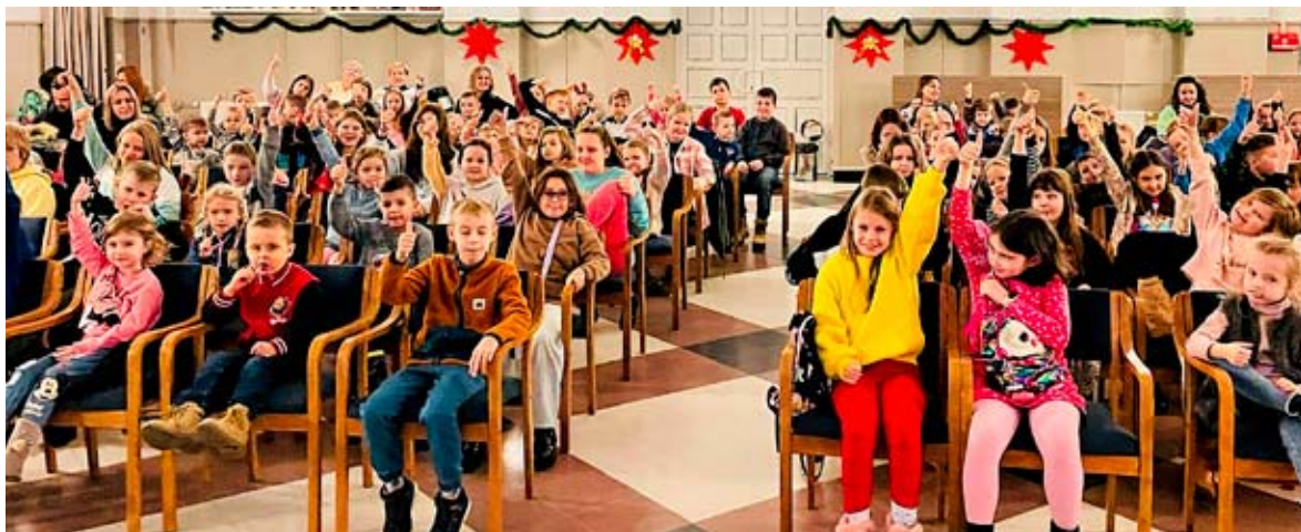
Wyciągnięte w górę kciuki świadczyły o tym, że bajkowe seanse bardzo się najmłodszym bierunianom podobały.

- Bardzo się cieszymy, że nasza propozycja przypadła dzieciakom do gustu i miło nam było patrzeć, jak dzieci wychodziły uśmiechnięte i zadowolone, a atmosfera kina, wielki ekran, zaciemnienie i zapach popcornu, który czekał na każde dziecko, spowodowały, że mogliśmy usłyszeć wręcz entuzjastyczne komentarze – cieszyli się animatorzy z BOK-u. MG