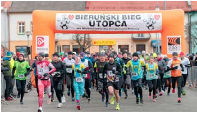
Bieganie z Utopcem / str. 5