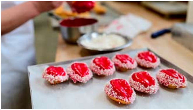
Walentynkowe niespodzianki / str. 3