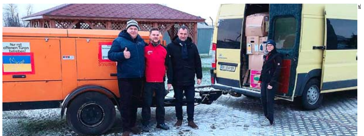
Samochód wyładowany darami – można jechać na Ukrainę!

Będą dostępne także na stoisku Miasta Bierunia (na Rynku) w formie nagród konkursowych!