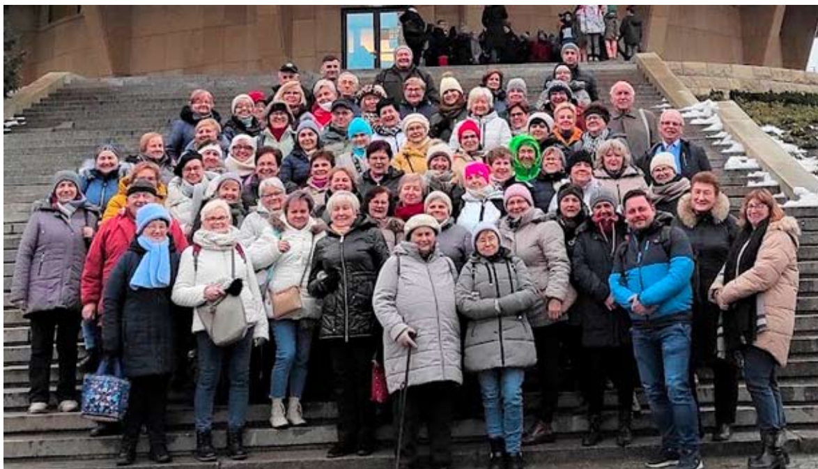
Liczna grupa bieruńskich seniorów przed Planetarium Śląskim.