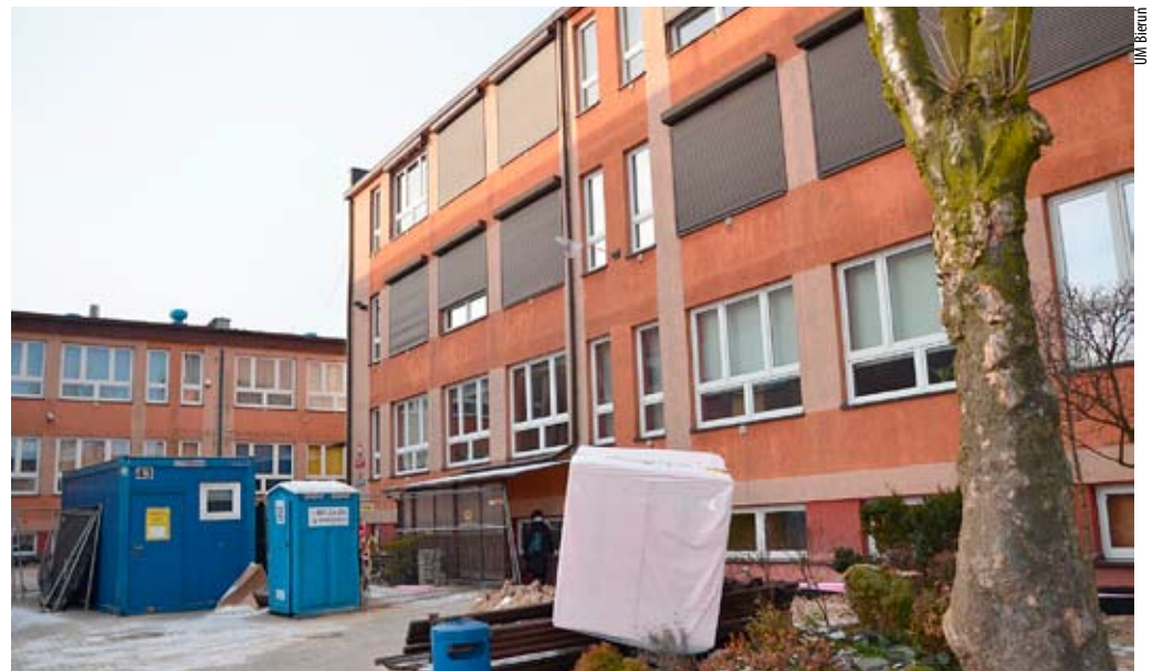
W budynku Szkoły Podstawowej nr 1 przy ul. Licealnej prace termomodernizacyjne idą pełną parą.

Zadanie pn.: „Modernizacja energetyczna budynków użyteczności publicznej w Gminie Bieruń” dofinansowane jest w 85 procentach ze środków Unii Europejskiej w ramach Regionalnego Programu Operacyjnego Województwa Śląskiego na lata 2014–2020. SW