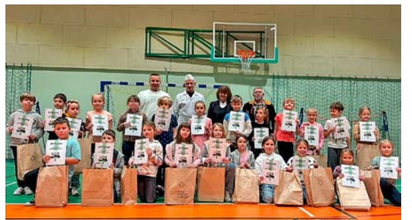
... i Szkoły Podstawowej nr 1 w Bieruniu.