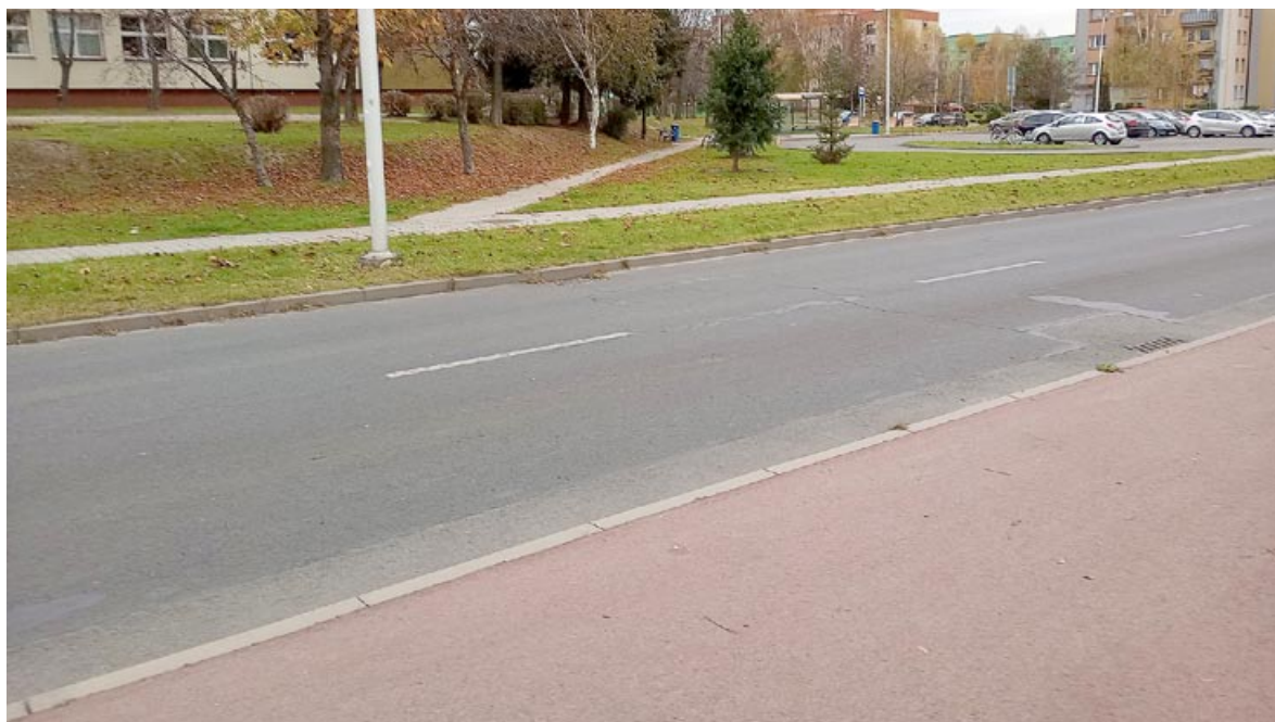
W tym miejscu ma powstać przejazd – tak zdecydowali mieszkańcy.