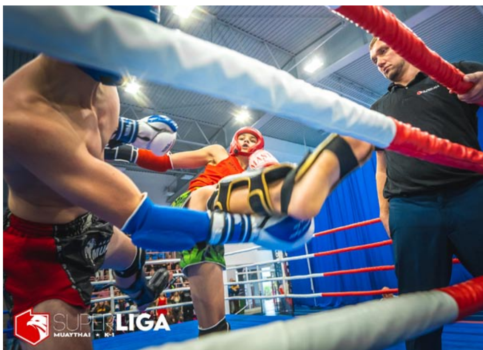
Kibice oglądali wiele widowiskowych walk w różnych stylach.