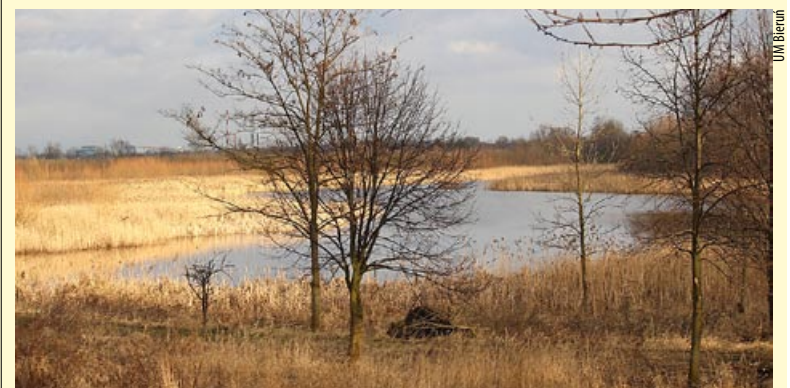
Prace projektowe nad zagospodarowaniem tego terenu potrwać rok.