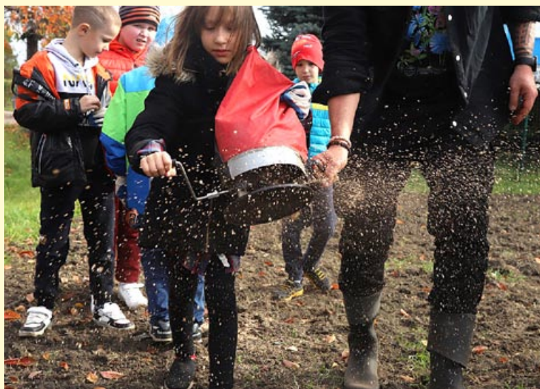
Jednym z elementów warsztatów dla dzieci było wspólne wysiewanie łąk kwietnych.

Łąki kwietne mają nie tylko pięknie wyglądać, lecz przede wszystkim wspierać przetrwanie owadów zapyłających i to zarówno w trudnych warunkach zabetonowanej przestrzeni miejskiej, jak również na obszarach