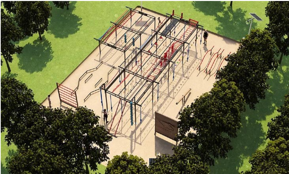
Mniej więcej tak ma wyglądać Crossfit Ninja Warrior Park Bieruń, który wygrał głosowanie w kategorii projektów ogólnomiejskich.

Znamy już wyniki głosowania w Budżecie Obywatelskim 2023! Zrealizowany zostanie jeden projekt o charakterze ogólnomiejskim i pięć projektów tzw. małych. Dziękujemy za oddane głosy!