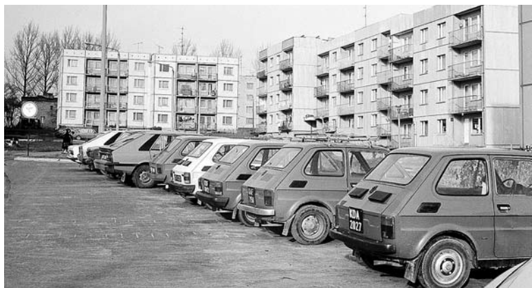
Osiedle Węglowa, lata 1985-1989. Widok na zaparkowane przed blokami maluchy, fiaty 125p i polonezy.