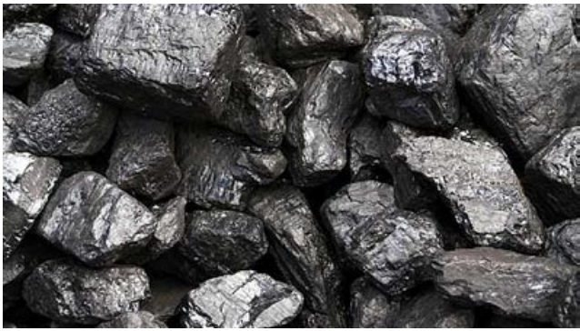
Wsparcie w zakupie węgla / str. 2