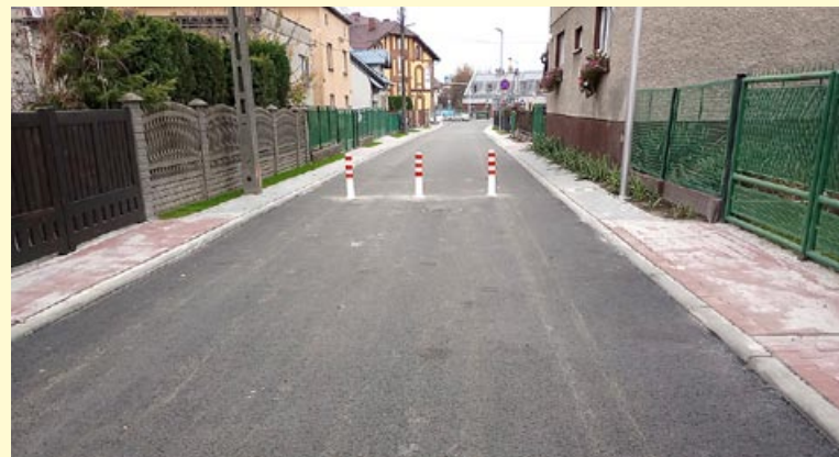
Nowe oblicze ulicy Piastowskiej już cieszy oczy mieszkańców.

Koniec października to finisz prac przy przebudowie ul. Piastowskiej. Roboty zostały zakończone, a wyremontowana ulica czeka na odbiory techniczne.