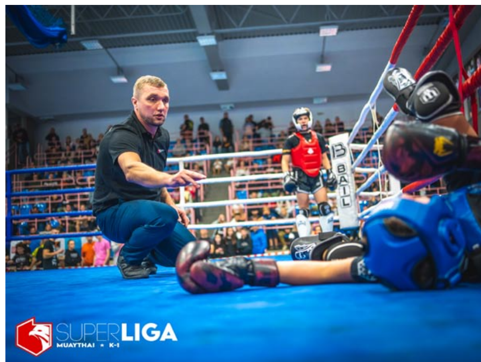
Na bezpieczeństwem walczącej młodzieży czuwali sędziowie i służby medyczne.