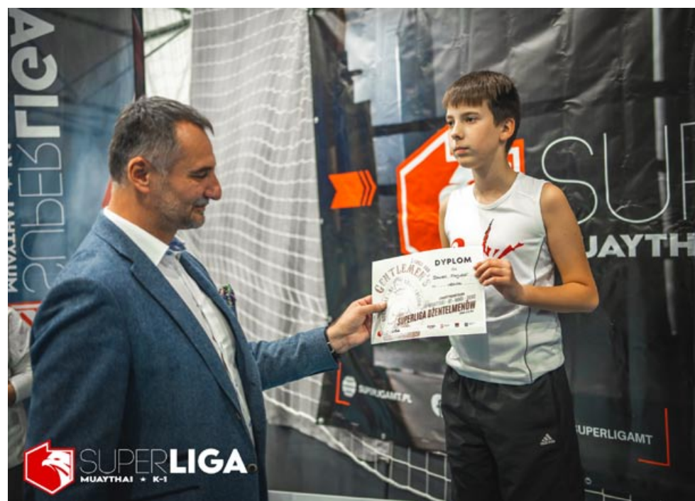
Dyplomy i medale wręczone przez burmistrza Bierunia będą cenną pamiątką dla uczestników zawodów.