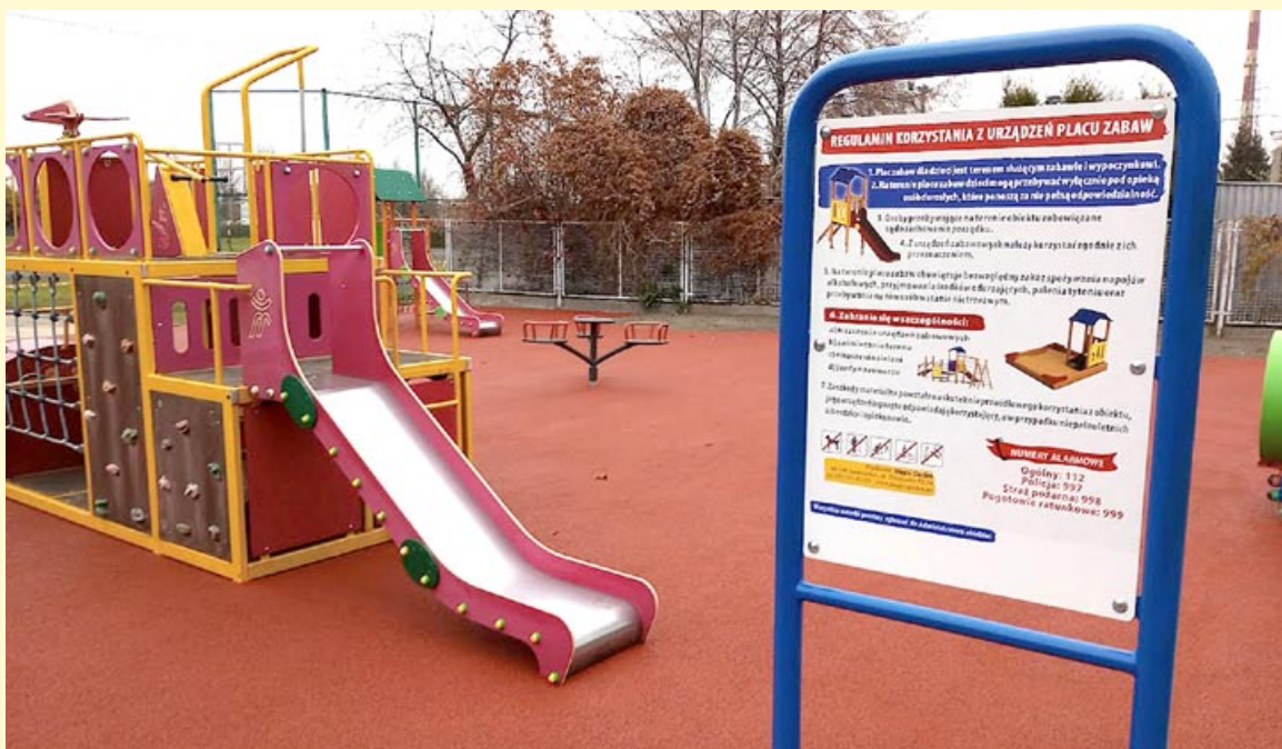
... a tak prezentuje się dzisiaj.