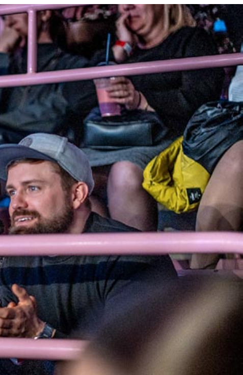
ubliczności, która wypełniła widowie, często gościł zachwy.

W październiku w Kinoteatrze „Jutrzenka” odbyła się miła uroczystość jubileuszowa. Zespół folklorystyczny „Bierunianki” obchodził swoje 35-lecie. W spotkaniu wzięli udział byli i obecni członkowie zespołu, przedstawiciele władz samorządowych Bierunia oraz proboszcz miejscowej parafii.