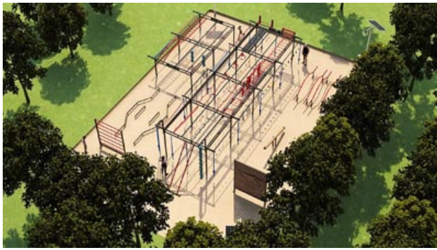
Wyniki Budżetu Obywatelskiego 2023 / str. 6