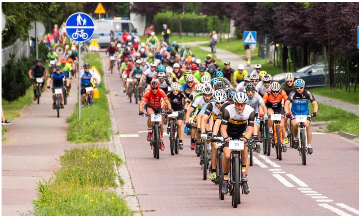
Bieruński Puchar MTB