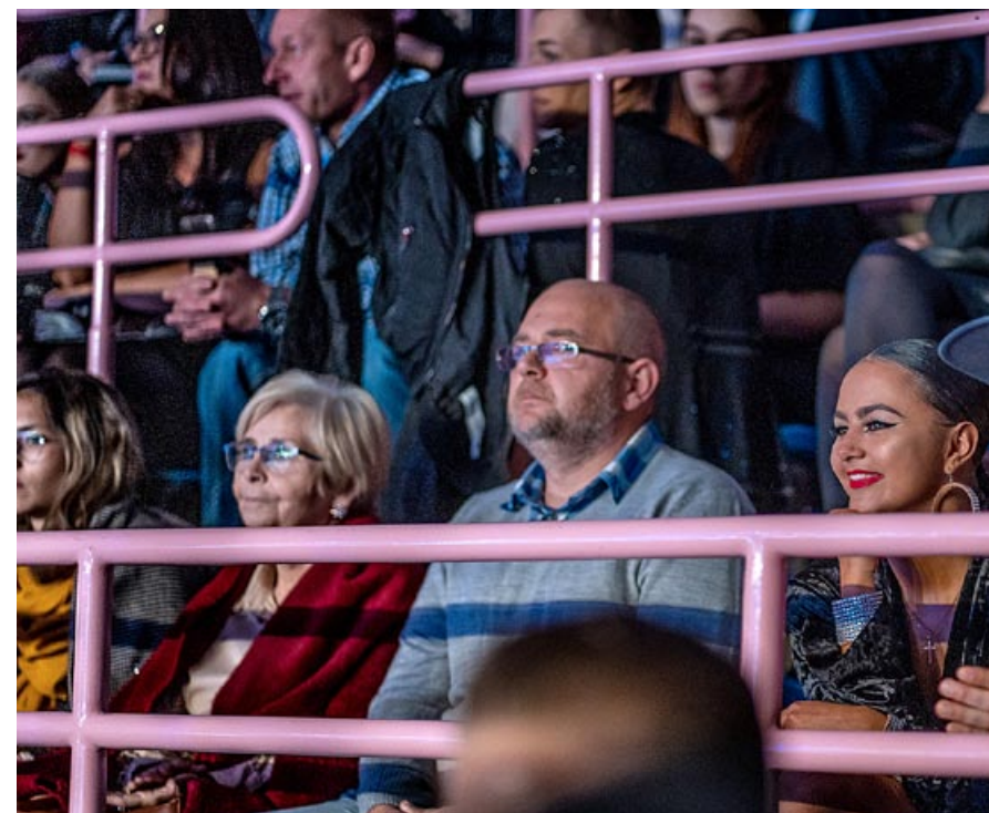
W oczach pu