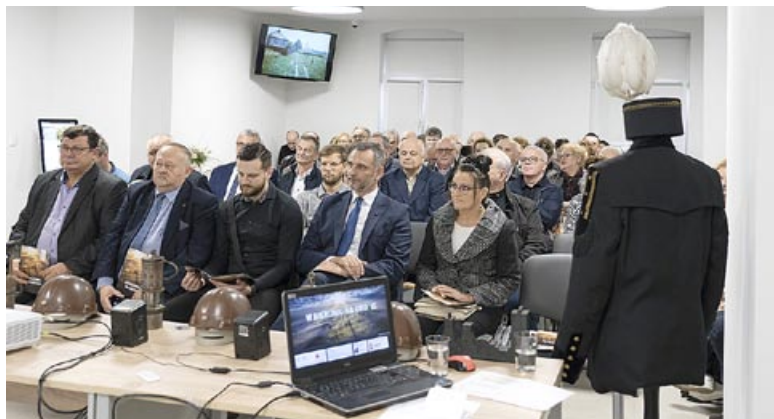
Podsumowanie projektu spotkało się z dużym zainteresowaniem.

Niedzielne spotkanie zgromadziło kilkadziesiąt osób zainteresowanych tematem górnictwa na terenie Bierunia. W czasie jego trwania koordynatorki