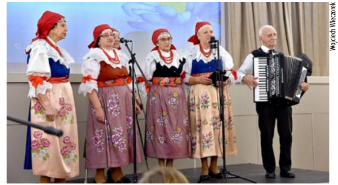
Zachowują naszą kulturę / str. 9