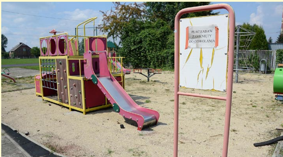
Tak plac zabaw przy Szkole Podstawowej nr 3 wyglądał jeszcze w sierpniu...

Przypominamy, że także boiska przy Szkole Podstawowej nr 3 zyskają niedługo nowe nawierzchnie. W lipcu Miasto Bieruń otrzymało prawie 2 mln zł dofinansowania w ramach trzeciej edycji rządowego Programu Inwestycji Strategicznych POLSKI ŁAD (PGR), na realizację zadania pn. „Modernizacja infrastruktury sportowo-rekreacyjnej na terenie gminy Bieruń”. SW