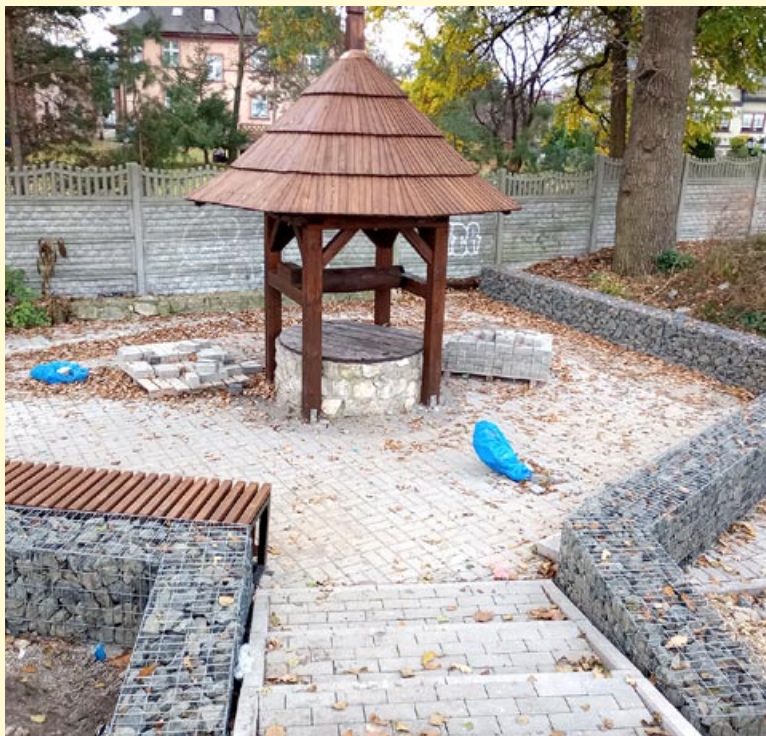
Zabytkowa studnia już znowu stoi. Teraz wokół niej trwa zagospodarowywanie terenu.