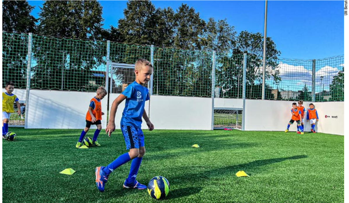
Grupy dziecięce i młodzieżowe Unii trenują na nowych Orlikach przy ul. Chemików.

Dzięki rozstrzygniętemu właśnie głosowaniu, w 2023 roku kompleks Unii wzbogaci się także o kolejne urządzenia, tym razem nie związane z piłką nożną. Projekt „Crossfit Ninja Warrior Park Bieruń”, wybrany przez mieszkańców do realizacji, zakłada