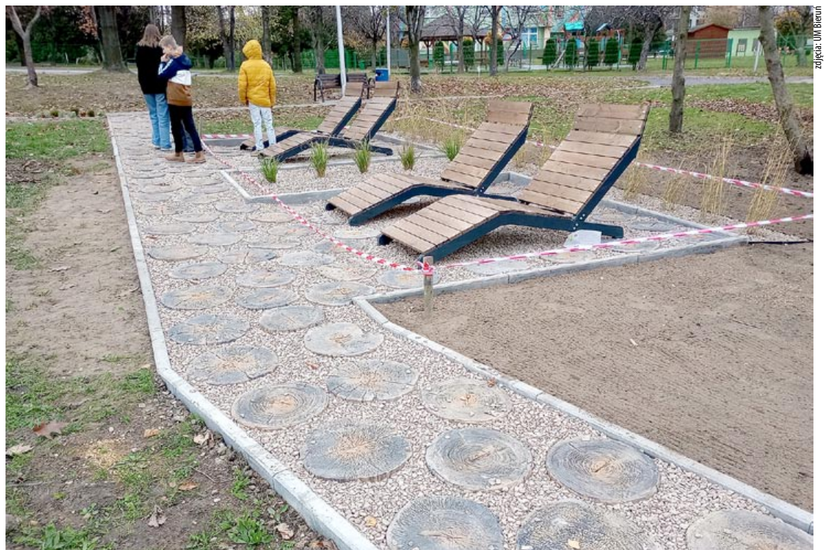
Strefy relaksu w Bieruniu Nowym, realizowane w ramach Budżetu Obywatelskiego 2022, są na końcowym etapie realizacji.

Więcej o projektach można przeczytać na stronie internetowej bierun.budzet-obywatelski.org