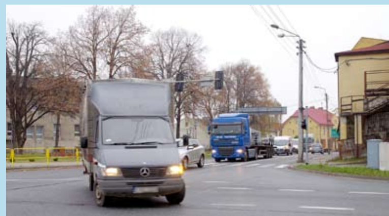
To skrzyżowanie w Bieruniu Nowym zostanie zastąpione rondem. Ogłoszono przetarg na projekt.

Wojewódzkich. Te starania przyniosły efekty – przetarg na wykonanie dokumentacji projektowej to ważny krok w kierunku realizacji tego złożonego i kosztownego przedsięwzięcia. SW