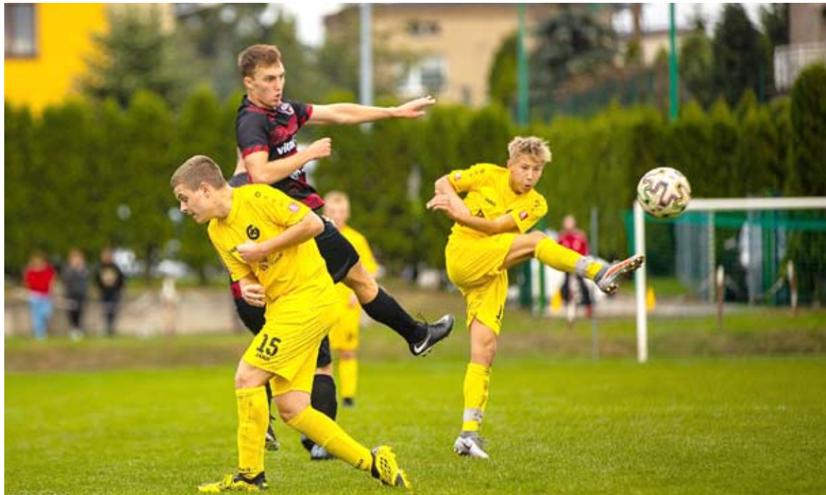
Piłkarze Gola Bieruń udanie rozpoczęli przygodę z seniorską piłką. Po rundzie jesiennej są na 7 miejscu w tabeli klasy B.

Zakończyła się pierwsza część sezonu 2020/2021, ale nie wszystkie mecze się odbyły. Kilka przeniesiono na ostatni weekend listopada, a terminów innych jeszcze nie ustalono, w tym spotkania LKS Brzeźce – Unia Bieruń Stary. W przypadku klasy A nie ma to większego znaczenia, choć wygrana Unii pozwoliłaby jej awansować o jedno „oczko”, ale inaczej jest w przypadku ligi okręgowej. Z uwagi na reformę rozgrywek, przed rozpoczęciem drugiej rundy muszą zostać skompletowane obie grupy – mistrzowska i spadkowa.