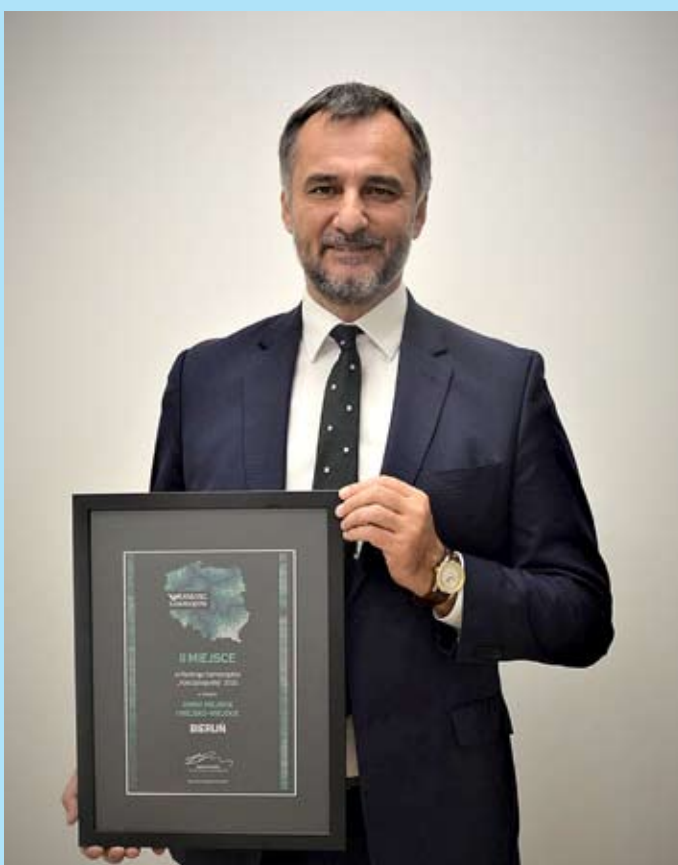
mat.prac. UM Bieruń

Nie spoczywamy zatem na laurach, zamierzamy dalej prężnie działać. W przyszłym roku planujemy zrealizować jeszcze więcej inwestycji, niż w roku bieżącym, choć jest on pod względem zrealizowanych zadań rekordowy. Jak to jest możliwe w dobie pandemii? Tytaniczna praca Biura Funduszy Zewnętrznych sprawiła, że aż 60% inwestycji miejskich będzie w przyszłym roku finansowanych ze źródeł zewnętrznych.