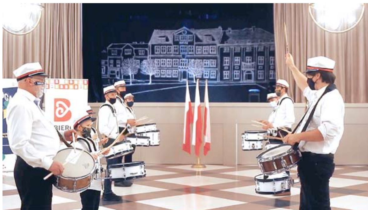
Werble na Święto Niepodległości zabrzmiały dumnie i z energią, mimo iż występ nie odbył się na Rynku lecz był transmitowany dla mieszkańców z „Jutrzenki”.