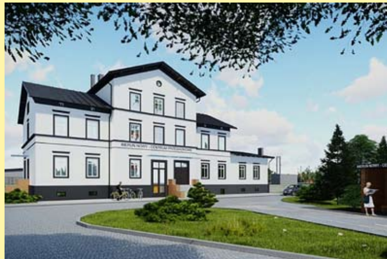
Tak będzie wyglądał dworzec po przebudowie.