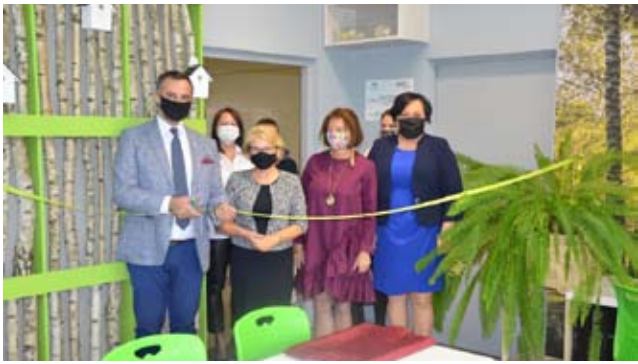
Zielona Pracownia w SP nr 3 / str. 7