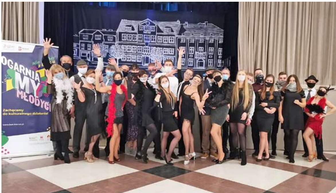
Grupa uczestnicząca w zajęciach „Taneczny wehikuł czasu” podczas ostatniego spotkania tańczyła w strojach z lat 20. ubiegłego wieku. Nie odbyła się niestety ogólnodostępna potańcówka dla mieszkańców.

Bieński Ośrodek Kultury ogłasza świąteczną odsłonę akcji, która latem cieszyła się dużym zainteresowaniem, czyli „Zagraj, zaśpiewaj na BOK-u”. Zachęcamy do nagrywania kolęd i przesyłania tych nagrań do Bieńskiego Ośrodka Kultury. Kolędy w wykonaniu mieszkańców będą publikowane na facebookowym funpage’u BOK-u.