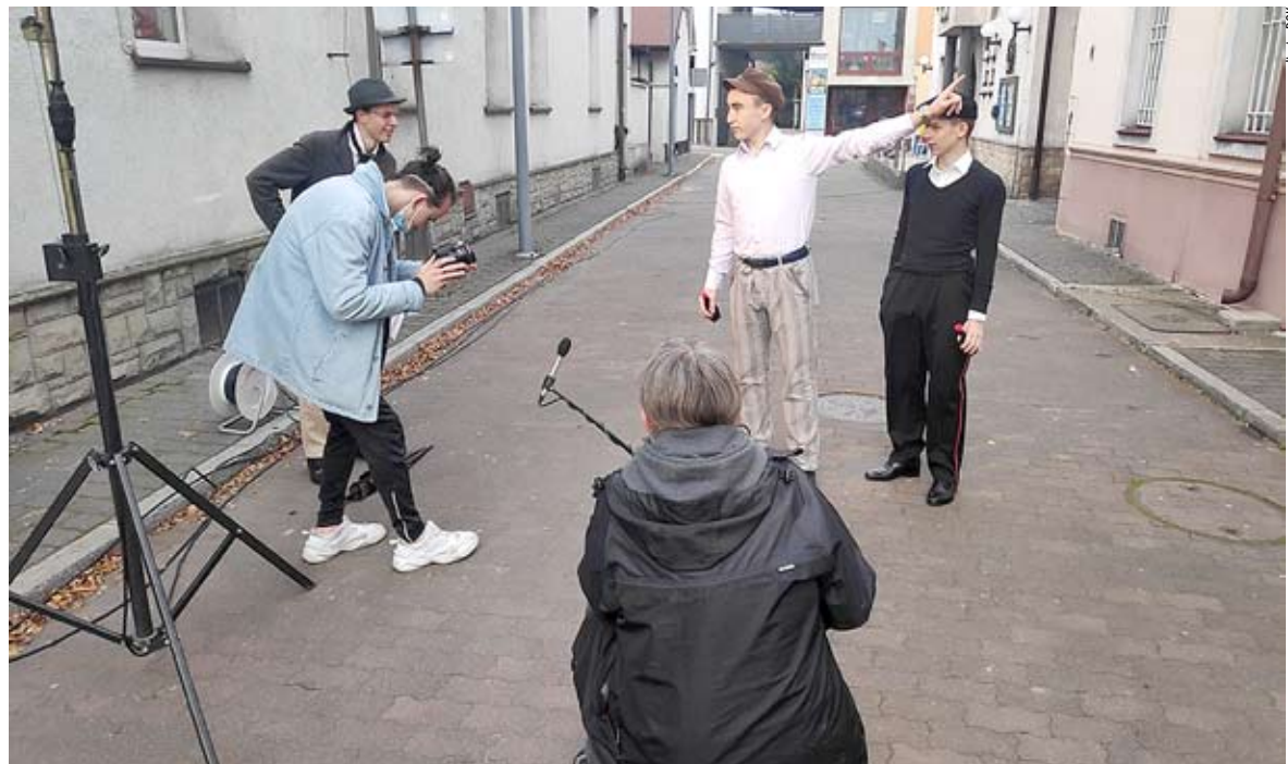
W ramach projektu „O czym Gołys szumi” powstaje krótki film fabularny osadzony w historycznym Bieruniu.

Kolejnym świetnym projektem, który trwał przez całe trzy miesiące było kręcenie filmu pt. „O czym Gołys szumi”. Uczestnicy – głównie licealiści – uczyli się jak zbierać historię mówioną, jak rozmawiać ze starszymi ludźmi i nakłaniać ich do opowiadania nieoczywistych historii, które wiele mogą nam powiedzieć o przeszłości Bierunia.