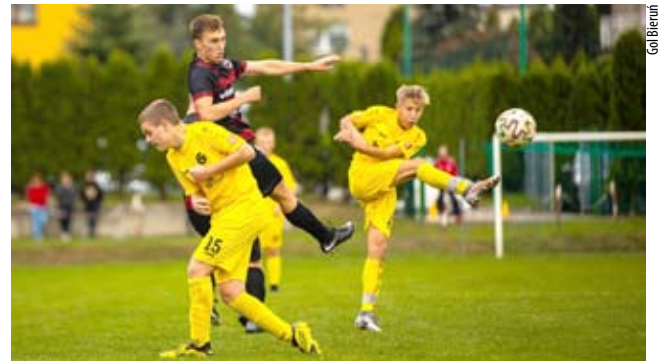
Pierwsza runda na plus / str. 15