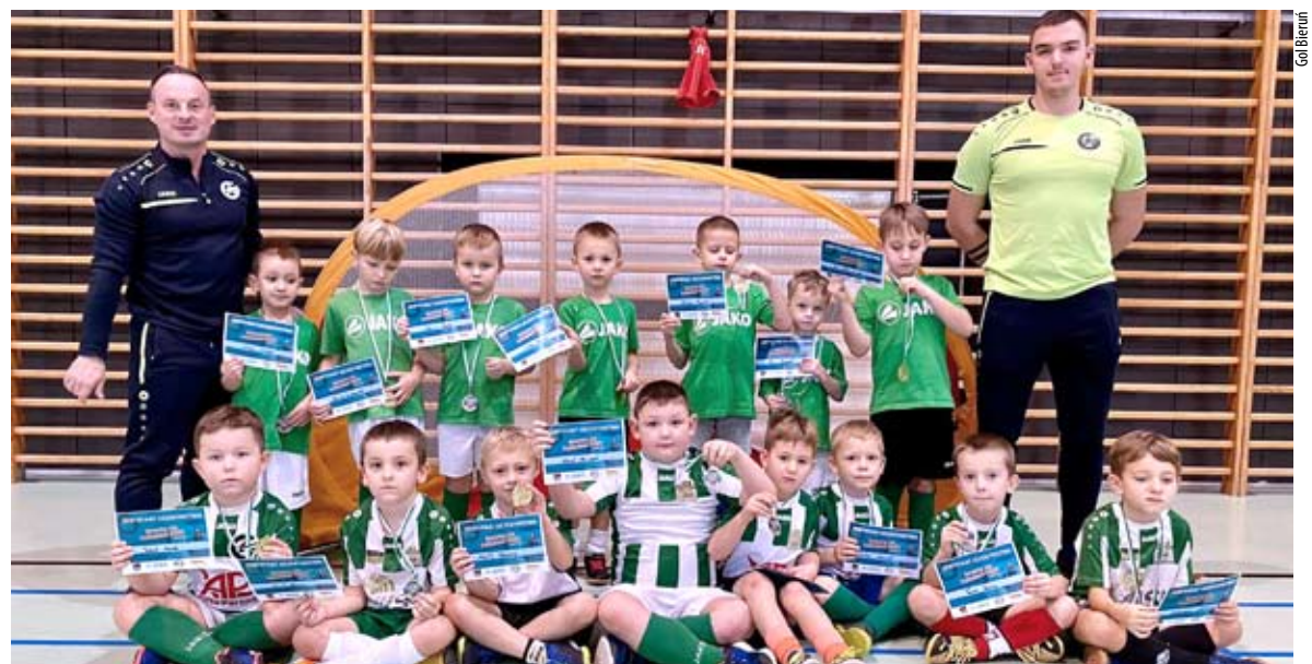
Najmłodszy piłkarze Gola (rocznik 2014) z certyfikatami, które kiedyś będą dla nich cenną pamiątką.