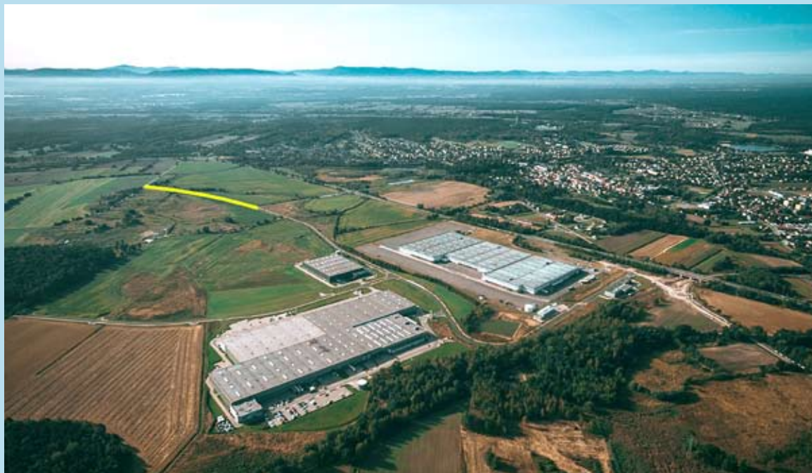
Zaznaczony kolorem żółtym odcinek to miejsce, gdzie powstaje łącznik pomiędzy ul. Ekonomiczną i Hodowlaną.

Wszystko ma być gotowe do stycznia 2022 roku.