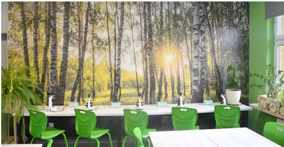
Brzozowy las to motyw przewodni wystroju pracowni przyrodniczej.