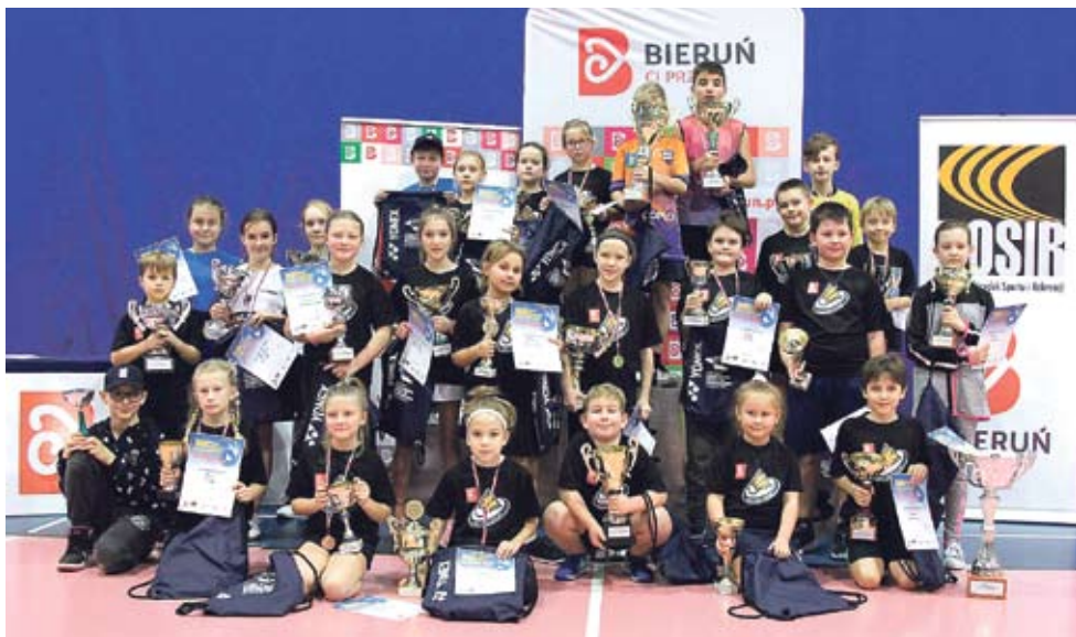
W tym roku w Mistrzostwach Miasta Bierunia w badmintonie wzięli udział najmłodszy.