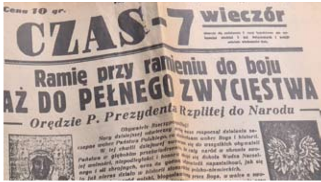
Skarb znaleziony w piwnicy / str. 10