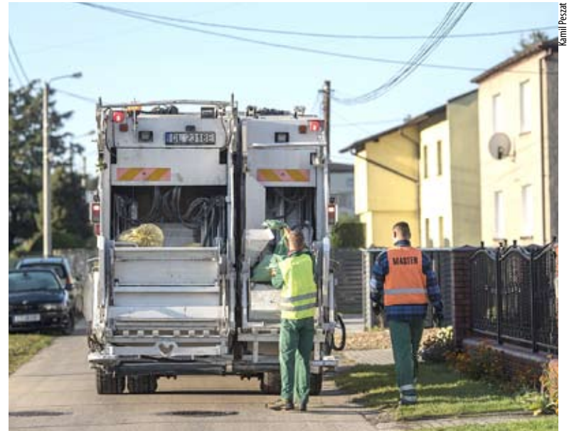
Dwukomorowa śmieciarka umożliwia odbiór dwóch rodzajów odpadów jednocześnie.

Ponieważ trwa okres grzewczy, przypominamy, że obowiązuje bezwzględny zakaz spalania odpadów na terenie nieruchomości oraz w piecach domowych. Zakazuje