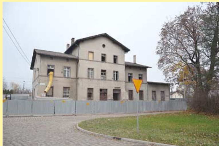
W budynku dworca PKP rozpoczęły się prace rozbiórkowe.