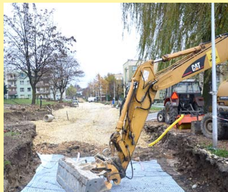
Na ul. Węglowej wewnętrznej wykonywana jest podbudowa drogi i zabezpieczenia związane ze szkodami górniczymi.

Wykonawcą robót jest firma INFRAFRAX Sp z o.o z siedzibą w Bojszowach. Przewidywany termin zakończenia robót to sierpień 2021 r. Całkowita wartość inwestycji wynosi 1 114 253,54 zł. Na połowę tej kwoty gmina Bieruń pozyskała dofinansowanie z rządowego Funduszu Dróg Samorządowych. SW