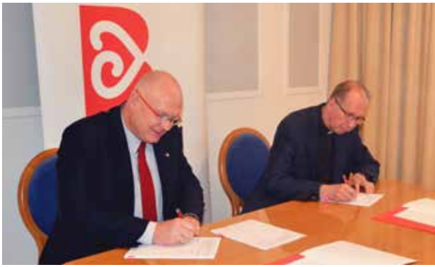
Renowacja „Walencinka” / str. 6