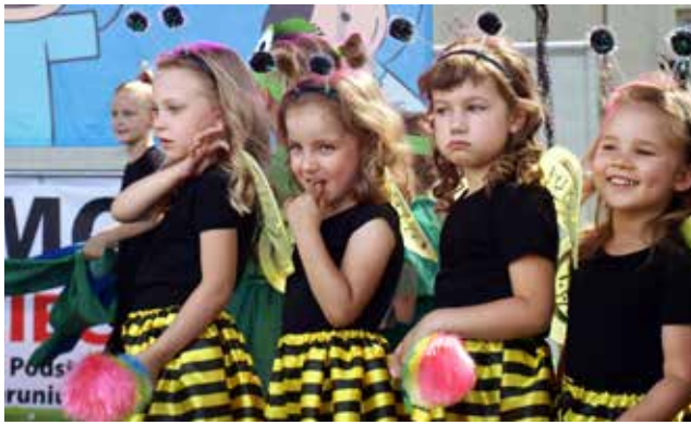
Smok czy smog / str. 8