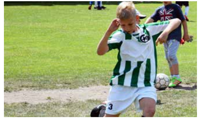
Mundial w Bieruniu / str. 14