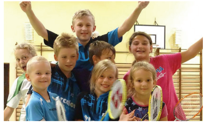
Sportowa pasja / str. 14