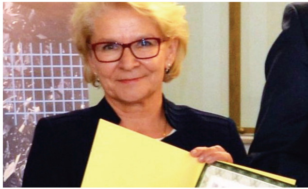
W czołówce polskich miast / str. 2