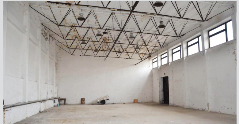
■ Nowa hala będzie wizytówką, stara odejdzie w zapomnienie