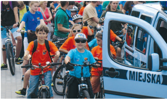
Straż Miejska bliżej obywatela / str. 2