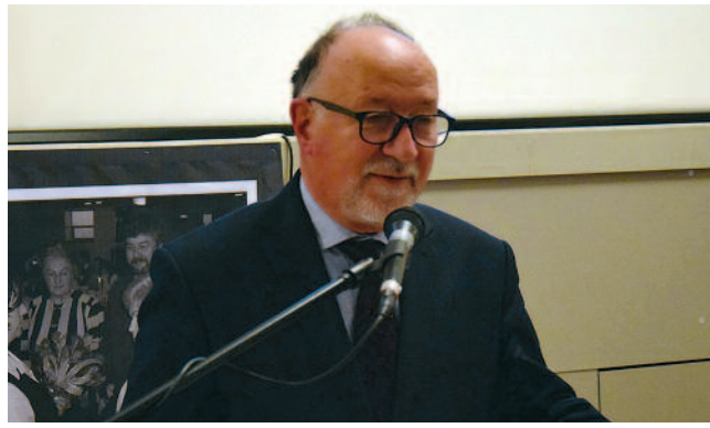
Wspomnienia ze stanu wojennego / str. 11