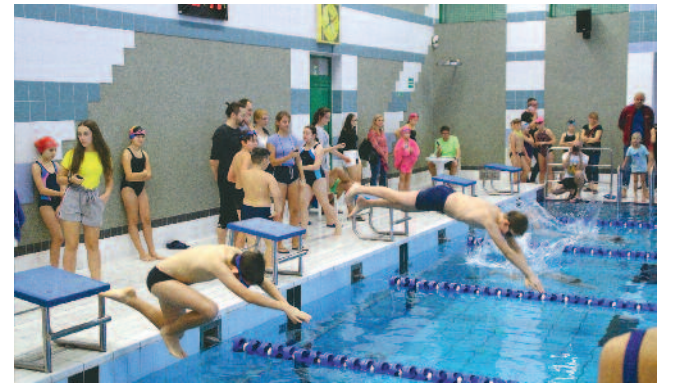
Z Mikołajem... do wody! / str. 9