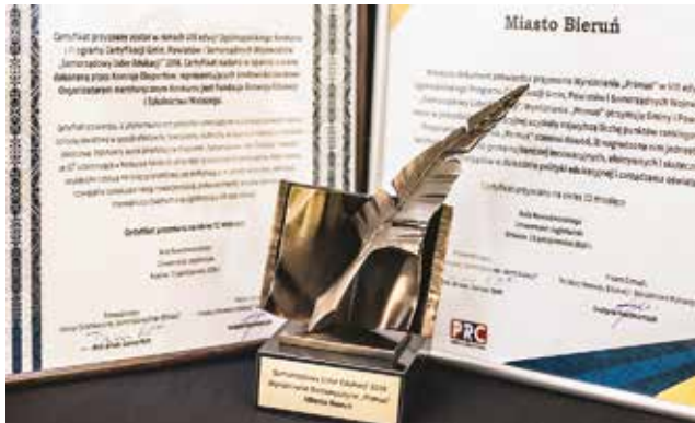
Kolejne nagrody dla Bierunia / str. 11