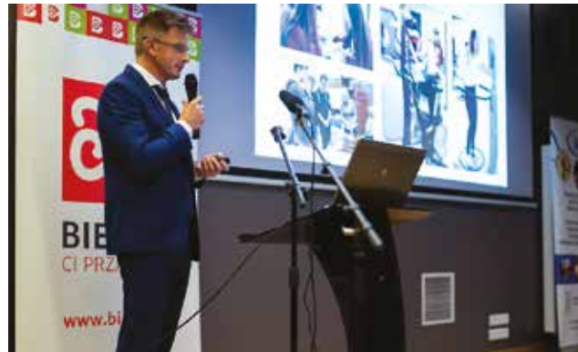
Konferencja Metropolitalna / str. 13