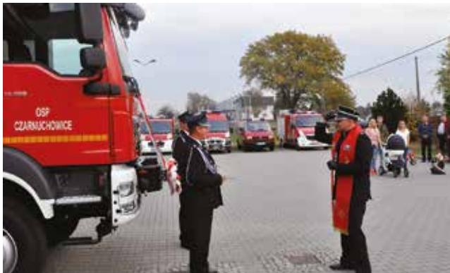
Nowy wóz bojowy / str. 6