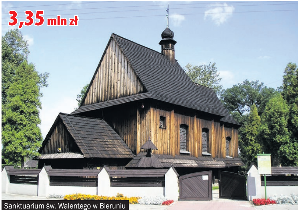
Sanktuarium św. Walentego w Bieruniu

S anktuarium św. Walentego w Bieruniu i kościół Najświętszego Serca Pana Jezusa w Bieruniu Nowym - to dwa obiekty sakralne, które odzyskają blask dzięki rządowemu wsparciu.