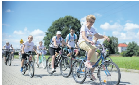
Święto rodzin i rowerzystów