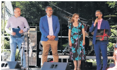
Polak - Czech dwa bratanki