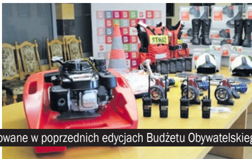
Investycje zrealizowane w poprzednich edycjach Budżetu Obywatelskiego Miasta Bierunia.