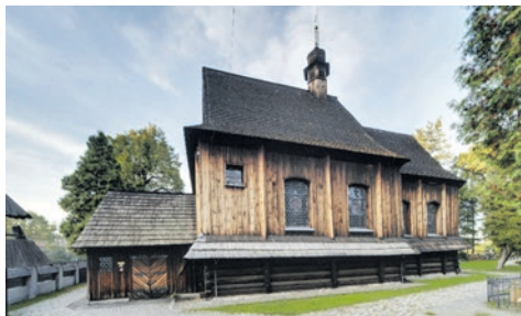
Bieruńskie świątynie odzyskują blask