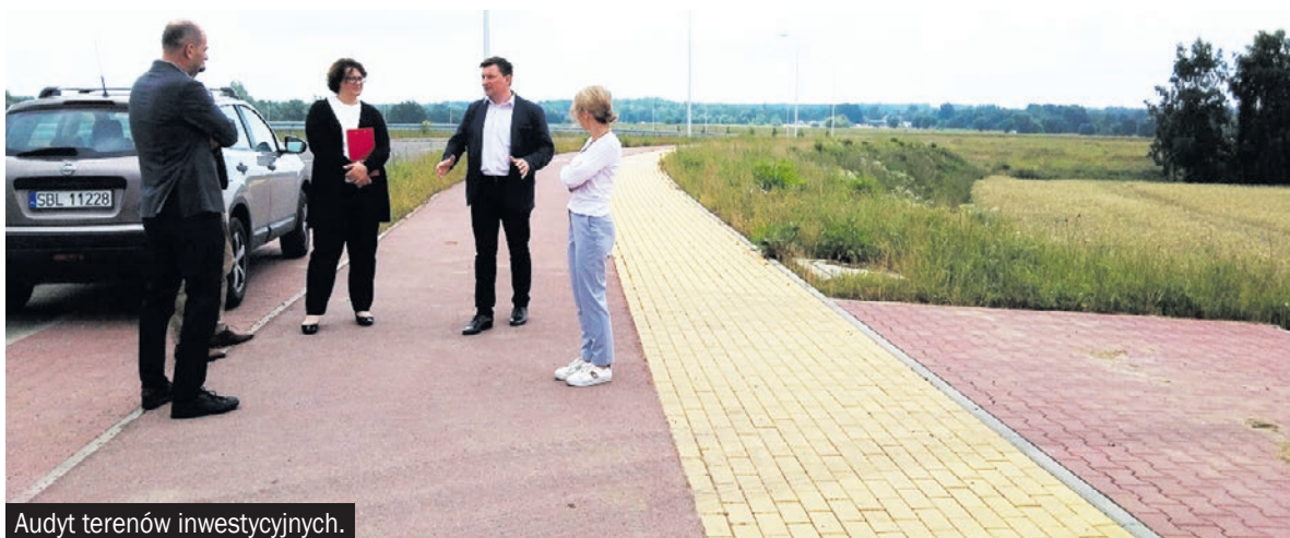
Audyt terenów inwestycyjnych.

Przedstawiciele Śląskiego Centrum Obsługi Inwestora i Eksportera oraz Polskiej Agencji Inwestycji i Handlu SA przeprowadzili audyt terenów inwestycyjnych, które zakwalifikowały się do II etapu ogólnopolskiego konkursu Grunt na Medal 2023. Wśród najlepszych gmin, pod względem atrakcyjności inwestycyjnej, jest Bieruń.