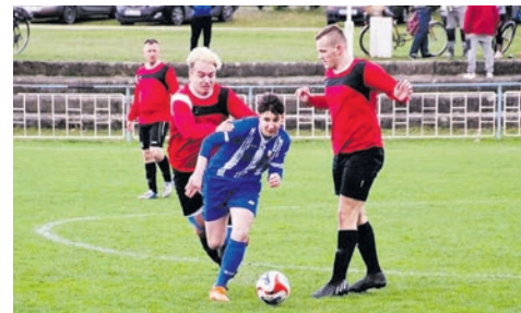
Ostatni taki sezon