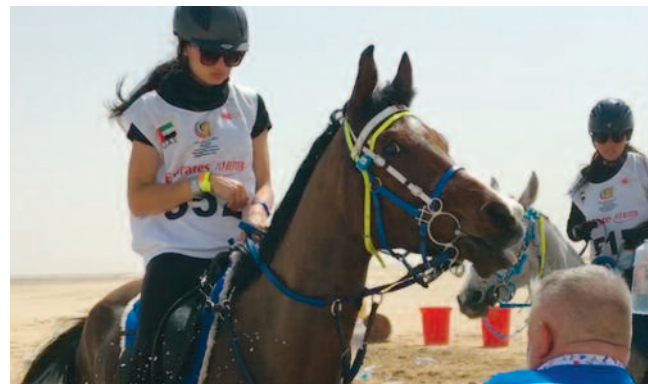
Na koniu przez pustynię / str. 13