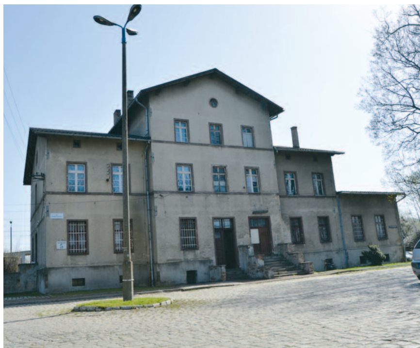
Tak obecnie wygląda budynek dworca

Wybudowanie nowoczesnej drogi rowerowej wzdłuż ulicy Węglowej, komunikującej obecną drogę rowerową łączącą część starobieruńską i nowobieruńską z Plantami Karola.