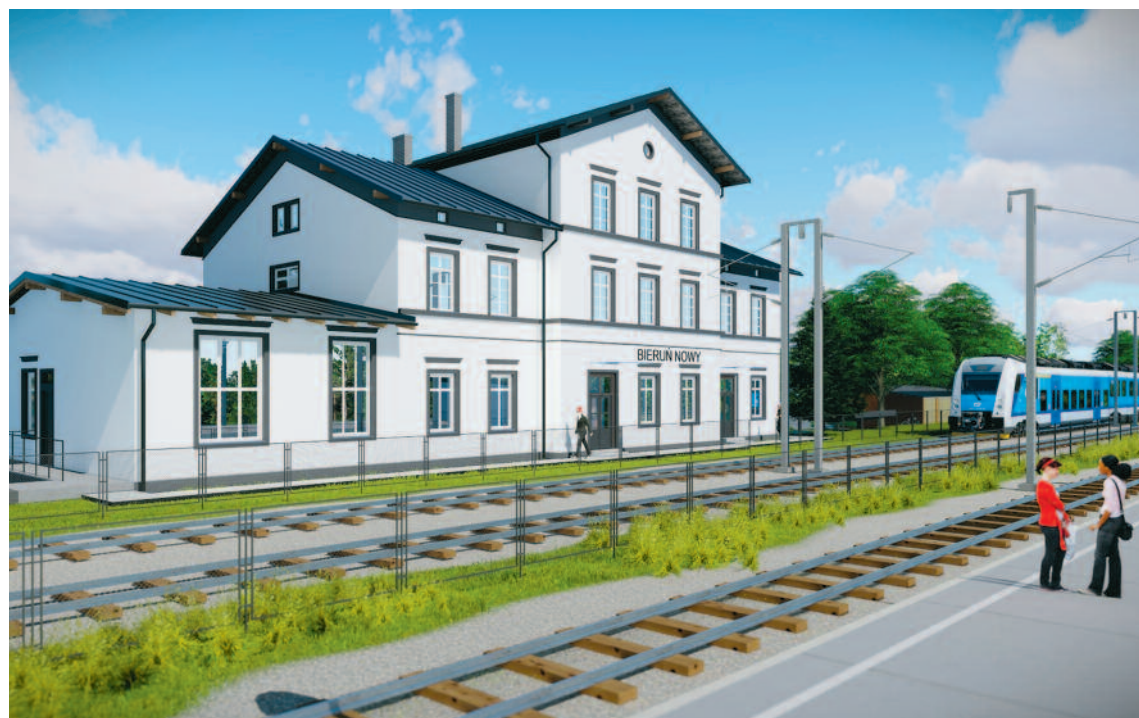
Pod koniec 2020 r. budynek dworca będzie wyglądał tak jak na wizualizacji

Aby zrozumieć, jaki wielki remont czeka budynek nowobieruńskiego dworca wspomnijmy, że zakres prac budowlanych obejmuje m.in.: