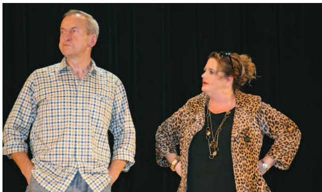
Teatralna niedziela pełna barw / str. 8