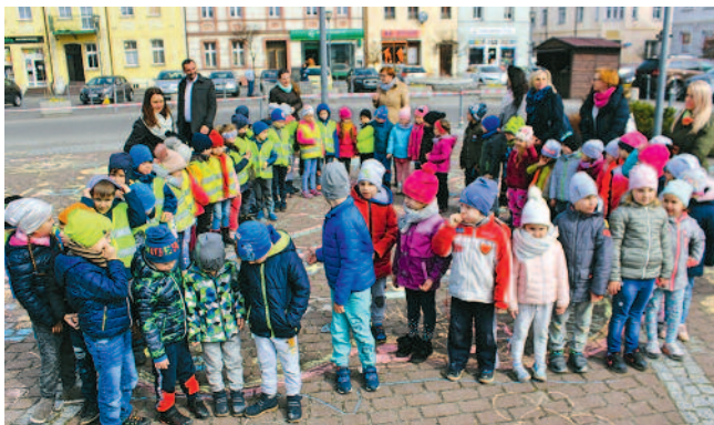
Przedшкоlaki prажą Bieruniowi / str. 7