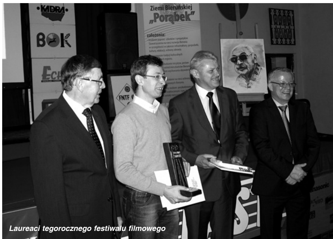
Laureaci tegoroczного festiwalu filmowego

– Tegoroczny przegląd cieszył się sporym zainteresowaniem nie tylko środowisk filmowych ale co najważniejsze – publiczności aktywnie uczest-