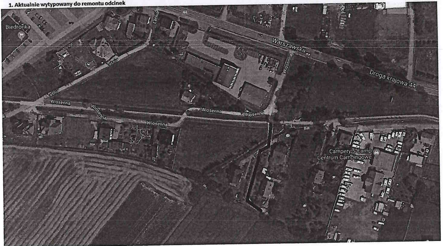
2. Wnioskowany do remontu odcinek