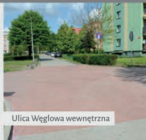
Ulica Węgłowa wewnętrzna