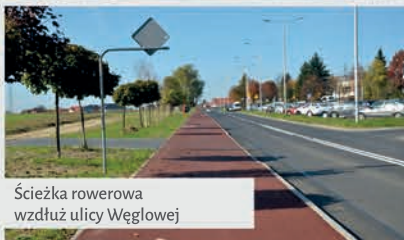
Ścieżka rowerowa wzdłuż ulicy Węglowej