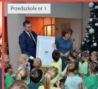
Przedszkole nr 1