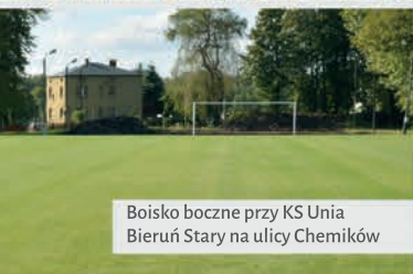
Boisko boczne przy KS Unia Bieruń Stary na ulicy Chemików