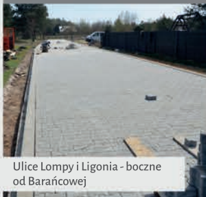
Ulice Lompy i Ligonia - boczne od Barańcowej