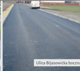
Ulica Bijasowicka boczna