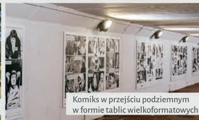
Komiks w przejściu podziemnym w formie tablic wielkoformatowych