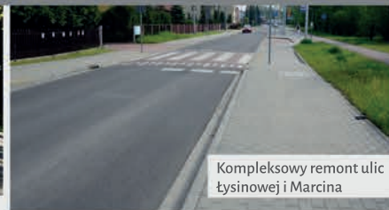
Kompleksowy remont ulic Łysinowej i Marcina