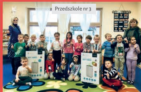
Przedszkole nr 3