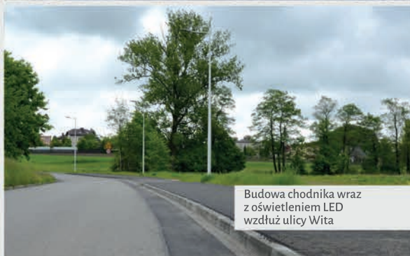
Budowa chodnika wraz z oświetleniem LED wzdłuż ulicy Wita