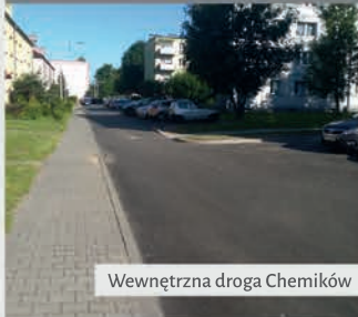
Wewnętrzna droga Chemików