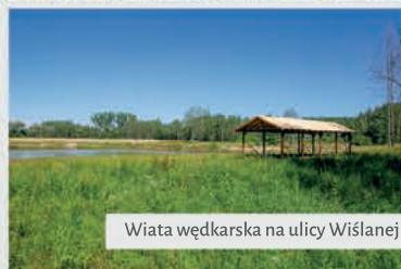
Wiatka wędkarska na ulicy Wiślanej