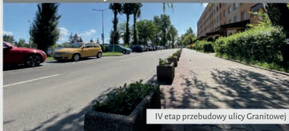
IV etap przebudowy ulicy Granitowej