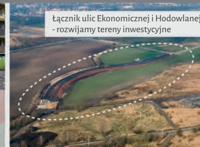
Łącznik ulic Ekonomicznej i Hodowlanej - rozwijamy tereny inwestycyjne