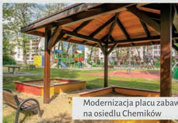
Modernizacja placu zabaw na osiedlu Chemików