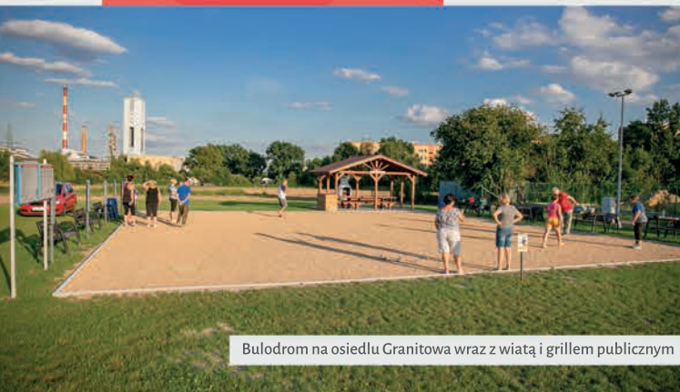
Bulodrom na osiedlu Granitowa wraz z wiatą i grillem publicznym