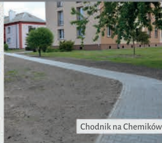
Chodnik na Chemików