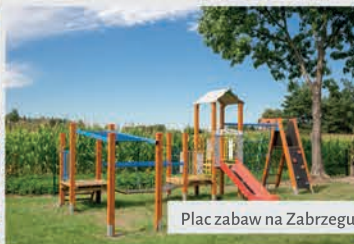
Plac zabaw na Zabrzegu