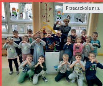
Przedszkole nr 2

Urządzenia te dostępne są dla dzieci we wszystkich filiach naszych przedszkoli.