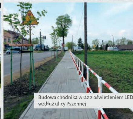
Budowa chodnika wraz z oświetleniem LED wzdłuż ulicy Pszennej