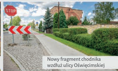
Nowy fragment chodnika wzdłuż ulicy Oświęcimskiej