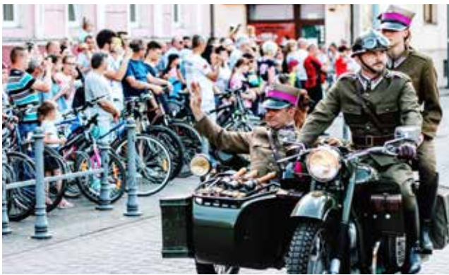
Majówka dla Niepodległej / str. 8