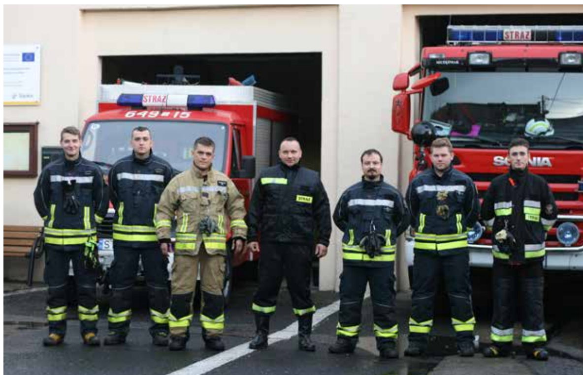
■ OSP Bieruń Stary

Strażacy zgodnie stwierdzają, że pomimo tego, że są w ciągłej gotowości największym wyzwaniem jest dla nich walka z czasem. Często to właśnie sekundy decydują o tym, jakie skutki przyniesie ze sobą dane zdarzenie. Strażacy ochotnicy w remizie spotykają się najczęściej w wolnym czasie i to nie wszyscy. Wszyscy jednak są powiadamiani w razie wypadku. W tej