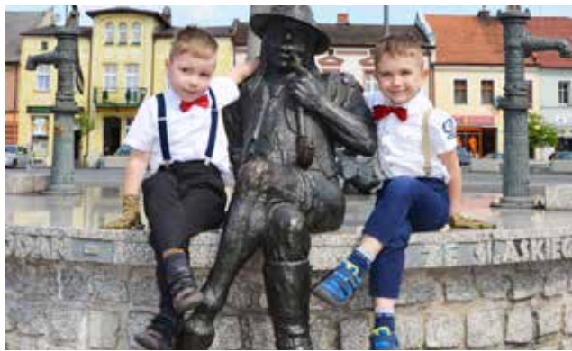
Ekologiczni przedszkolacy / str. 9