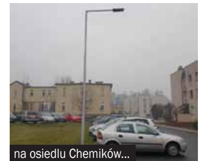
na osiedlu Chemików...