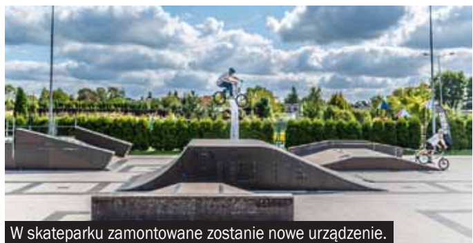
W skateparku zamontowane zostanie nowe urządzenie.

Największą inwestycją będzie „Modernizacja infrastruktury sportowo-rekreacyjnej na terenie gminy Bieruń”, która składa się z trzech zadań.