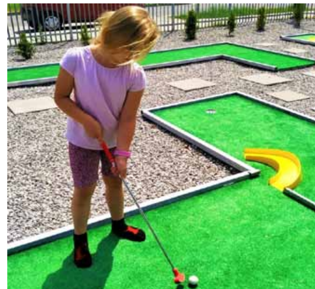
Projekt zakłada budowę 3 torów do minigolfa (zdjęcie poglądowe).

W ramach Budżetu Obywatelskiego 2023 na osiedlu Granitowa powstanie pole do minigolfa. Nowy obiekt pojawi się nieopodal bulvaru i towarzyszącej mu infrastruktury, które to w całości wybudowane zostały dzięki zadaniom wybranym do realizacji przez mieszkańców w poszczególnych edycjach Budżetu Obywatelskiego.