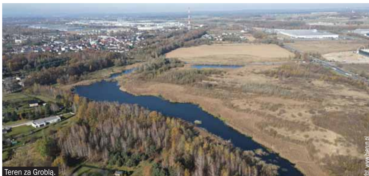
Teren za Groblą.