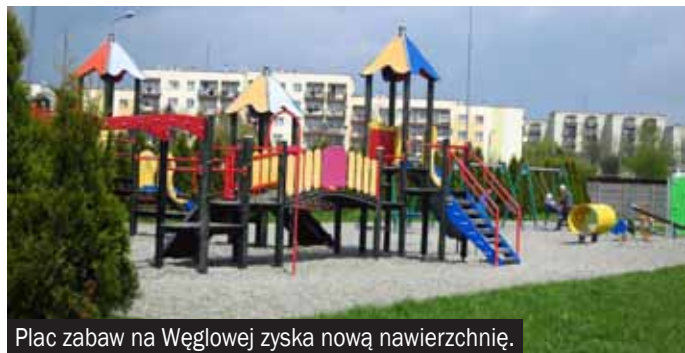
Plac zabaw na Węglowej zyska nową nawierzchnię.