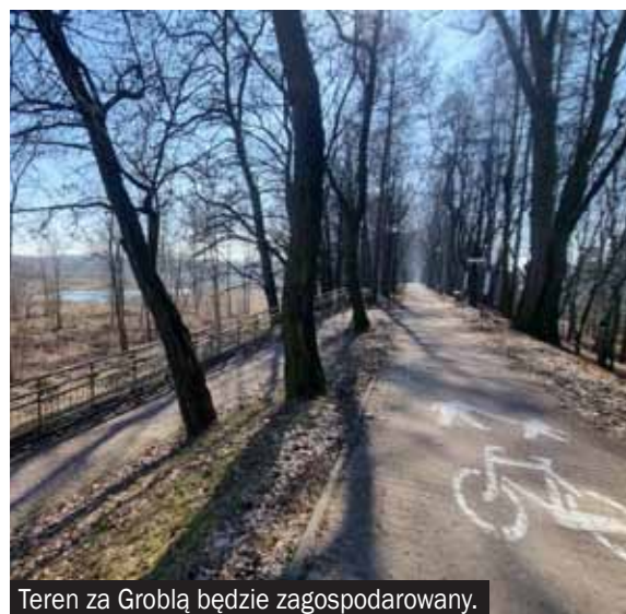
Teren za Groblą będzie zagospodarowany.