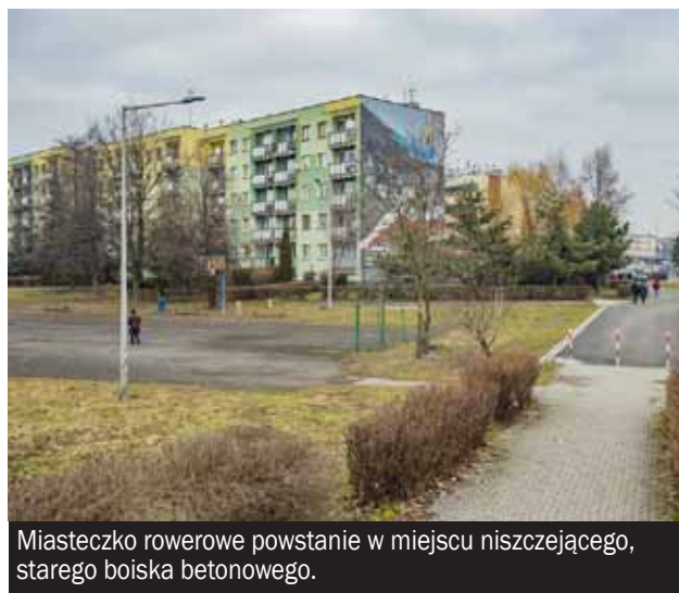
Miasteczko rowerowe powstanie w miejscu niszczonego, starego boiska betonowego.

W roku 2023 powstanie stacjonarne Miasteczko Ruchu Drogowego na osiedlu Granitowa, przy ulicy Warszawskiej - w miejscu istniejącego starego boiska betonowego. Wokół obiektu pojawi się zieleń i mała architektura plenerowa. Miasto zdobyło na tę inwestycję prawie pół miliona złotych dofinansowanie ze środków Unii Europejskiej. Zrealizowanych zostanie też kilka innych zadań w terenie, które poprawią bezpieczeństwo pieszych oraz innych użytkowników ruchu drogowego.