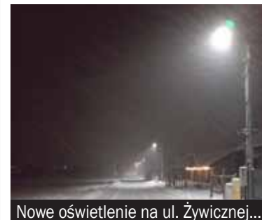
Nowe oświetlenie na ul. Żywicznej...

To już kolejny etap rewolucji oświetleniowej, którą konsekwentnie prowadzona jest w Bieruniu. Na przestrzeni minionych sześciu lat w naszym mieście pojawiło się ponad 1000 nowych oprav oświetleniowych.