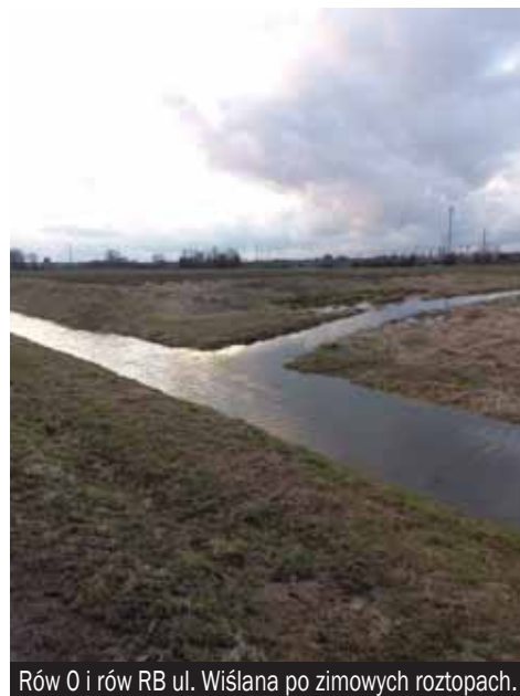
Rów 0 i rów RB ul. Wiślana po zimowych roztopach.

Brak natychmiastowej reakcji skutkuje nadmiernym nawodnieniem - zachwianiem stosunków wodnych w terenie.