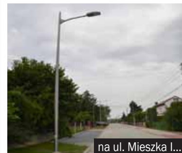
na ul. Mieszka I...