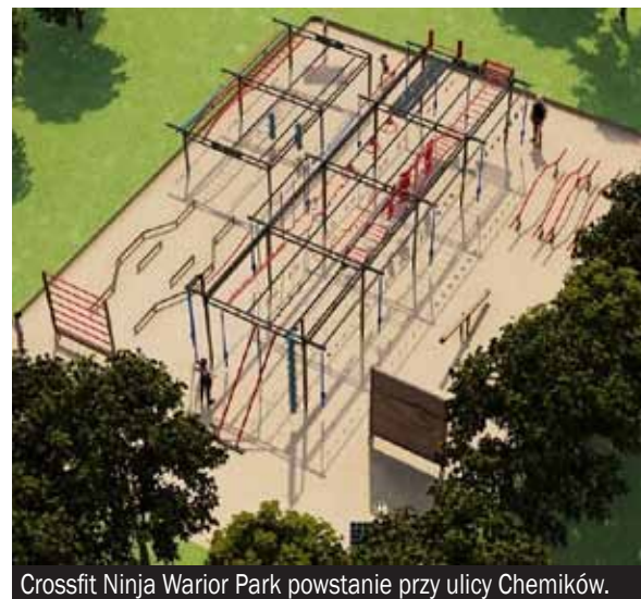
Crossfit Ninja Warrior Park powstanie przy ulicy Chemików.

Od kilku lat sukcesywnie rozwijana jest infrastruktura sportowa przy stadionie KS Unii Bieruń Stary (obiekt zarządzany przez BOSiR). Wszystko za sprawą Budżetu Obywatelskiego i zadań, które głosami mieszkańców wybierane są do realizacji. W tym roku na obiekcie powstanie Crossfit Ninja Warrior Park, a więc konstrukcja treningowa dla zawodnika OCR. Pojawią się także zestawy ławek rezerwowych przy boisku piłkarskim. Oba zadania zrealizowane zostaną w ramach Budżetu Obywatelskiego Miasta Bierunia 2023.