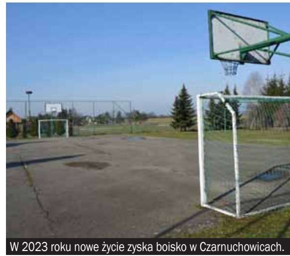
W 2023 roku nowe życie zyska boisko w Czarnuchowicach.

W tym roku „metamorfozę” przejdzie również boisko w Czarnuchowicach. Stary obiekt zlokalizowany przy budynku filii Przedszkola nr 2 na ulicy Mielęckiego zyska nowoczesną, bezpieczną nawierzchnię. Pojawią się też nowe bramki, kosze i piłkochwyty. Przypomnijmy, że Gmina Bieruń od kilku lat systematycznie modernizuje boiska sportowe w poszczególnych dzielnicach. Chodzi o stworzenie mieszkańcom dobrych warunków do uprawiania sportów zespołowych. Nowoczesne boiska pojawiły się już: w Ścierniach i Bijasowicach.