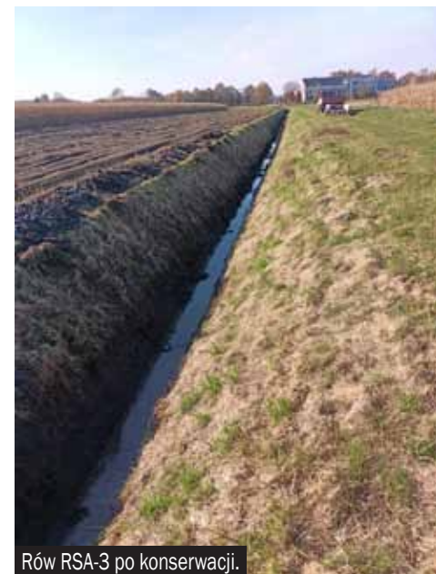
Rów RSA-3 po konserwacji.

Dodatkowo coraz częściej spotykamy się z faktem uszkodzenia urządzeń melioracyjnych podczas wszelkich prac budowlanych oraz polowych. W trakcie prac budowlanych uszkodzeniom ulegają drenaże, a istniejące rowy zostają zasypywane ponieważ (szczególnie w latach suchych) wydają się być niepotrzebne. Z kolei podczas prac polowych należy pamiętać o zasadności pozostawienia przynajmniej 0,5 m korony rowu. Niezbędne to jest dla prac konserwacyjnych oraz dla zachowania stabilności skarpy rowu (zbyt bliska uprawa gruntu powoduje stopniowe uszkadzanie i zasypywanie rowu). Według Prawa Wodnego