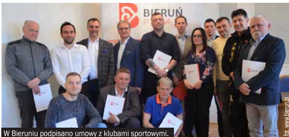
W Bieruniu podpisano umowy z klubami sportowymi.

Kwota przyznanych w tym roku dotacji jest wyjątkowo duża i wynosi blisko 800 tys. zł. Jej zapewnienie było możliwe dzięki wpisaniu do „Strategii rozwoju sportu” obiektywnego wskaźnika odnoszącego się do planowanych przychodów podatku od nieruchomości. Każdy kto złożył wniosek, otrzymał dotację, by móc promować sport w Bieruniu i motywować młodych zawodników do tego, żeby trenowali i osiągnęli jak najlepsze wyniki sportowe.