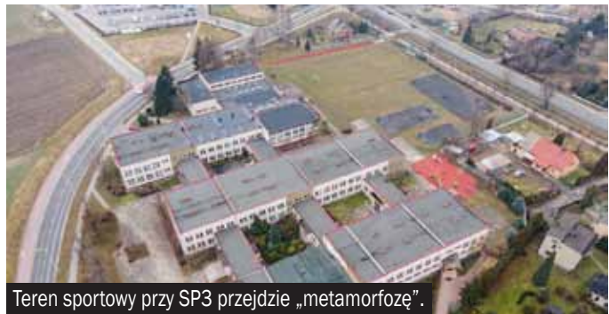
Teren sportowy przy SP3 przejdzie „metamorfozę”.