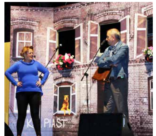
Teatr dla Dorosłych kolejny raz zebrał gromkie brawa