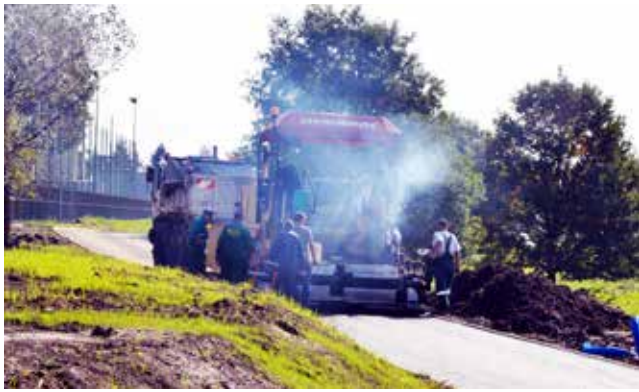
Planty Karola wkrótce gotowe / str. 4