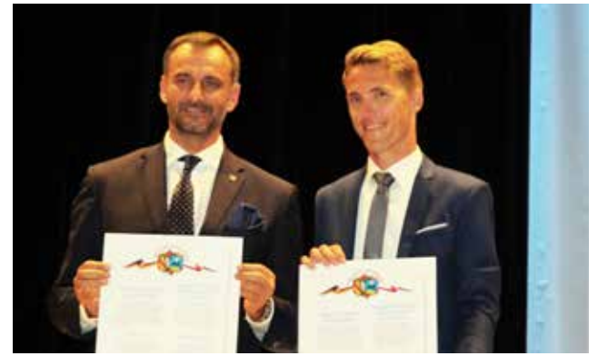
Dni Bierunia / str. 8