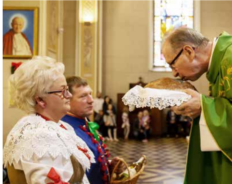
Dożynki w kościele