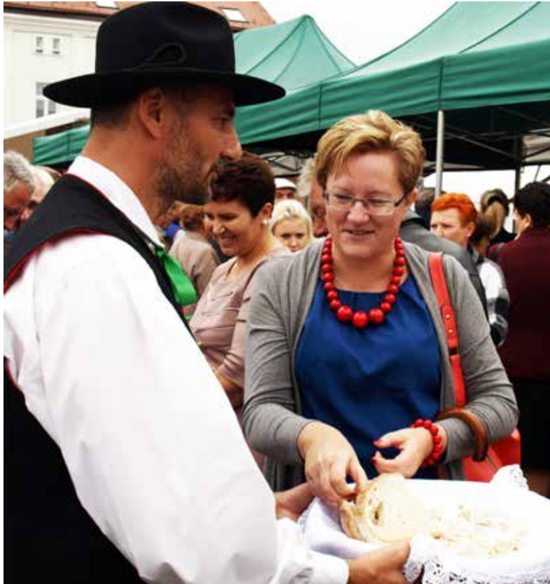
Burmistrz częstuje gości chlebem