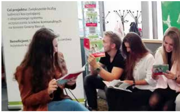
Miliony na oczyszczalnię ścieków / str. 5