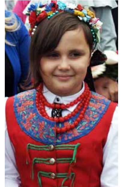
Piękne kolorowe tradycyjne stroje