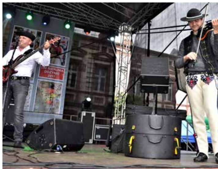
Przed publicznością wystąpił zespół Baciary