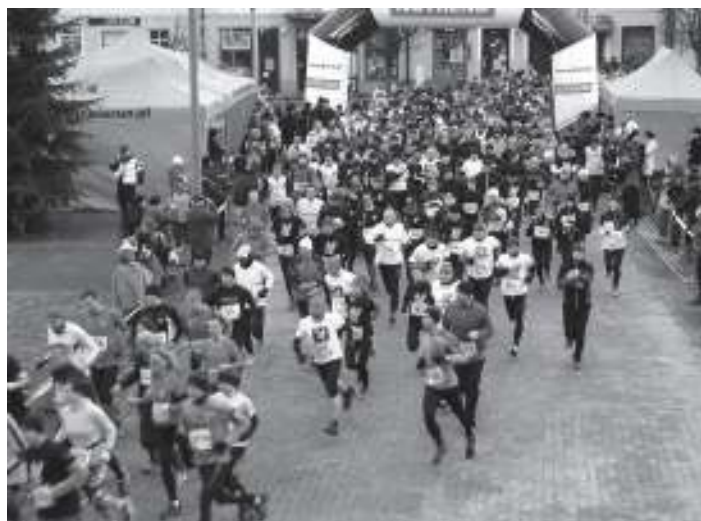
Tak było w styczniu 2015. Jak będzie tym razem?

wszystkich mieszkańców Bierunia i okolic. Wzorem pierwszej edycji biegu, będzie to święto sportu z udziałem naszych lokalnych klubów, stowarzyszeń oraz rękodzielników. Każdy gość będzie mógł postrzelać, wspinać się na ściance, zobaczyć jak wyglądają treningi sportów walki, poznać zasady taktyki paintball i wiele wiele innych. Organizatorzy przewidzieli także szereg atrakcji dla dzieci: gry, zabawy, malowanie twarzy itd. Nie zabraknie także czegoś dla podniebienia. Oprócz stoiska gastronomicznego, będą także dostępne wyroby lokalnych cukierników i piekarzy.