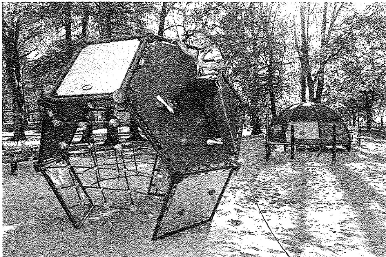
---NIVEA PLAC ZABAW0330.jpg