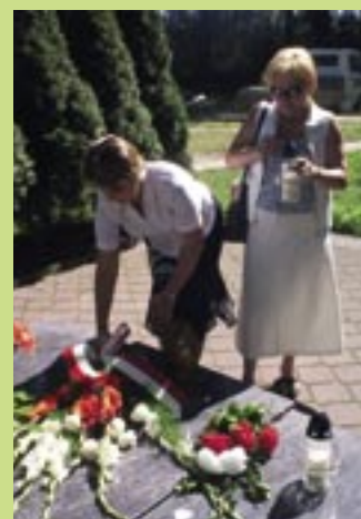
Na zdjęciu: delegacja Bieruńskiego Ośrodka Kultury składa hołd poległym Bieruniakom.