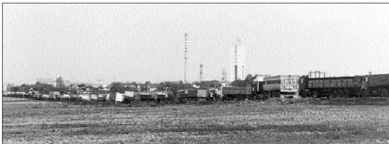
Czy kolejka po węgiel na ulicy Bogusławskiego przestanie dokuczać mieszkańcom?

(tzn. nie przysporzono ani jednego bezrobotnego). Dzięki umiejętnej polityce personalnej oraz istniejącemu systemowi osłon socjalnych udało się zachować wszystkie wskaźniki zatrudnienia łącznie z wydajnością, zlikwidowano niektóre stanowiska poprzez przekwalifikowania bądź odejścia na świadczenia socjalne. Załoga Ruchu II początkowo nieufna dzisiaj już całkowicie zasymilowana pokazuje swoje możliwości. A możliwości to właśnie ten poziom