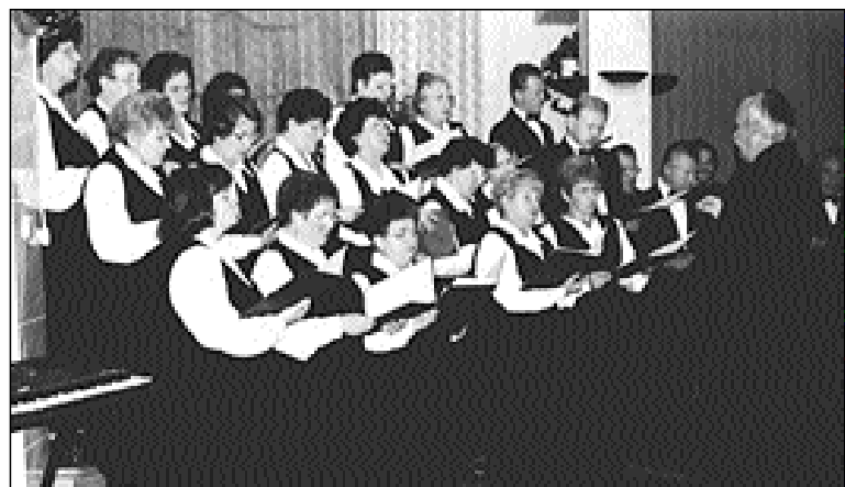
Od redakcji: Fotografie chórów wykonano podczas innych koncertów.