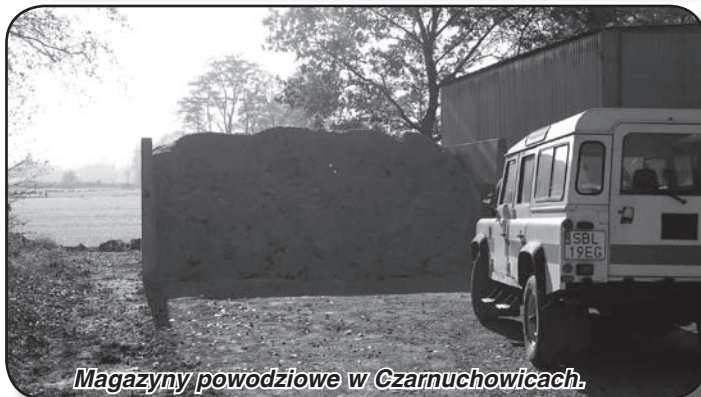
Magazyny powodziowe w Czarnuchowicach.