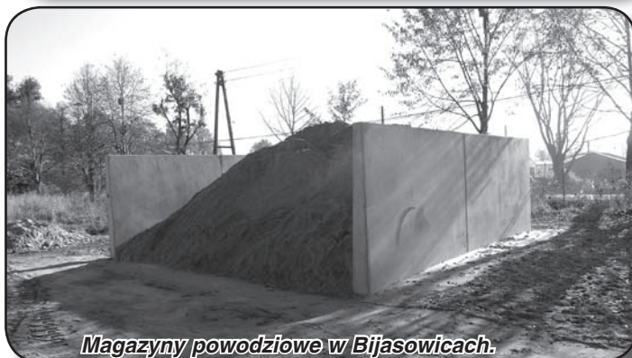
Magazyny powodziowe w Bijasowicach.