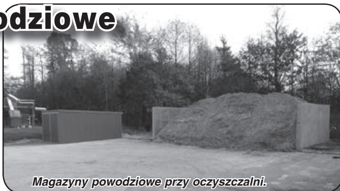
Magazyny powodziowe przy oczyszczalni.

Łączny koszt wykonania wszystkich magazynów wraz z wyposażeniem wynosi 306 913,44 zł brutto. Dzięki realizacji zadania gmina Bieruń jest przygotowana na pierwszy etap zagrożenia powodziowego.