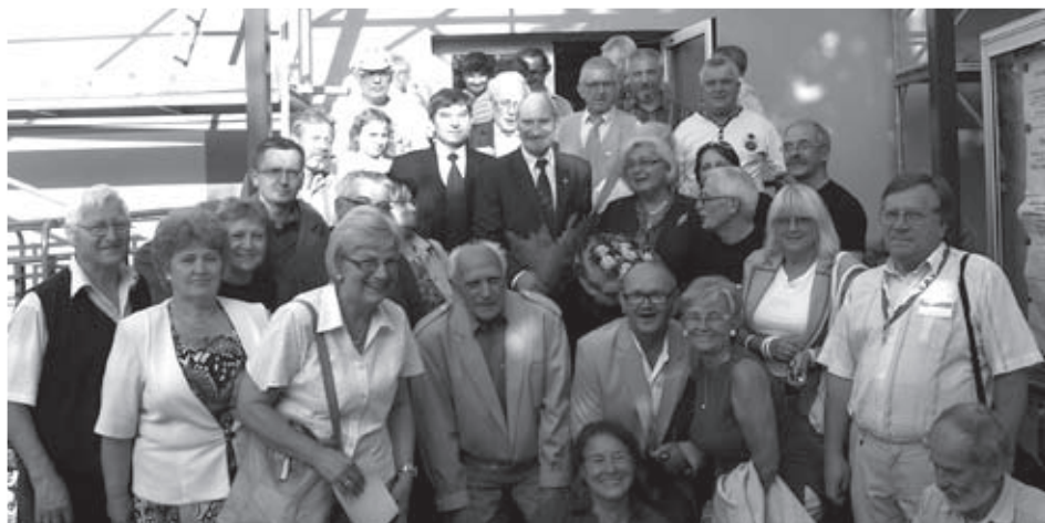
Byli minister, poseł i przewodniczący parlamentarnego zespołu do zbadania przyczyn katastrofy smoleńskiej Antoni Maciurewicz był gościem spotkania, które odbyło się we wtorek 16 sierpnia w hali sportowej przy Gimnazjum nr 2.

Jestem w ścisłej czołówce posłów, którzy pracowali nad największą liczbą ustaw. Cieszę się, że udało mi się wprowadzić wiele nowych rozwiązań do polskiego prawa, jak na przykład okręgi jednomandatuowe do Senatu, majątkową odpowiedzialność urzędników za naruszające prawo decyzje, zmiany dotyczące informatyzacji administracji i ułatwienia w obsłudze obywateli. W okręgu wyborczym mam cztery biura i staram się współpracować z samorządami.