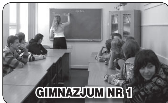
GIMNAZJUM NR 1

Największą zmianą w stosunku do lat ubiegłych jest nowa podstawa programowa dla uczniów klas pierwszych, a co za tym idzie nowe podręczniki. Uczniowie rozpoczynają naukę w bardzo dobrych warunkach. Podczas wakacji pomalowano korytarz i sale w starej części szkoły, odnowiono również pracownię języka niemieckiego oraz toalety. (G.B)