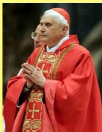
Kardynał Joseph Ratzinger został we wtorek (19 kwietnia) kolejnym następcą św. Piotra.

grzebie Jana Pawła II w Watykanie. Tyle osób liczyła nasza grupa. Bierunian było więcej. Jeszcze tylko pospieszne zwiedzanie deszczowego Rzymu i dwudziestotrzynastogodzinny powrót w śniegu i deszczu do domu.