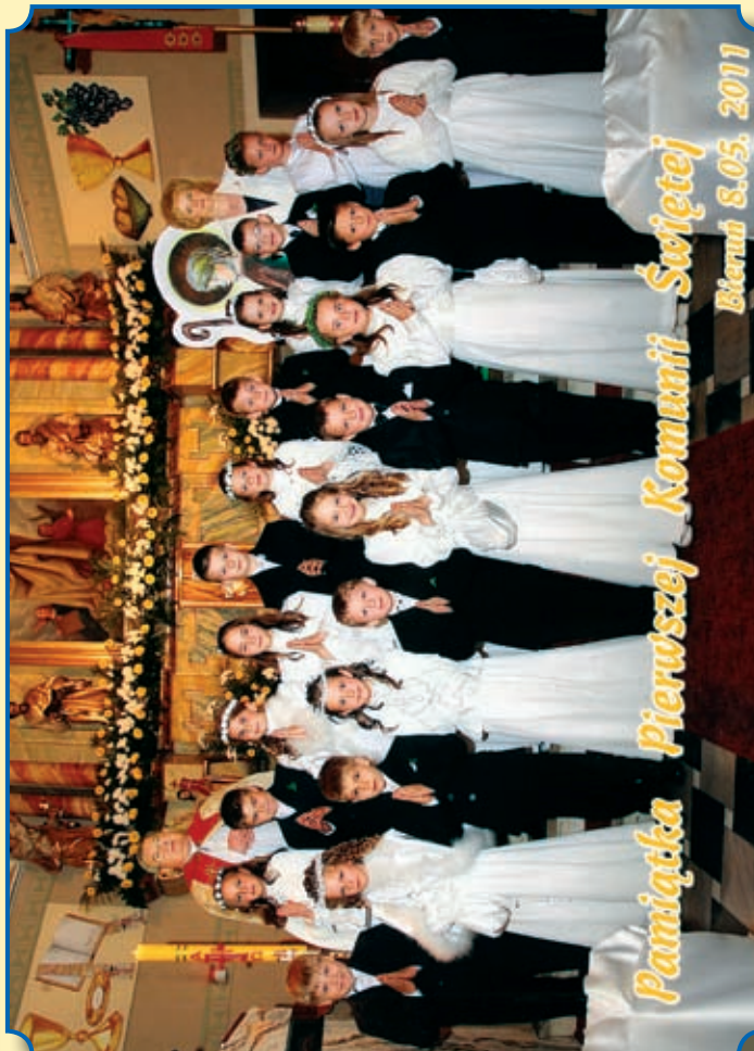
Pamiętka Pierwszej Komunii Świętej