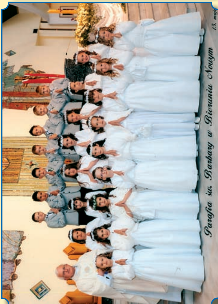
Parafia św. Barbary w Bieruniu Nowym