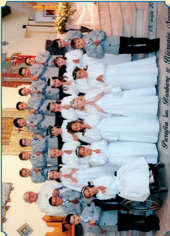
Parafia św. Barbary w Bieruniu Nowym