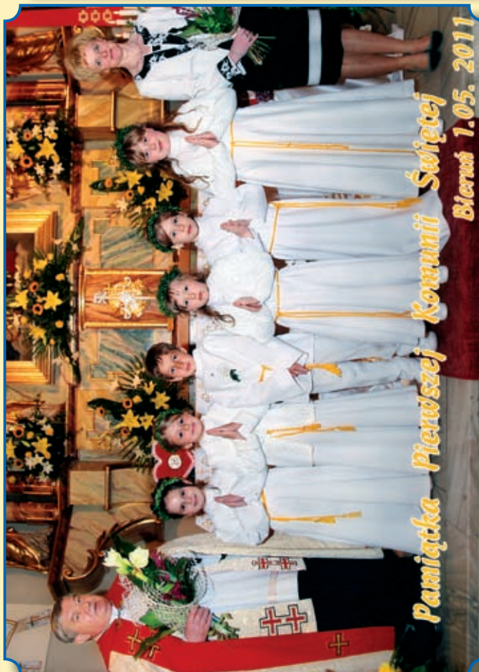
Pamiętka Pierwszej Komunii Świętej