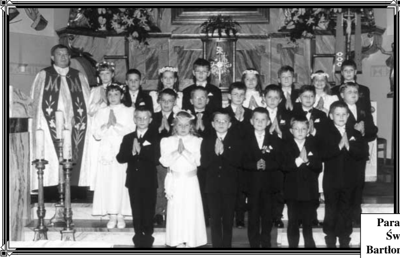
Parafia Św. Bartłomieja