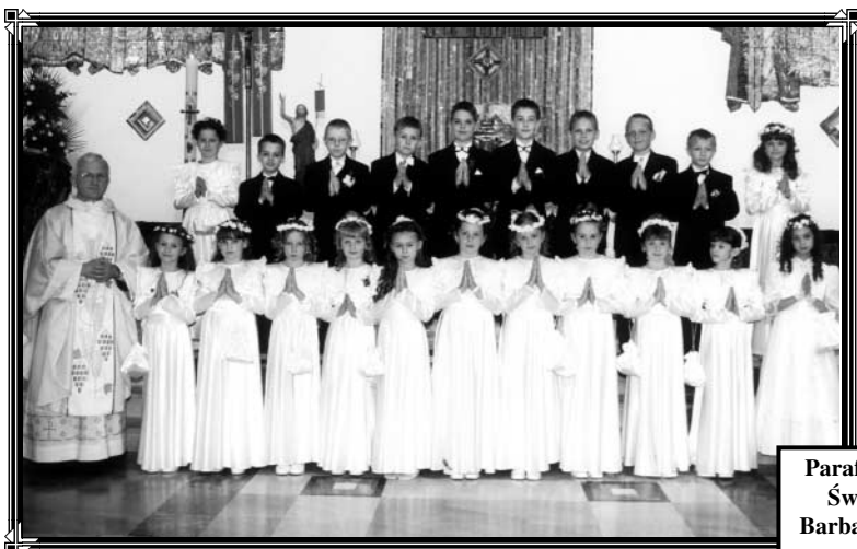
Parafia Św. Barbary