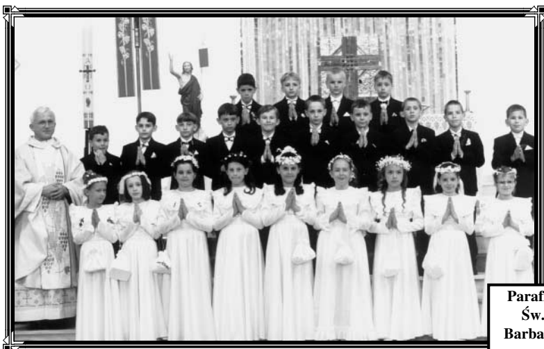
Parafia Św. Barbary