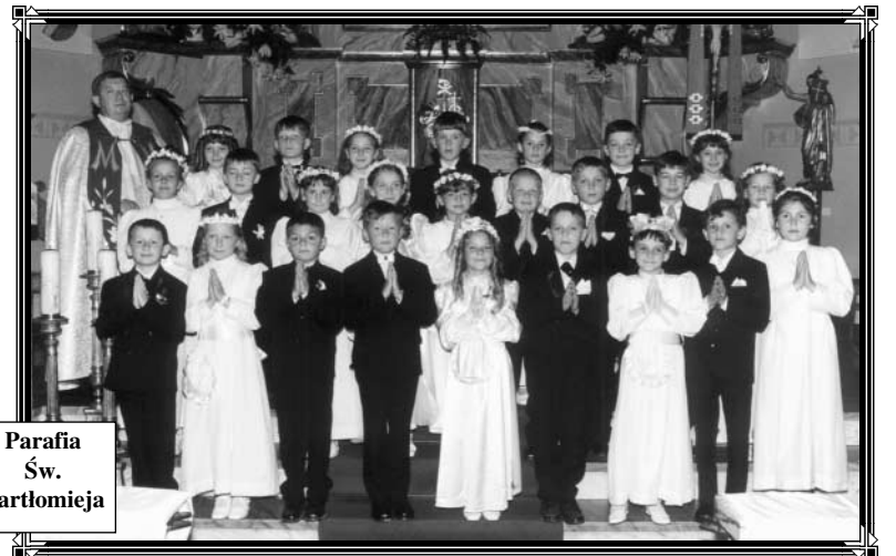
Parafia Św. Bartłomieja