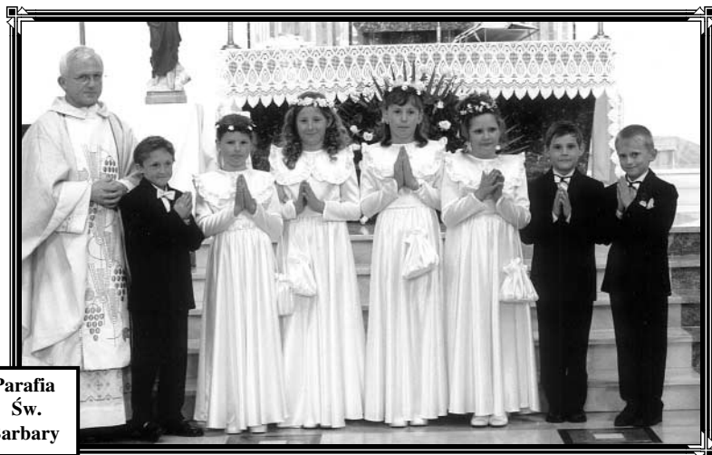
Parafia Św. Barbary