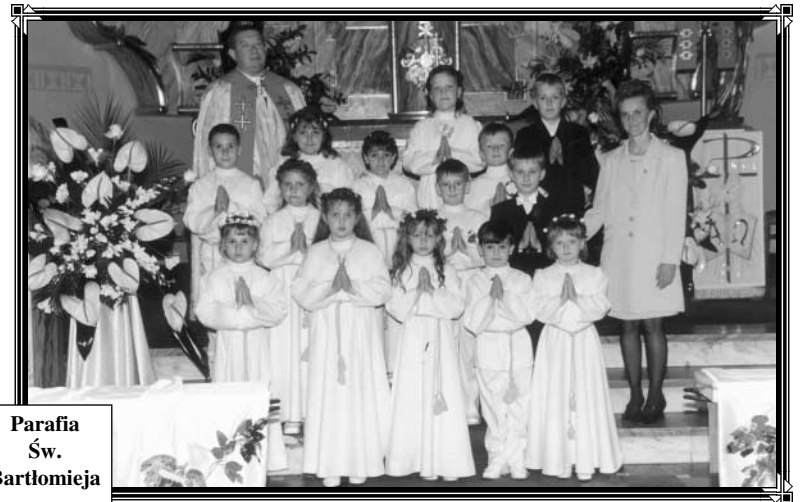
Parafia Św. Bartłomieja