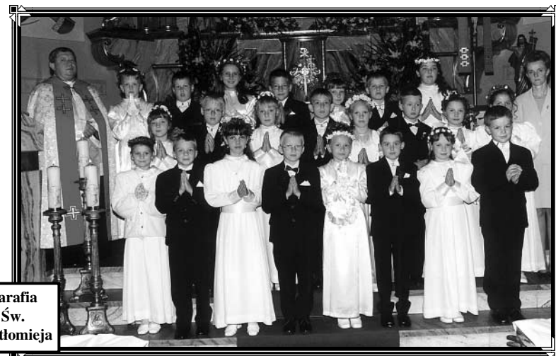
Parafia Św. Bartłomieja