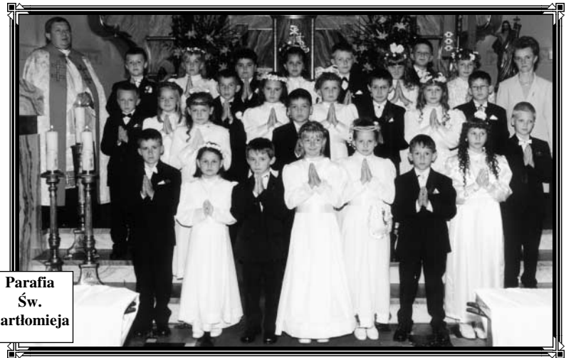
Parafia Św. Bartłomieja