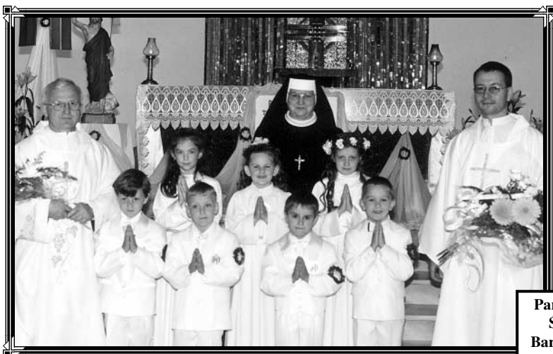
Parafia Św. Barbary