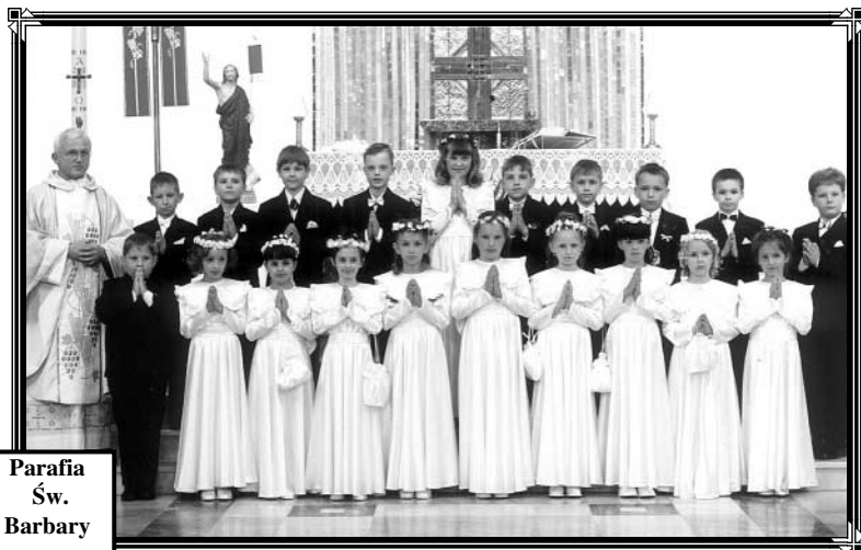
Parafia Św. Barbary