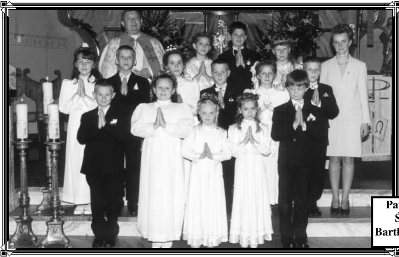
Parafia Św. Bartłomieja