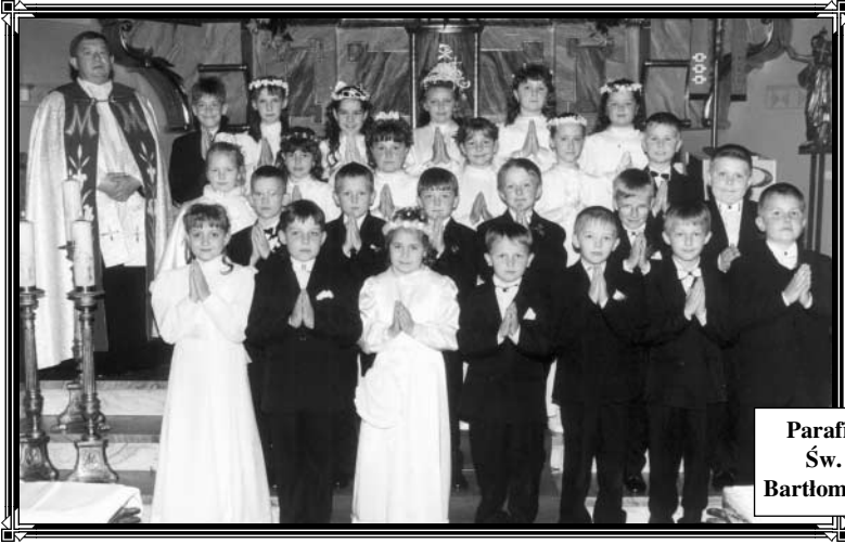
Parafia Św. Bartłomieja