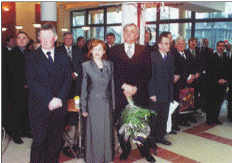
Uroczystość otwarcia zgromadziła wielu znamienitych gości.

MIESIĘCZNIK SPOŁECZNO-KULTURALNY BIERUNIA