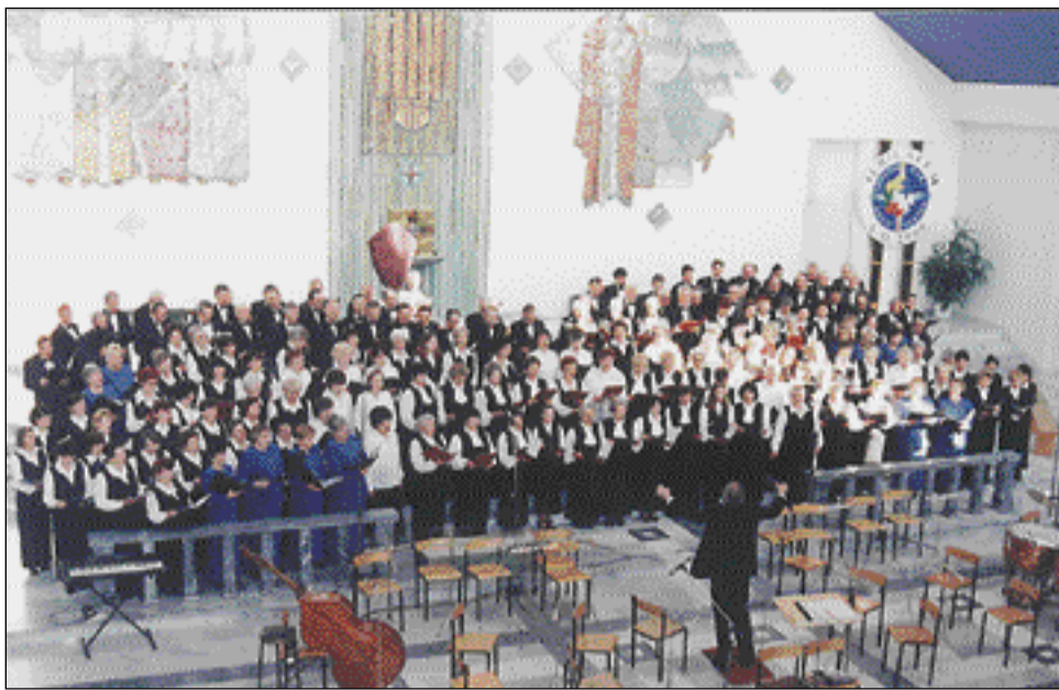
Festiwal pieśni pasyjnej