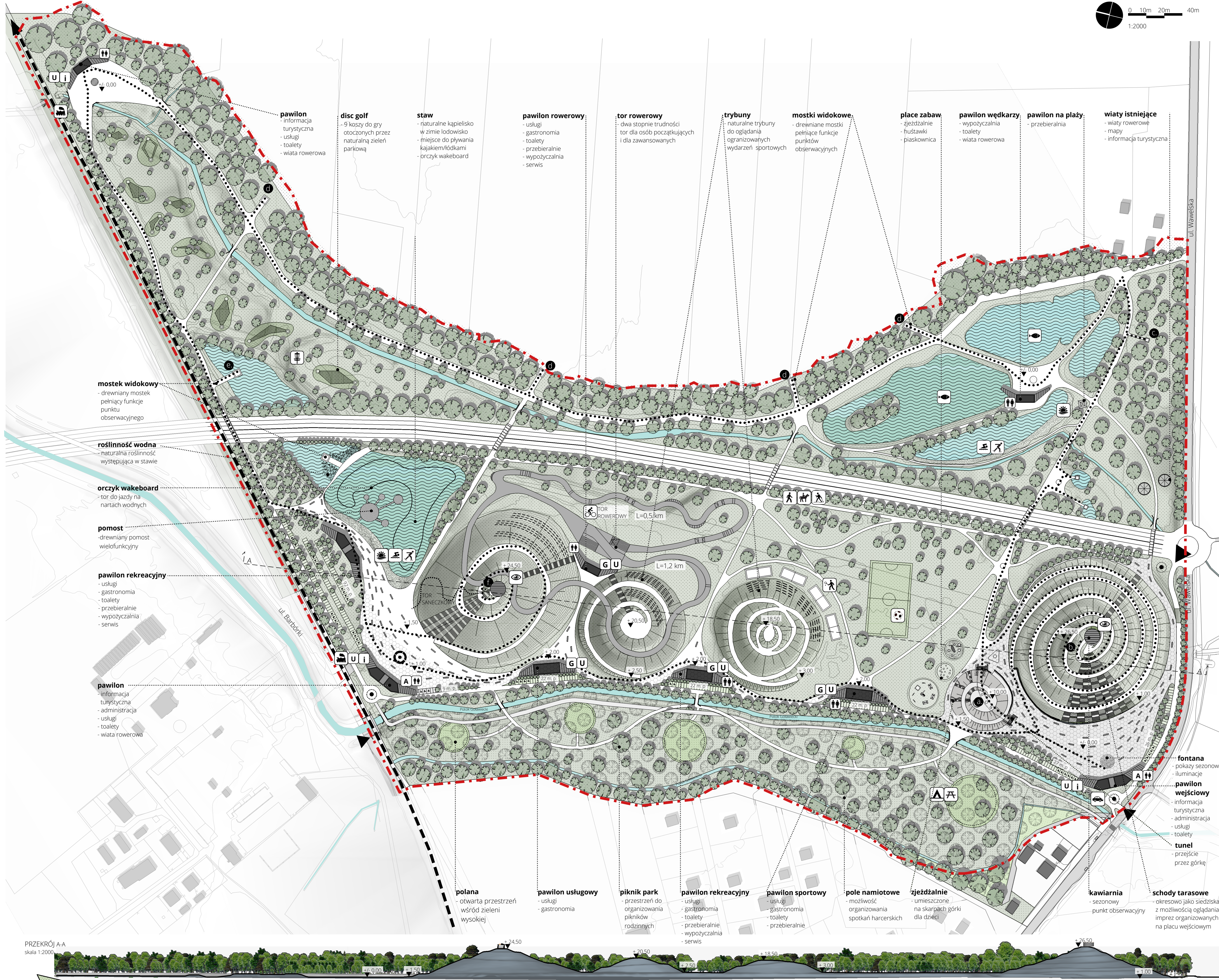
PRZĘKRÓJ A-A skala 1:2000