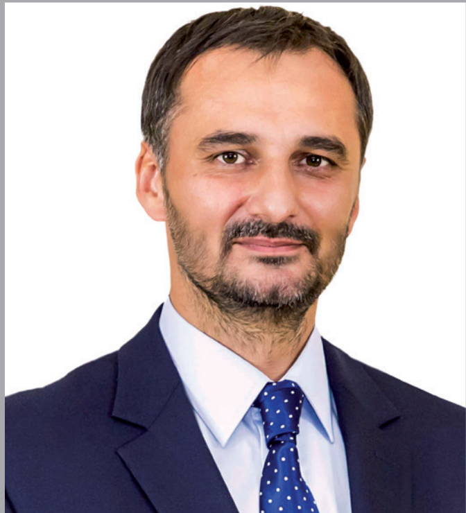
Burmistrz Krystian Grzesica